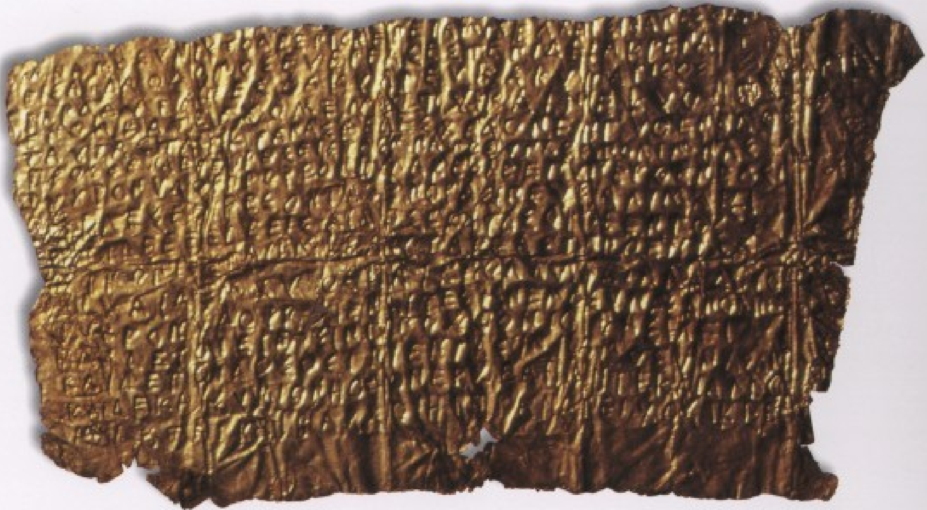
zlatá tabulka z Hipponionu