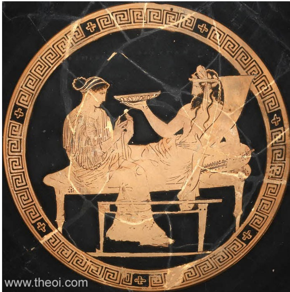
Hádes a Persefona