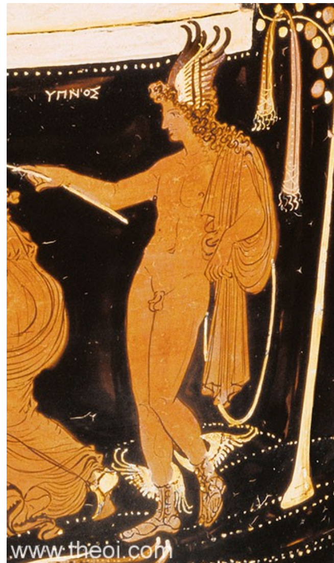
Hypnos (vlevo s Theseem a Ariadnou)