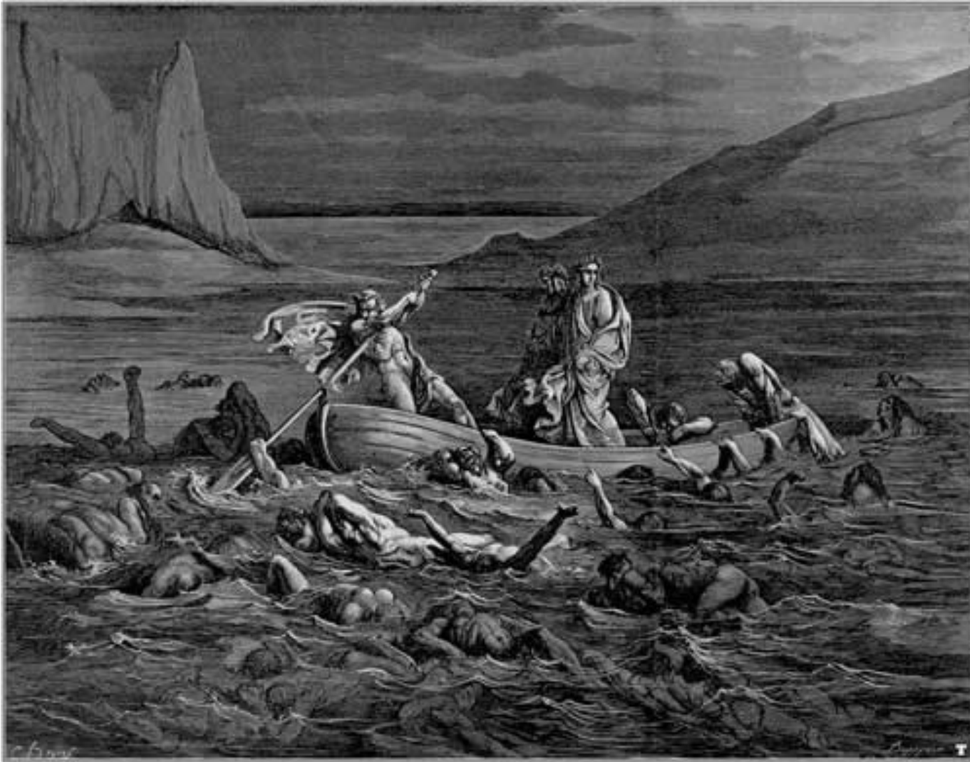
Gustav Doré: Plavba přes Styx