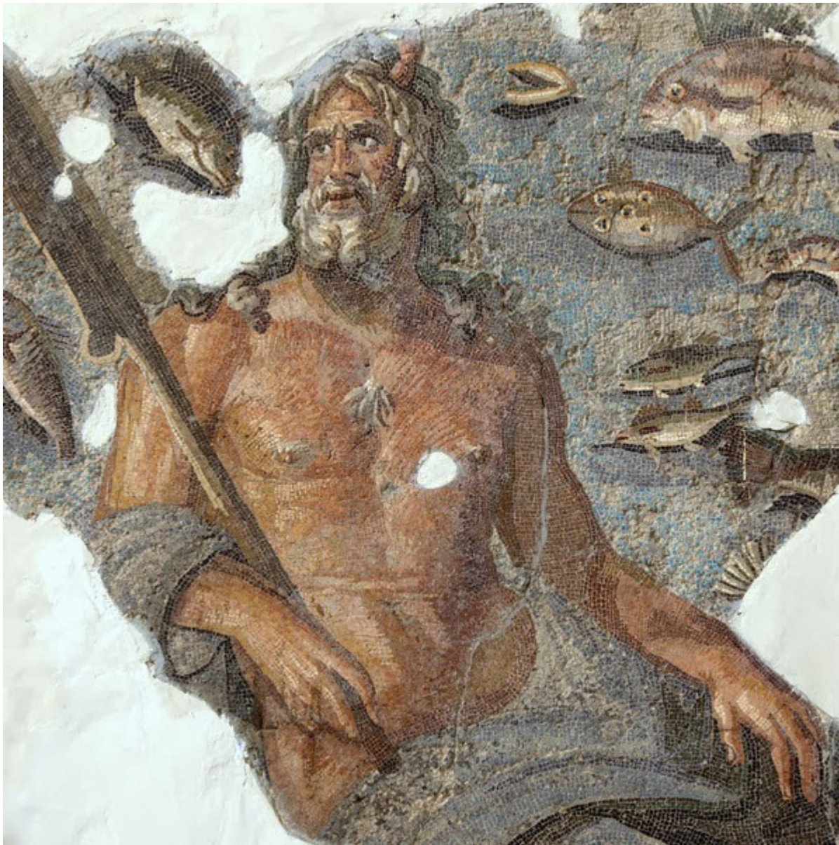
Okeanos – fragment mozaiky (Archeologické muzeum Hatay, Antiochie, Turecko)