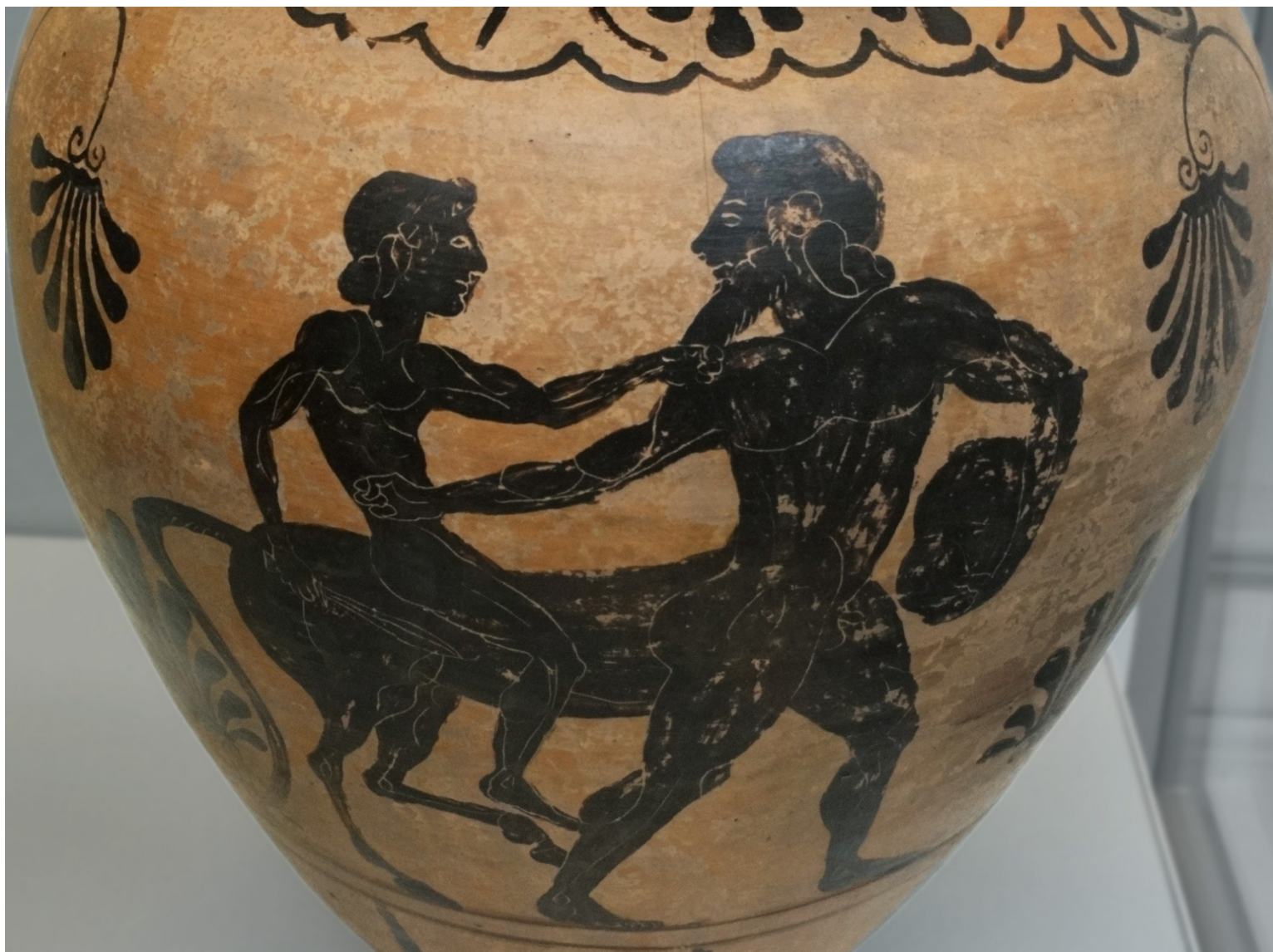
Achilles na kentauru Cheironovi