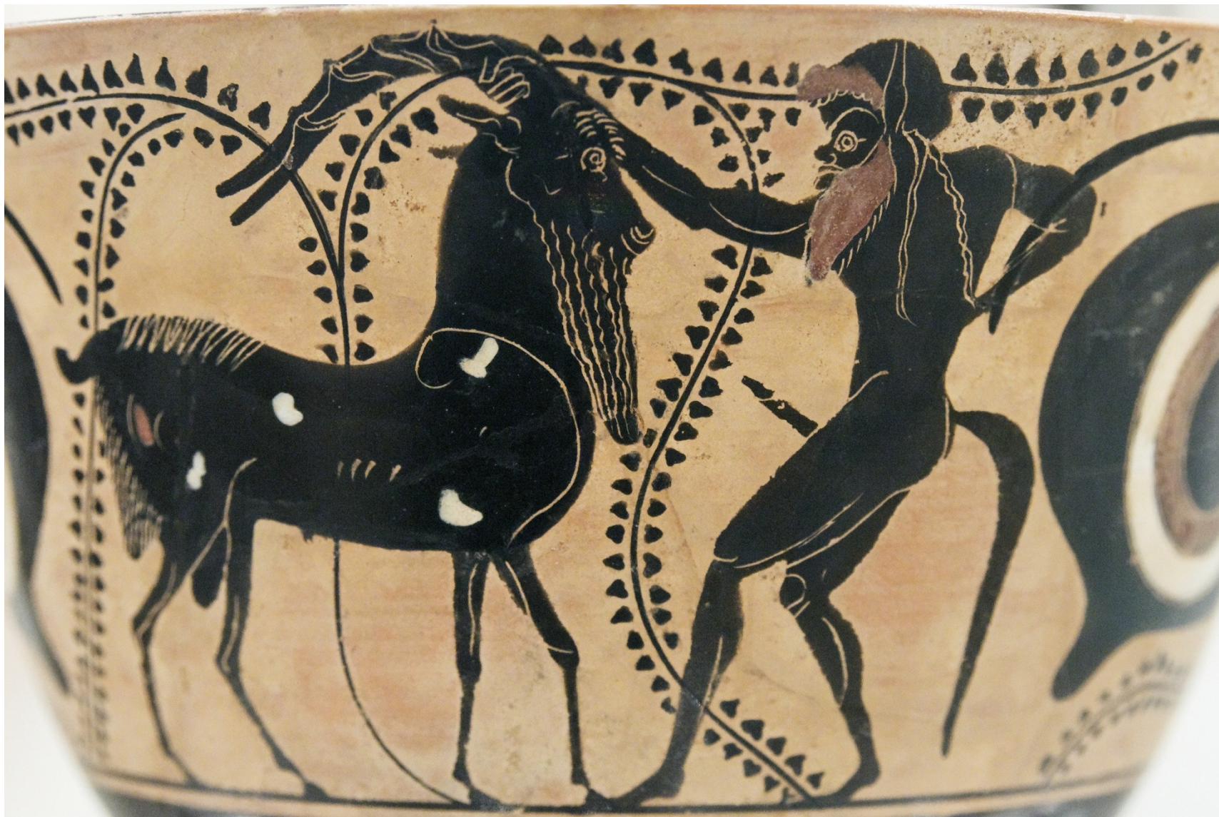
satyr s kozlem