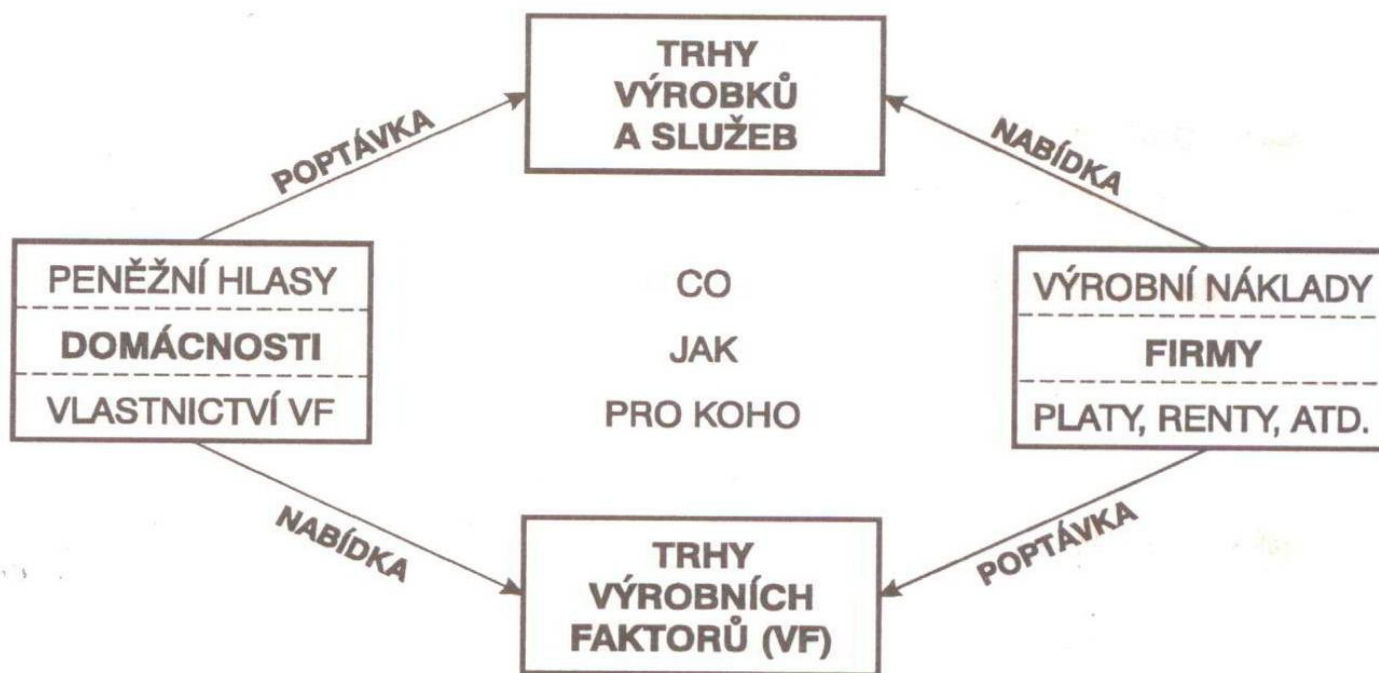
Graf 2-1 Tok výrobních faktorů, výrobků a služeb