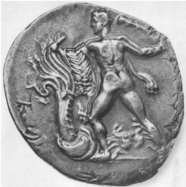
Hydra (dole v souboji s Heraklem na minci)