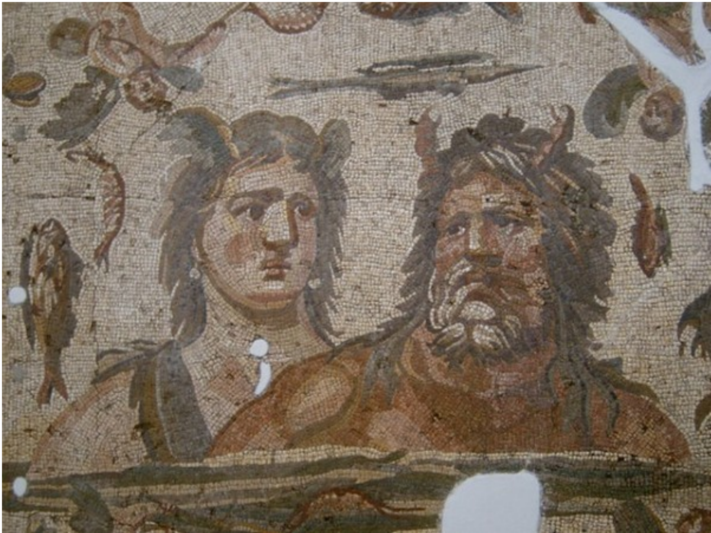
Okeanos a Tethys (Menandrův dům)