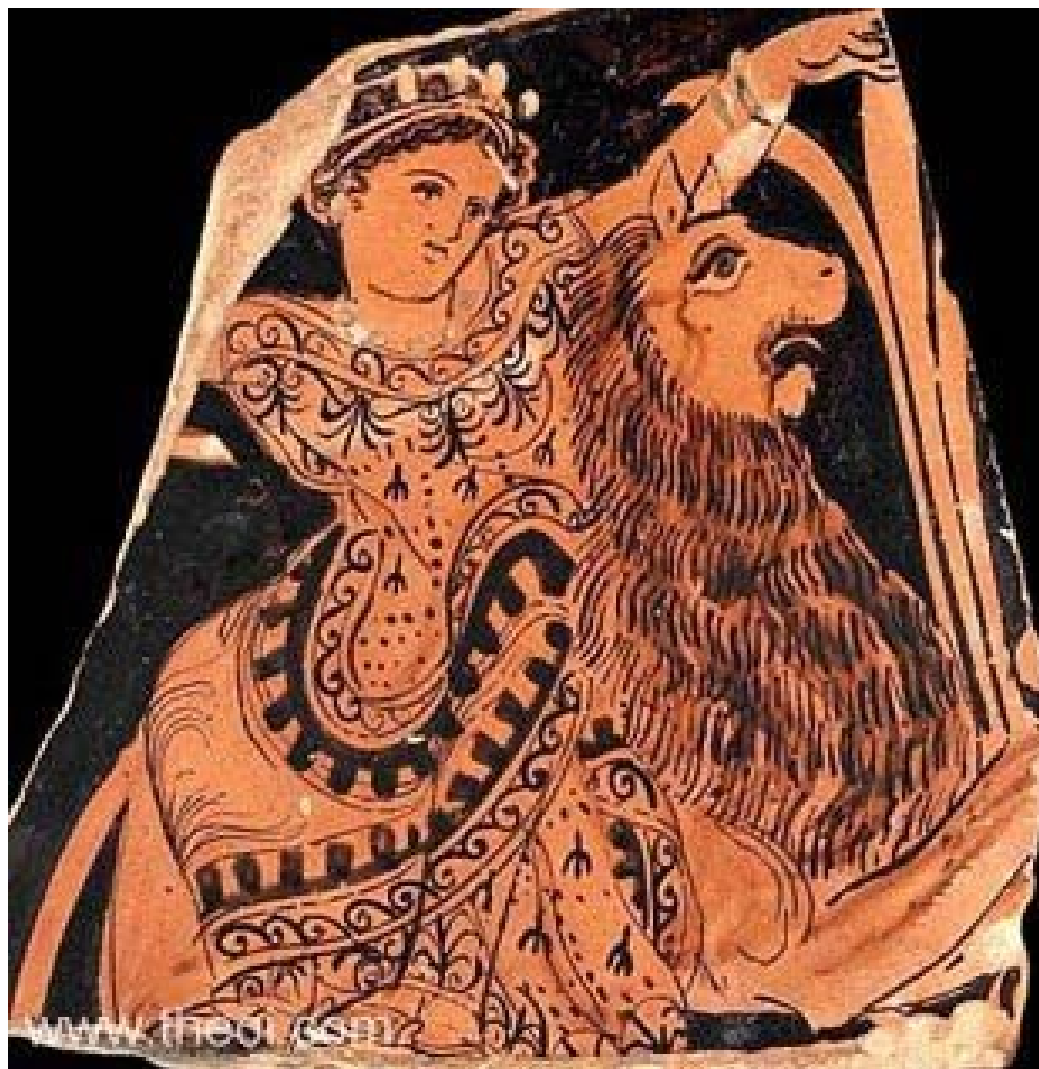
Rhea na lvu (její jízdní zvíře)