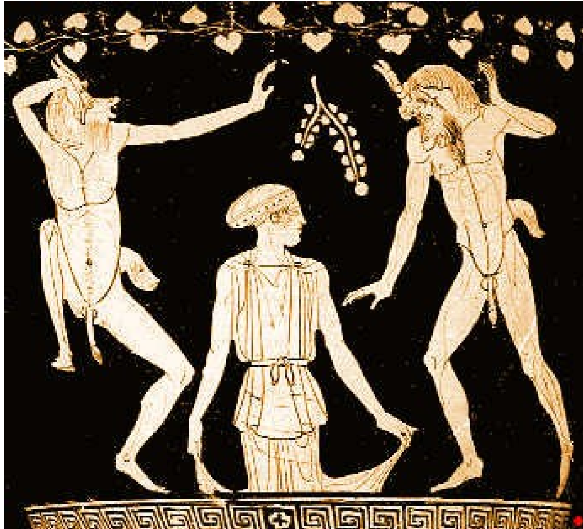
Gáia a dva satyrové