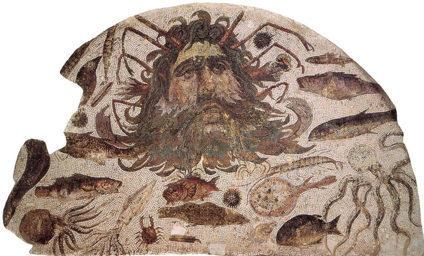
Okeanos (s mořskými tvory, jimž prvotně vládl)