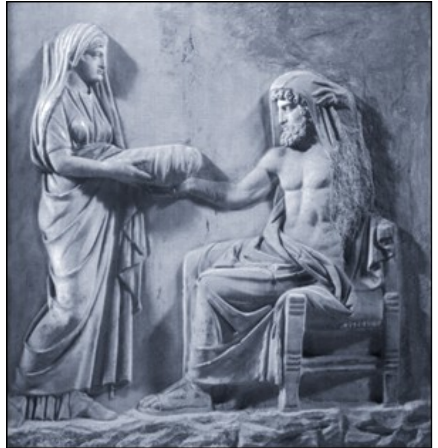
Kronos a Rhea (s kamenem místo Dia)