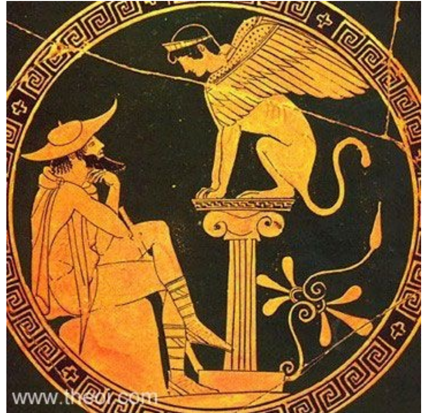
Sfinga a Oidipus