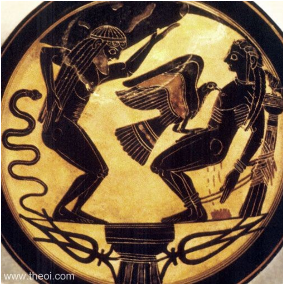
Prométheus trestán Diem