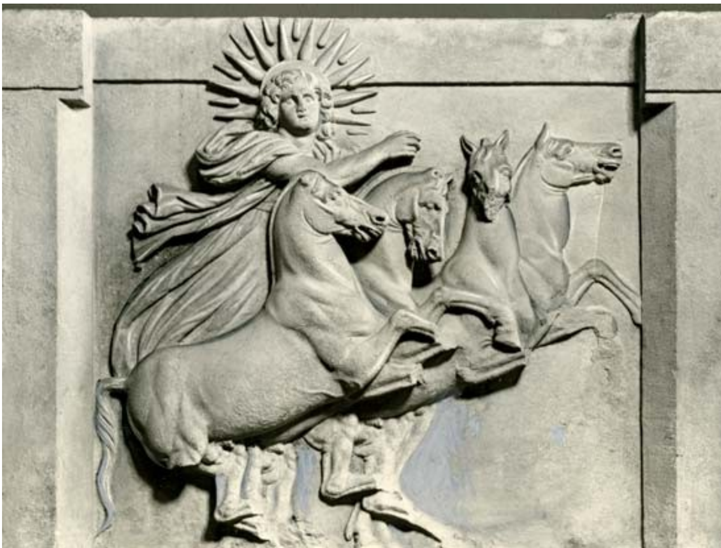
Helios (trojská metopa, dnes Státní muzeum v Berlíně)