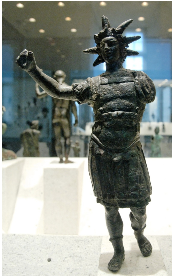
Helios: římská bronzová socha (Louvre)