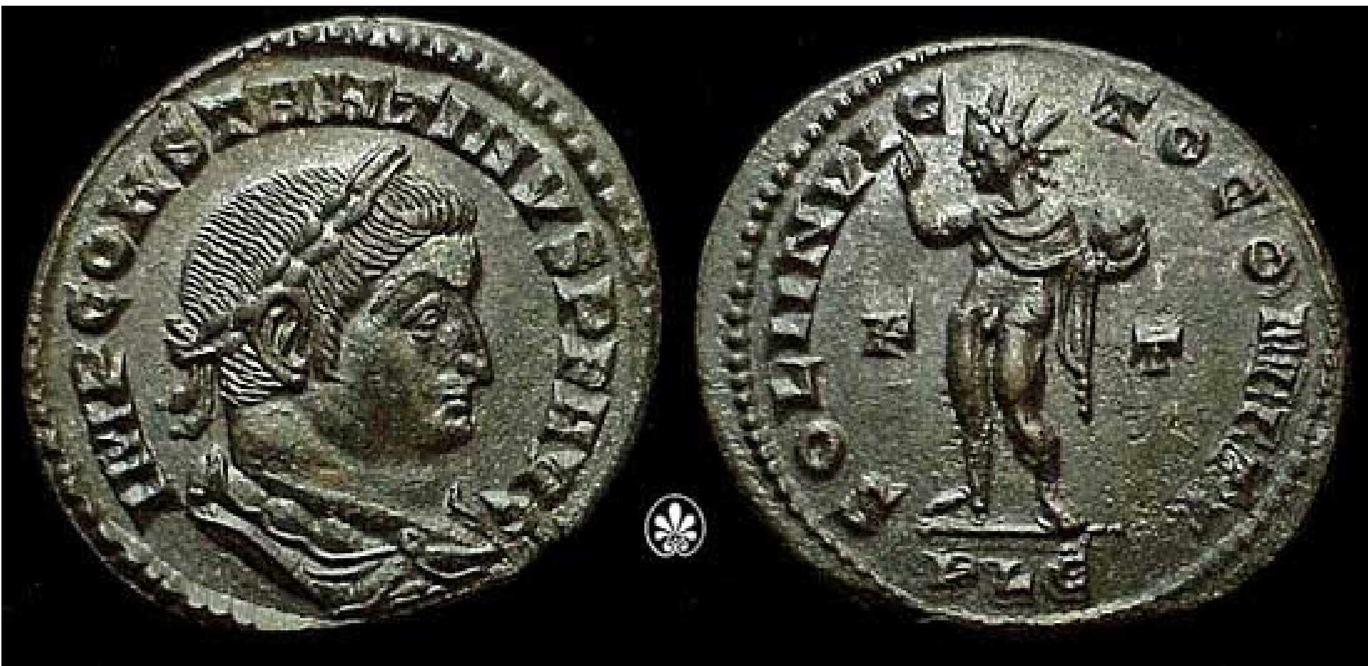
Helios na římské minci