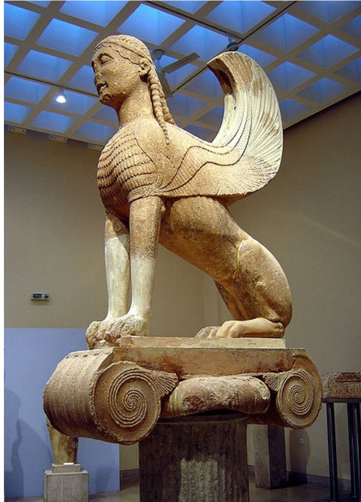
Sfinga z Delf