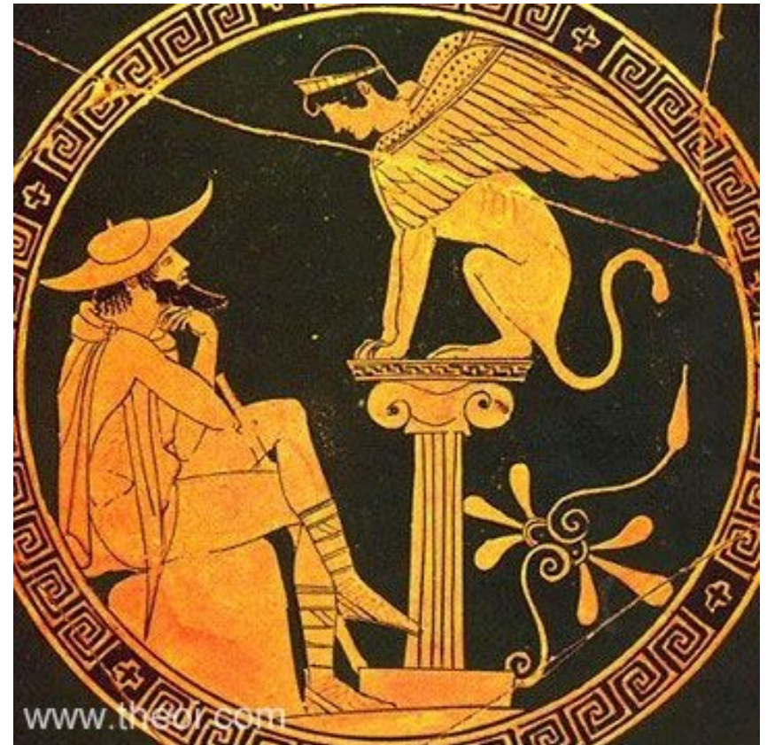
Sfinga a Oidipus