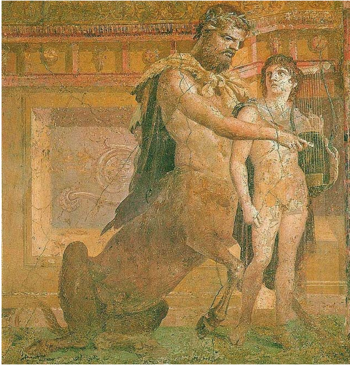
nástěnná malba z Herculanea: Cheiron učící Achilla hrát na lyru