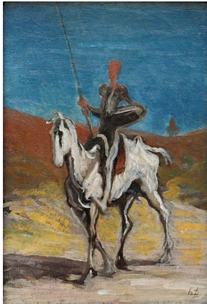
Václav Cejpek / zimní semestr 2016