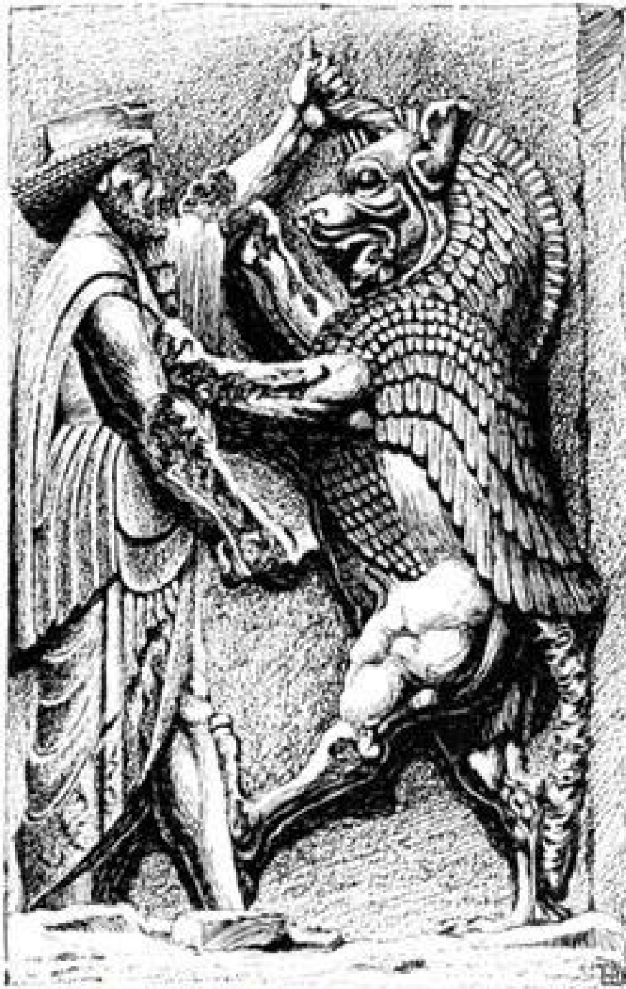
Ahura Mazda soupeří s Ahrimanem