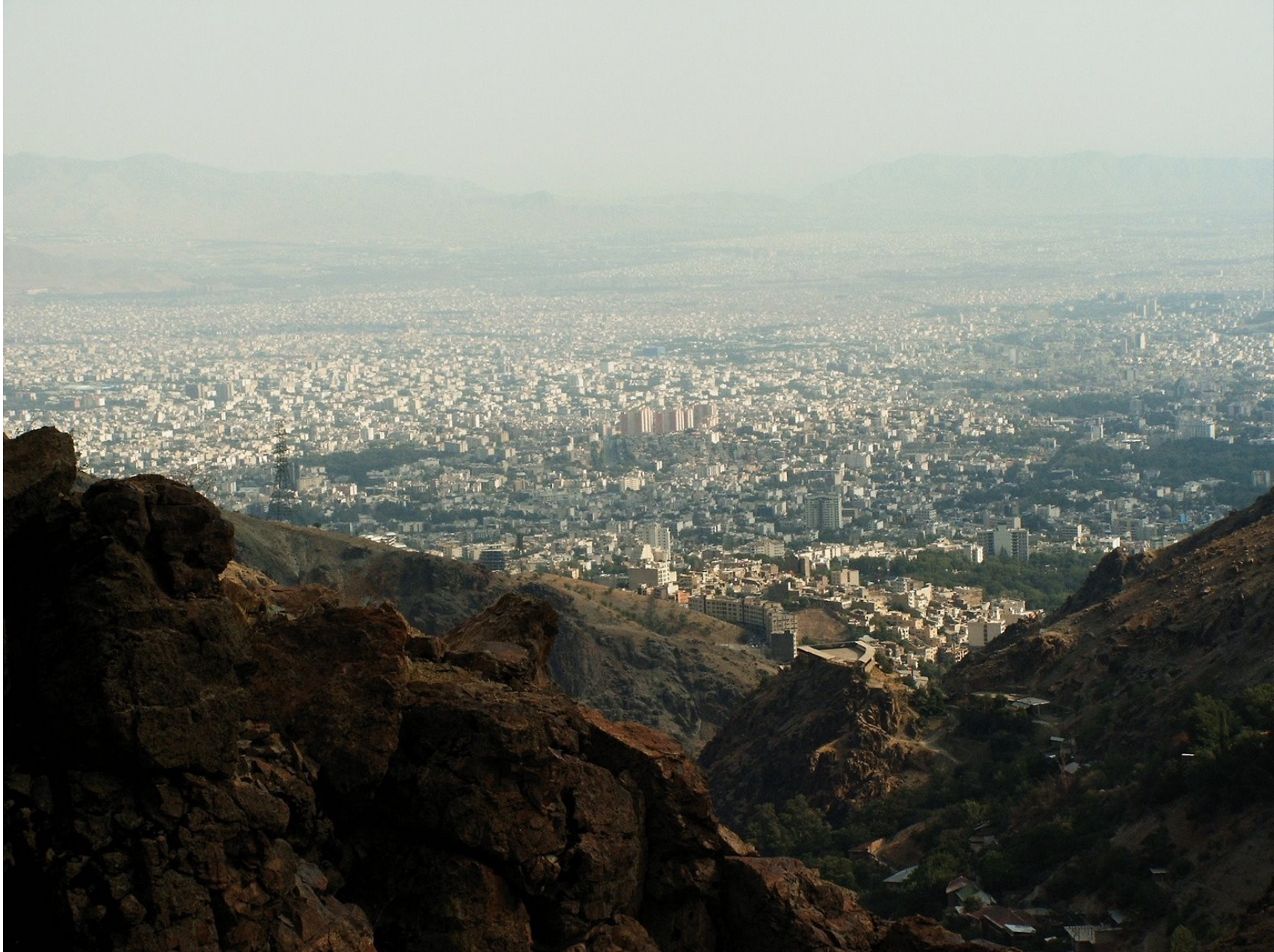
Teherán z Alborzu