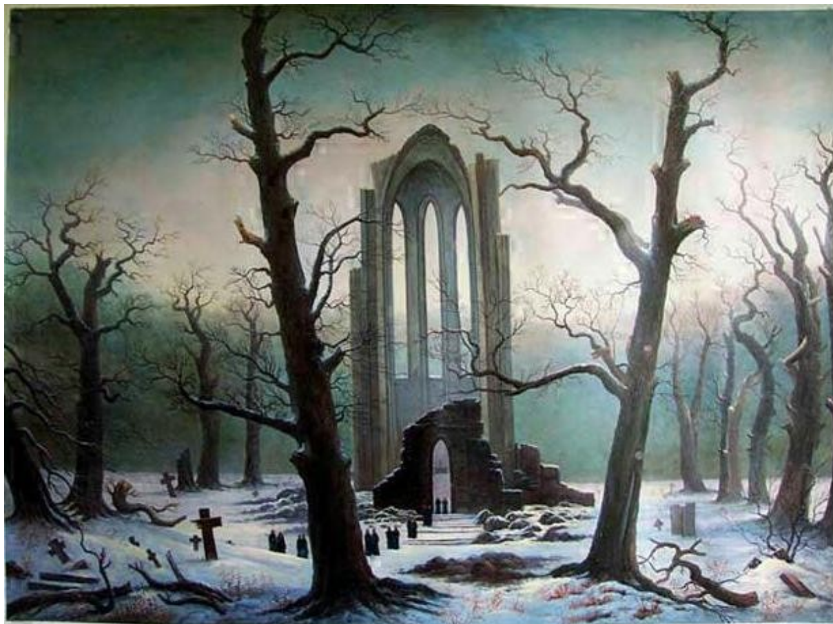
Klášterní hřbitov pod sněhem (1819)

– německý malíř (krajinomalby, romantická zátiší)