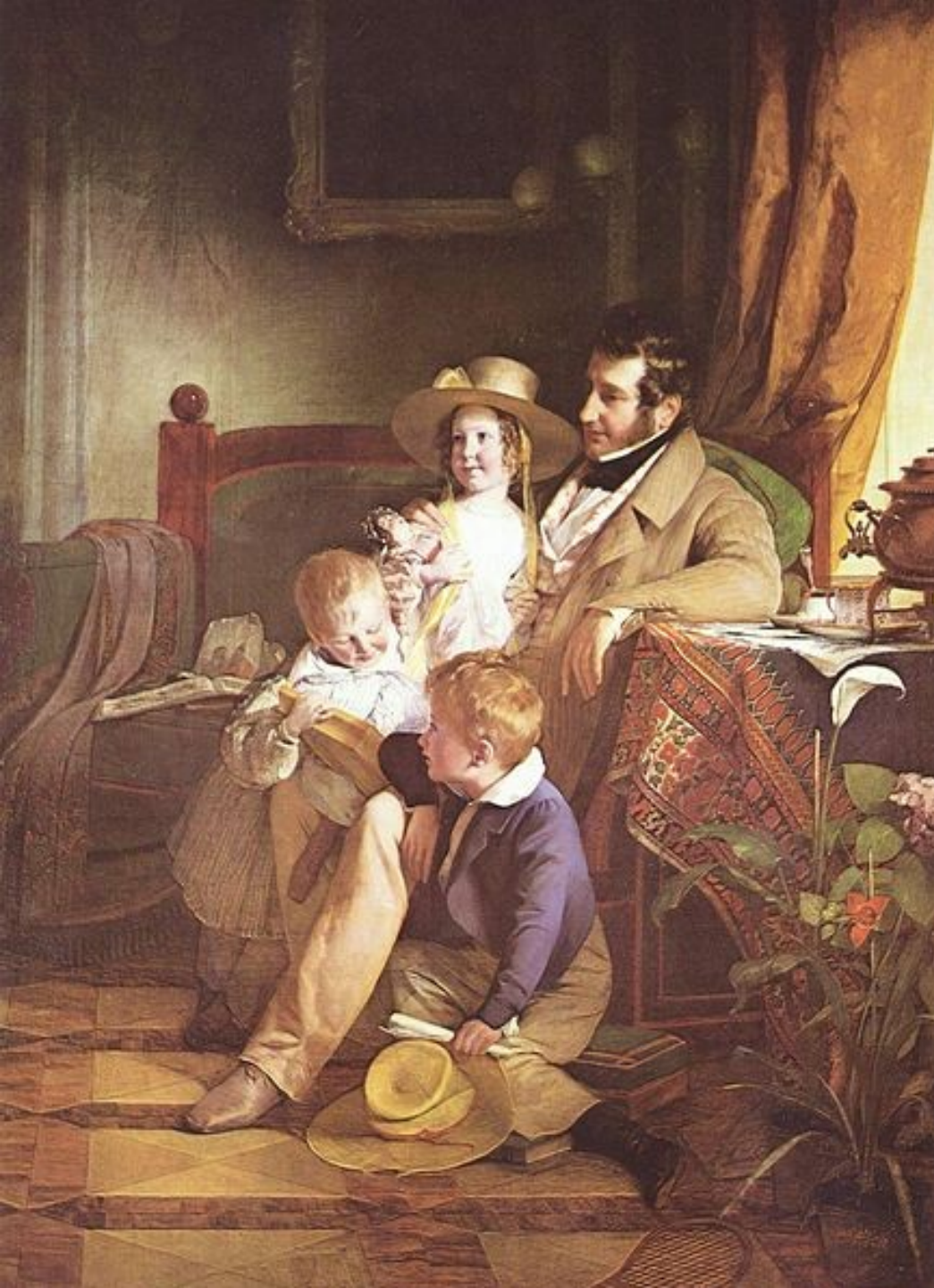
biedermeier: rodinný portrét