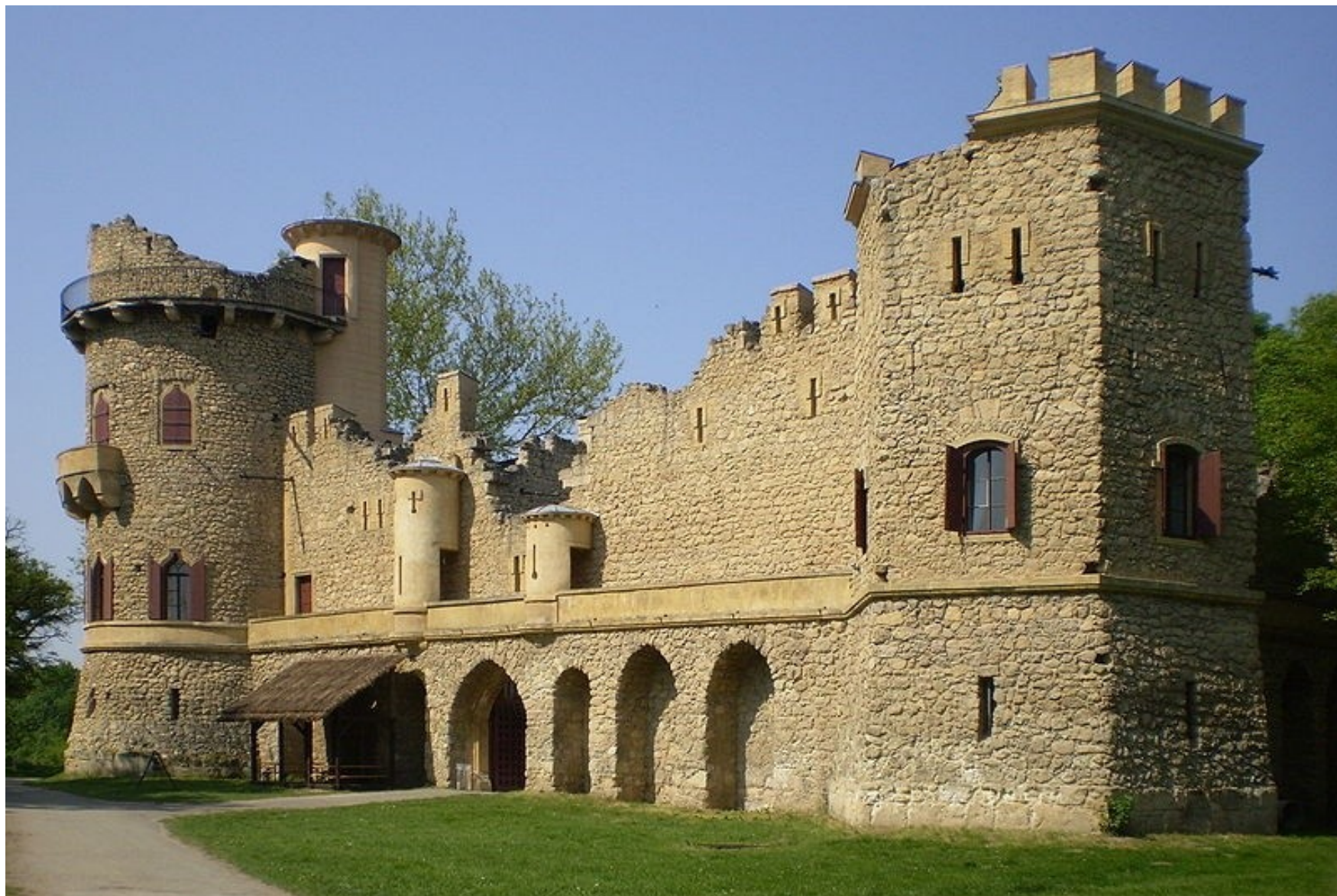
Janohrad u Podivína (lednicko-valtický areál)