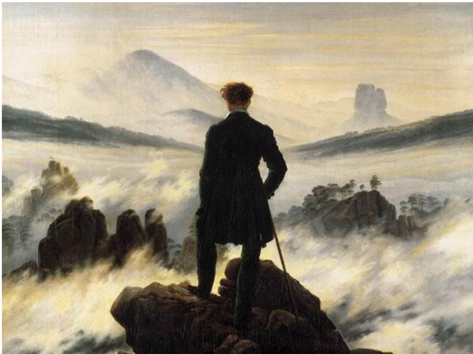
Poutník nad mořem mlhy (1818)