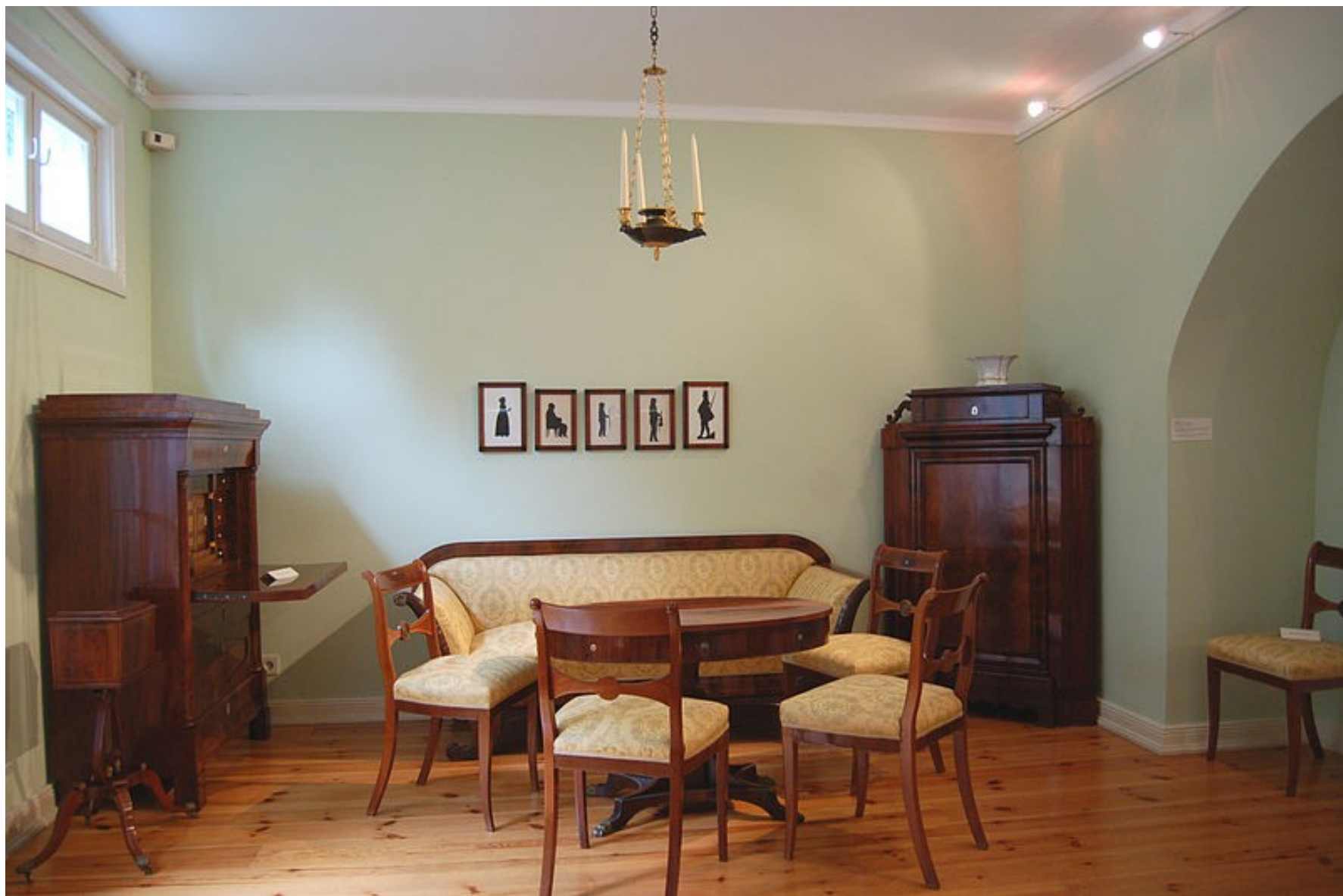
biedermeier: nábytek (1830)