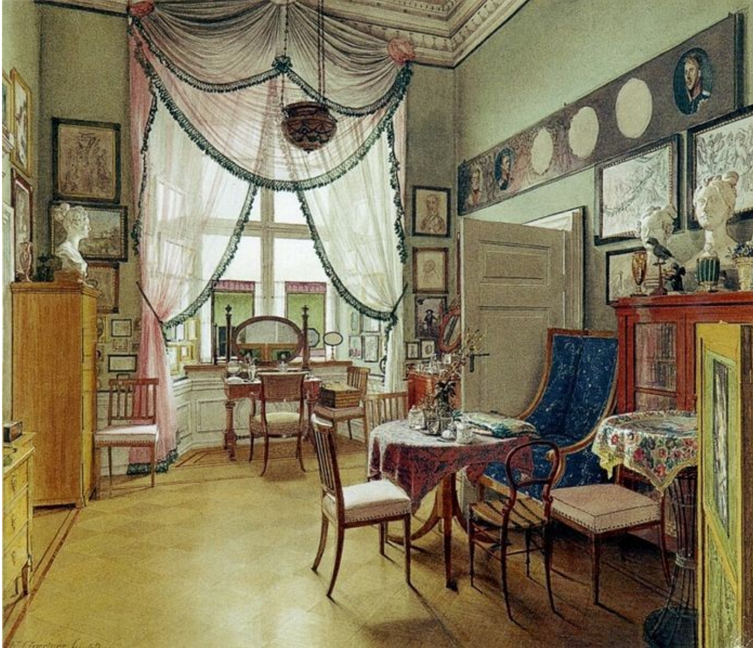
biedermeier: měšťanský pokoj