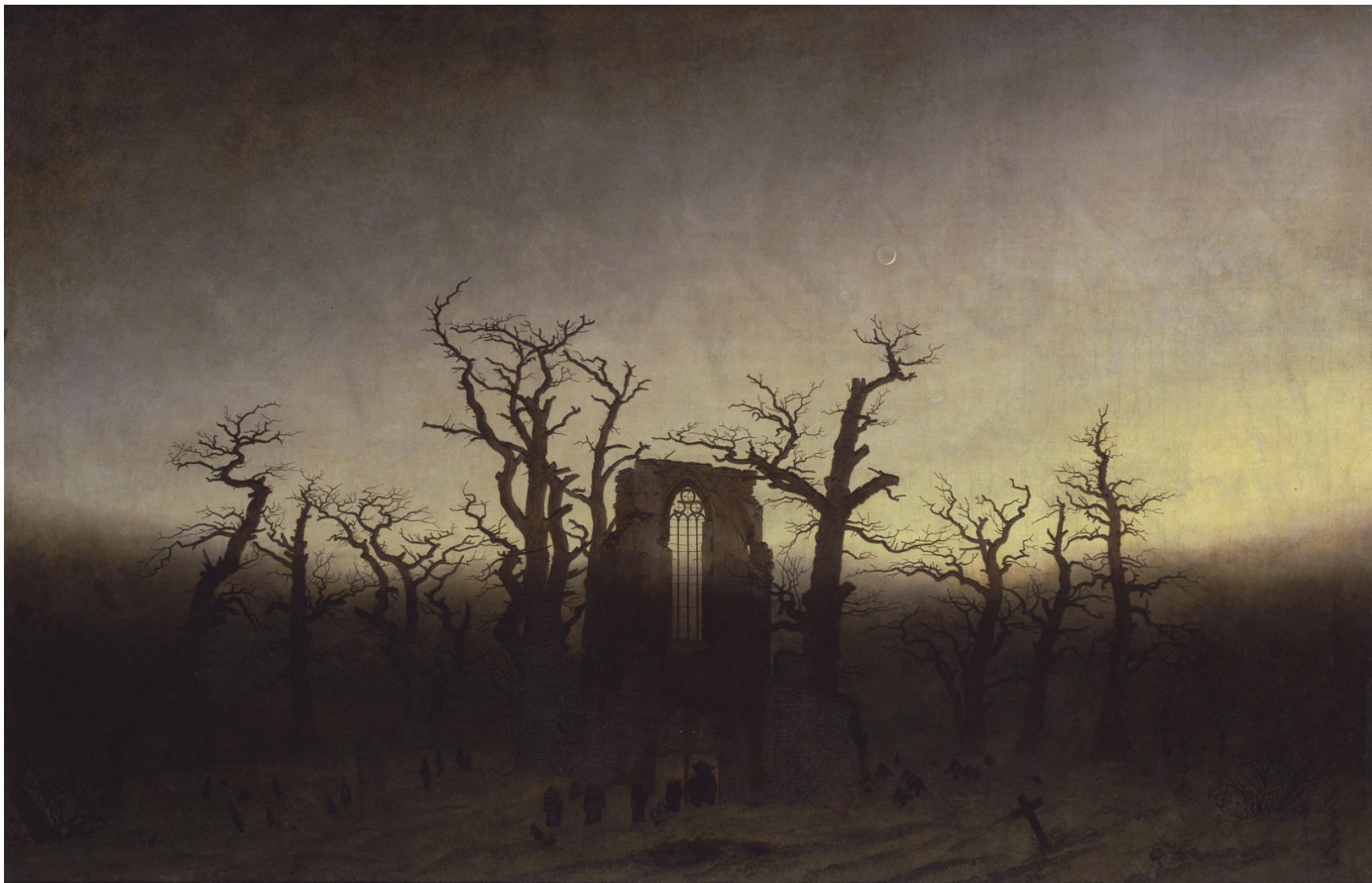
Eichwaldské opatství (1809)