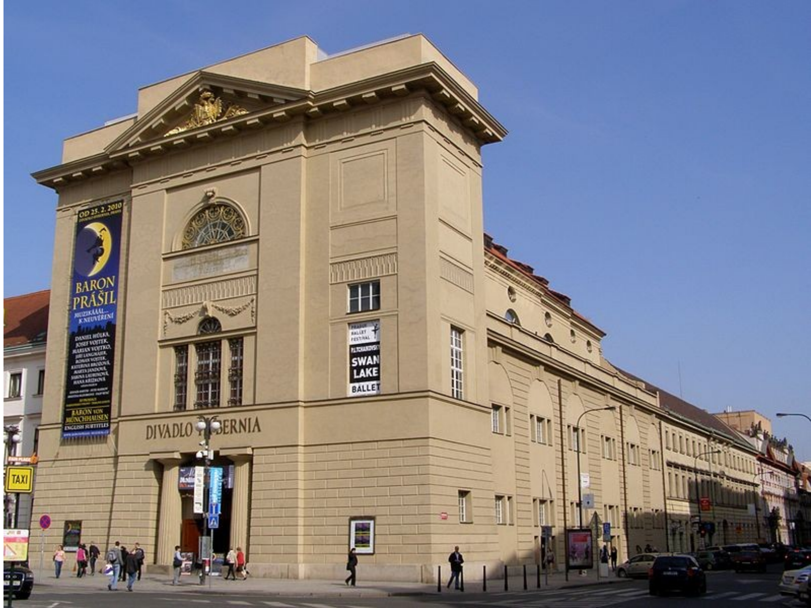
empír: Dům u Hybernů (Praha)