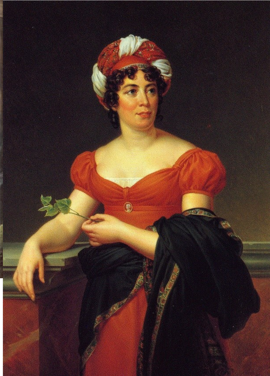
Madame de Staël