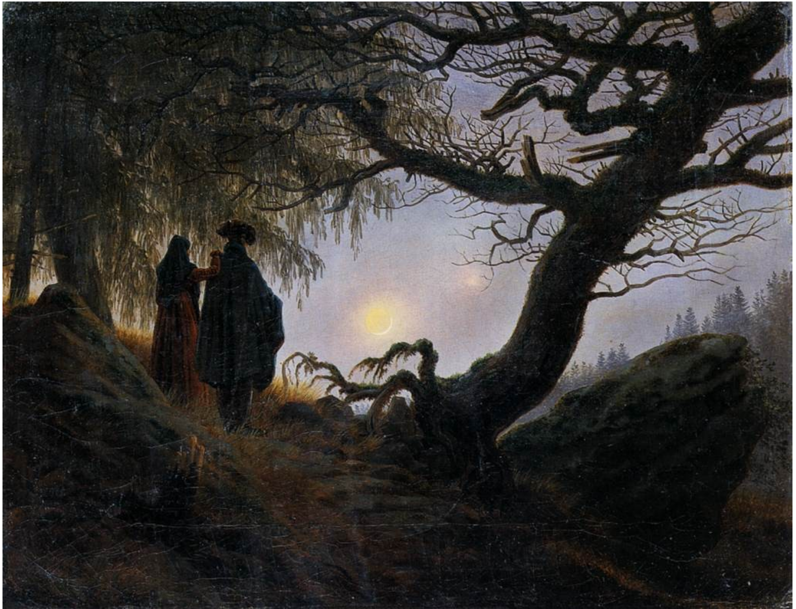
Muž a žena rozjímající v záři měsíce (1824)