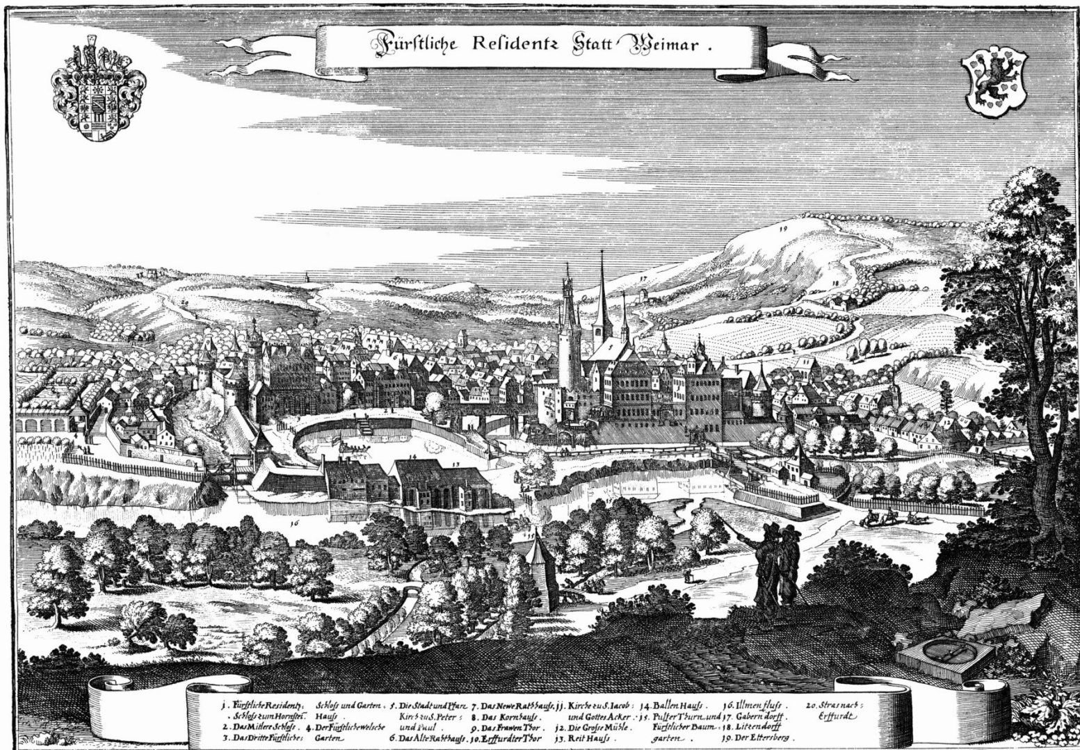
Výmar (historická rytina)