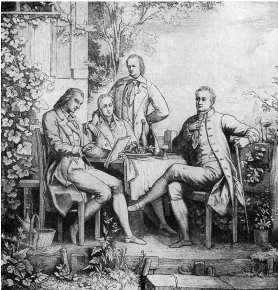
Schiller (vlevo) a Goethe (vpravo) v Jeně