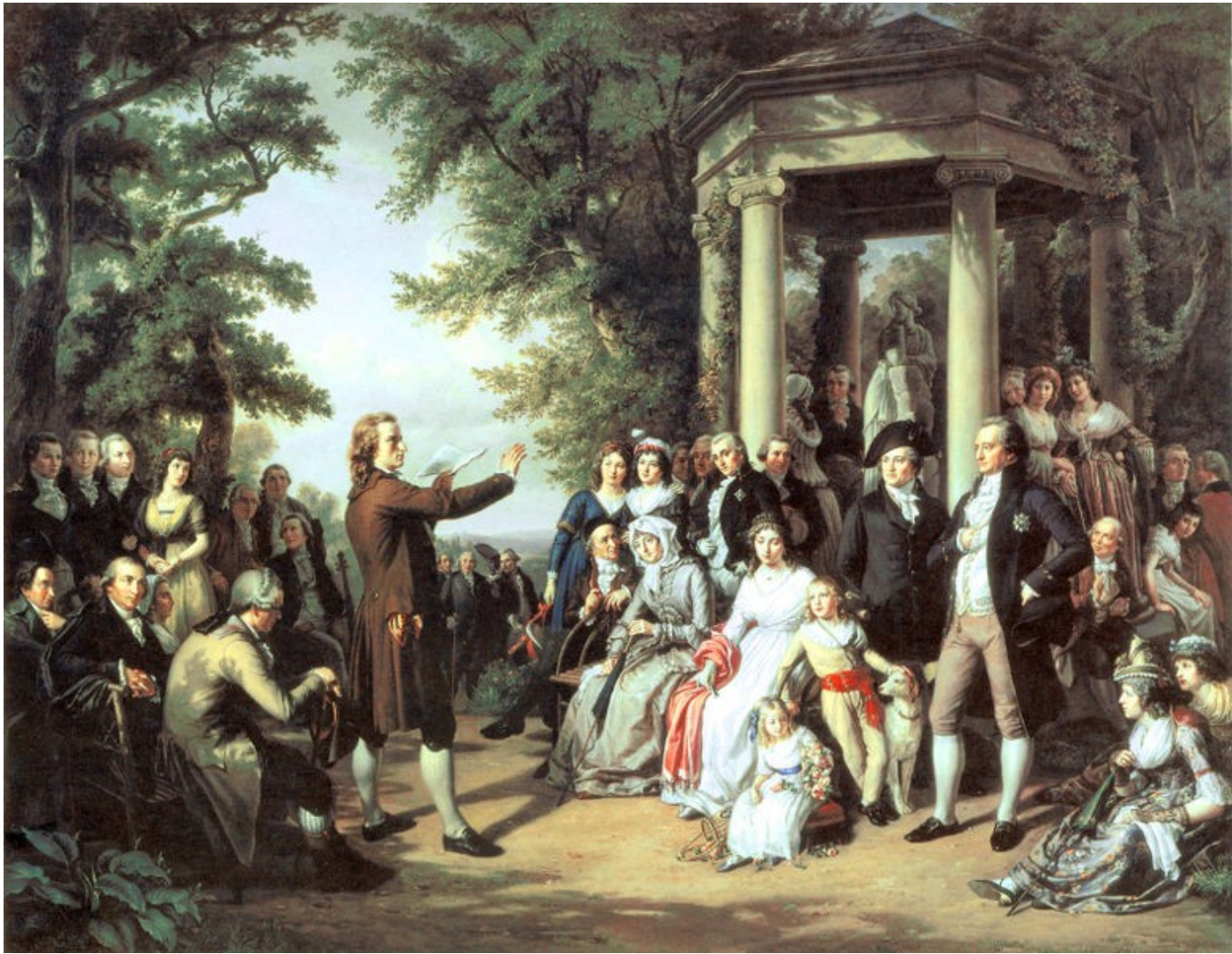
Schiller předčítá ve Výmaru (vlevo sedí Goethe)