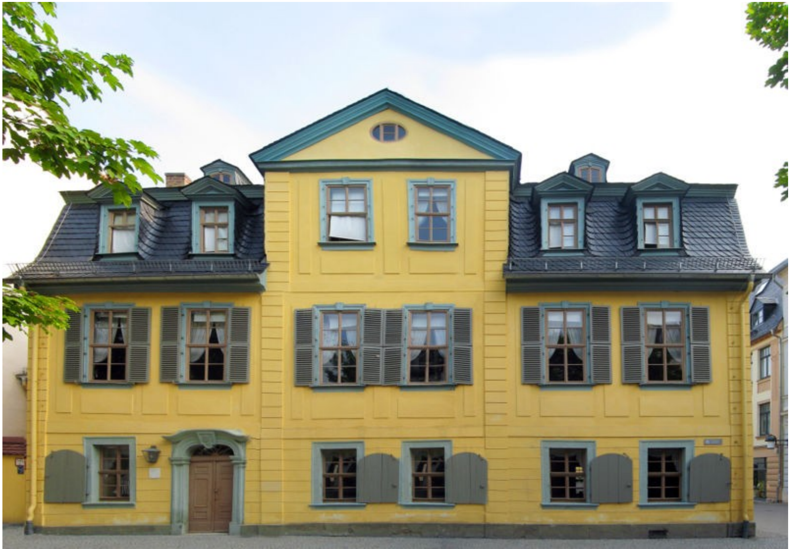
Výmar (dům, kde žil Schiller)