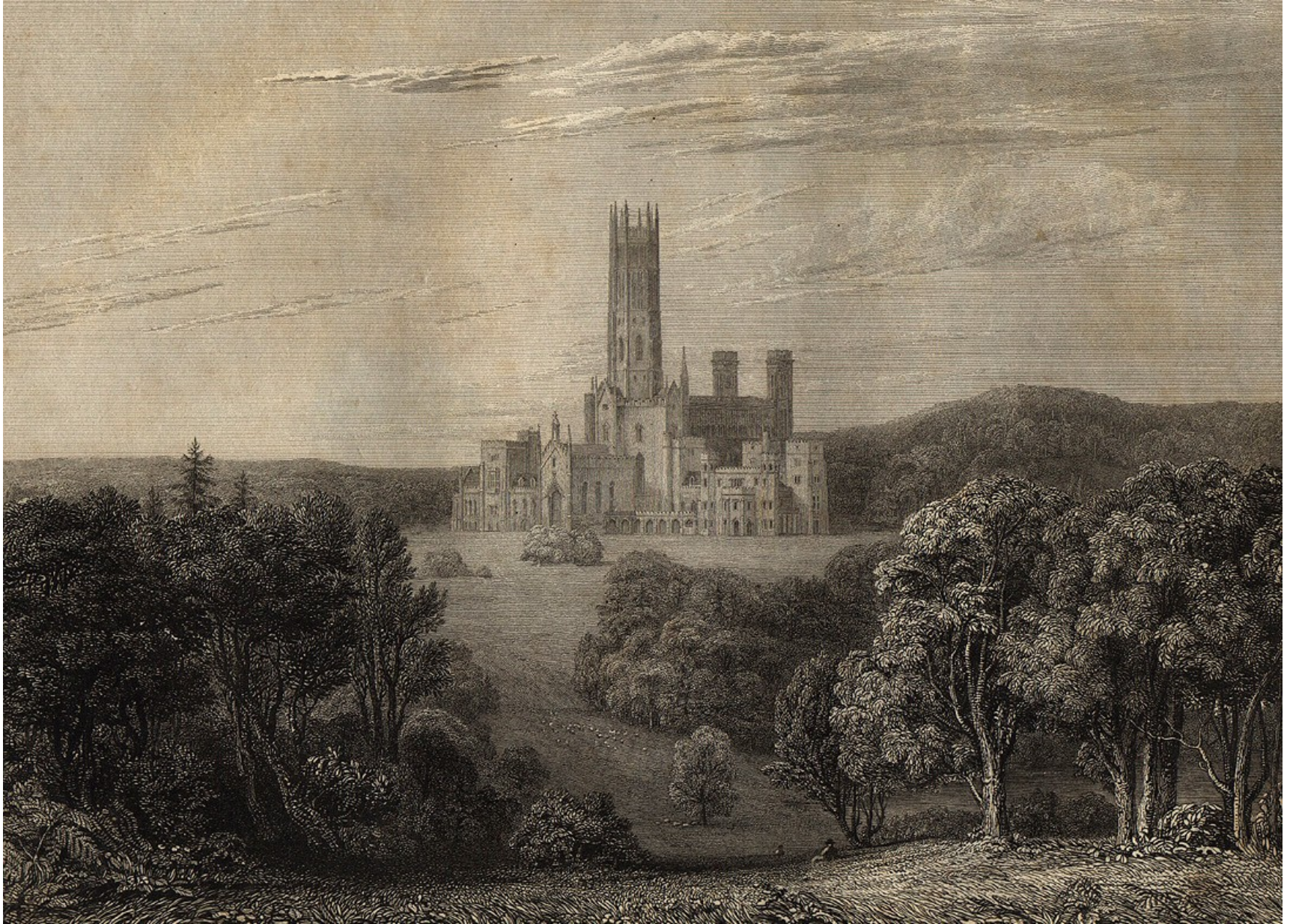
preromantická scenérie (Fonthill Abbey od Johna Ruttera, 1823)