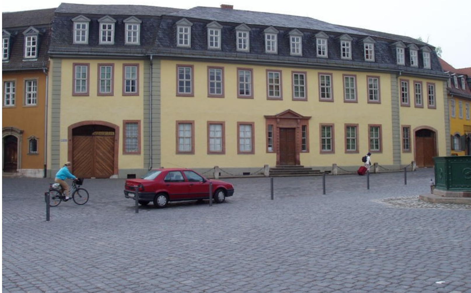
Výmar (dům, kde žil Goethe)