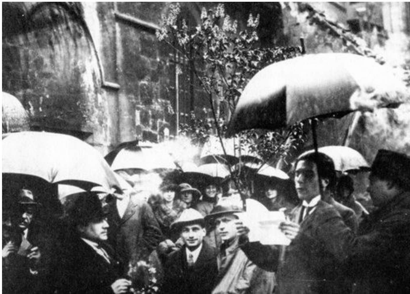
Tzara v Paříži