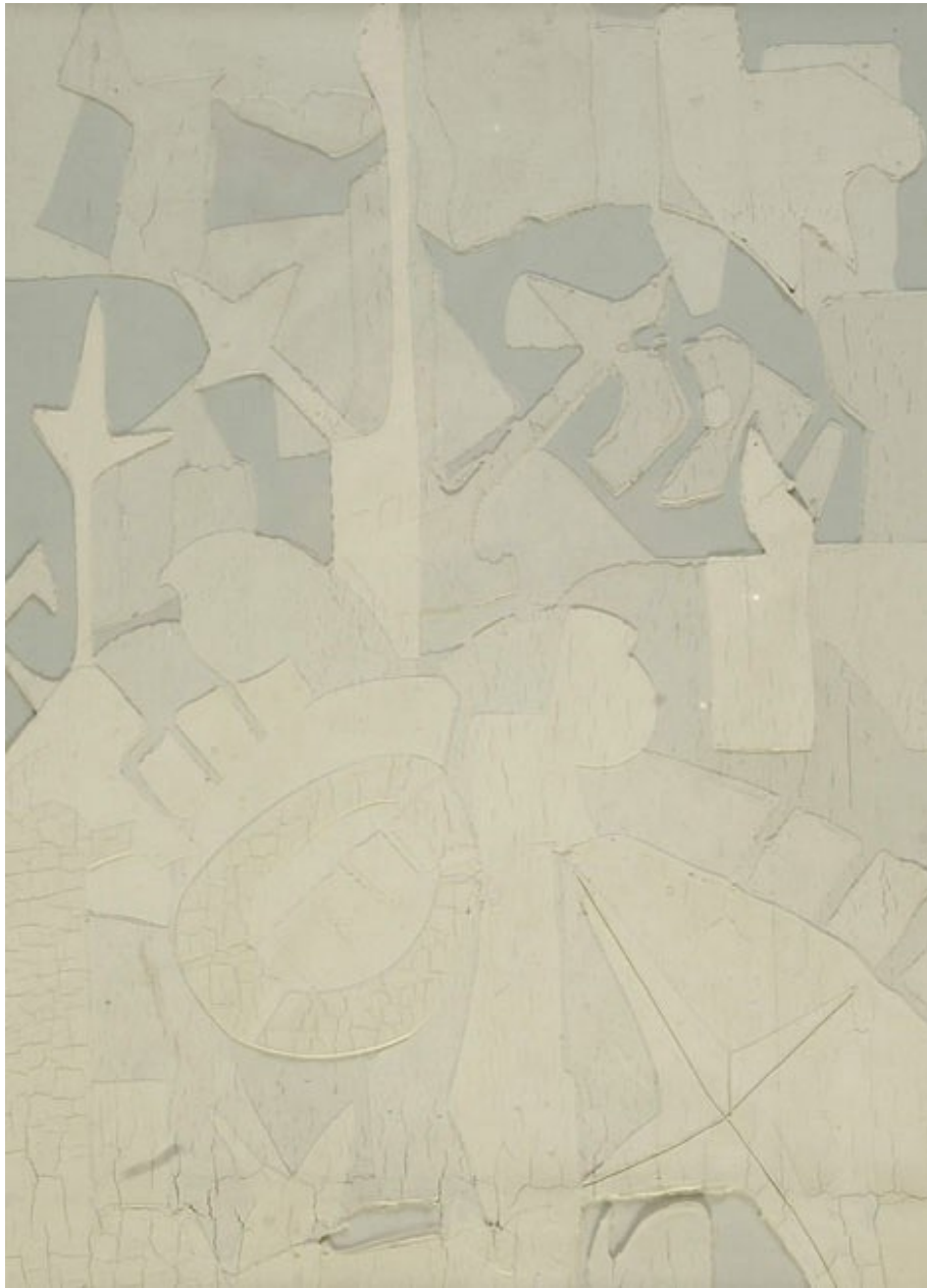
Marcel Janco: Bílá v bílé