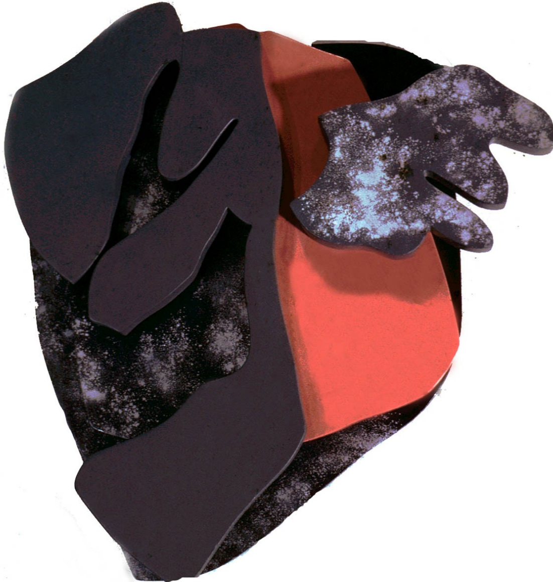
Hans Arp: portrét Tristana Tzary