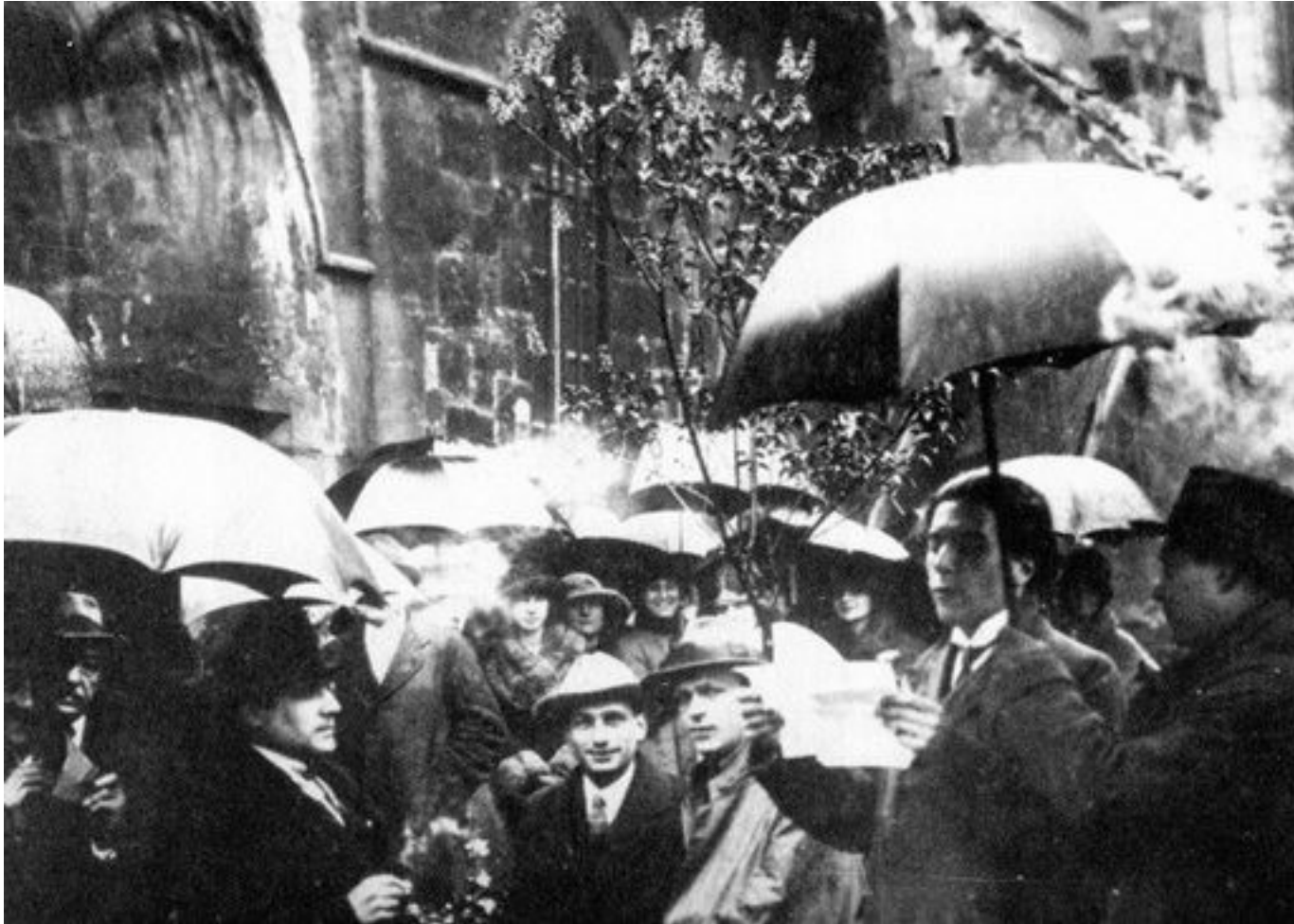
Tzara v Paříži