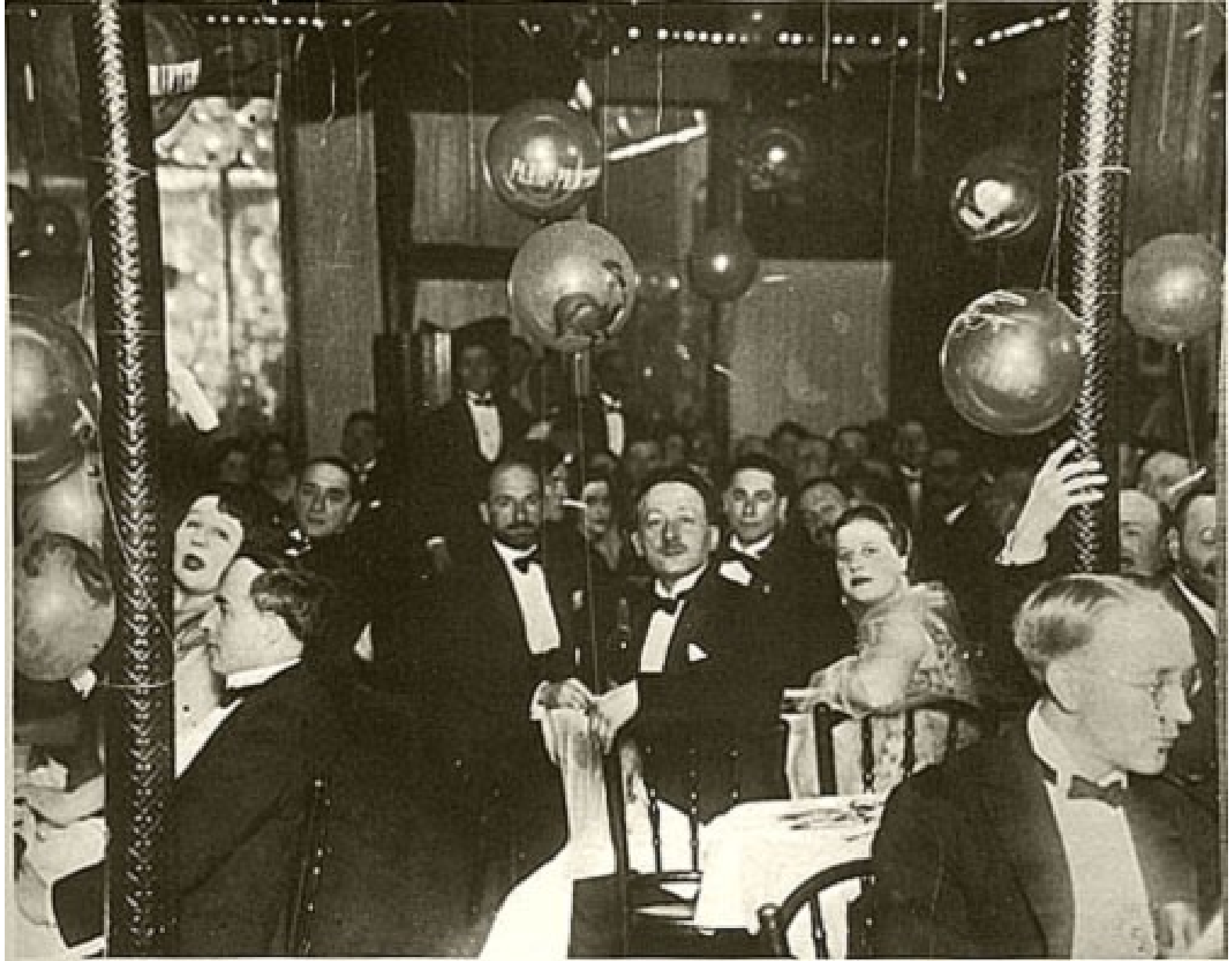
kabaret Vůl na střeše (1921)