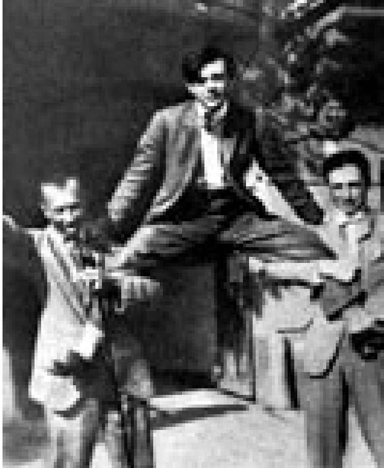
Arp, Tzara, Richter (Kabaret Voltaire, 1916)