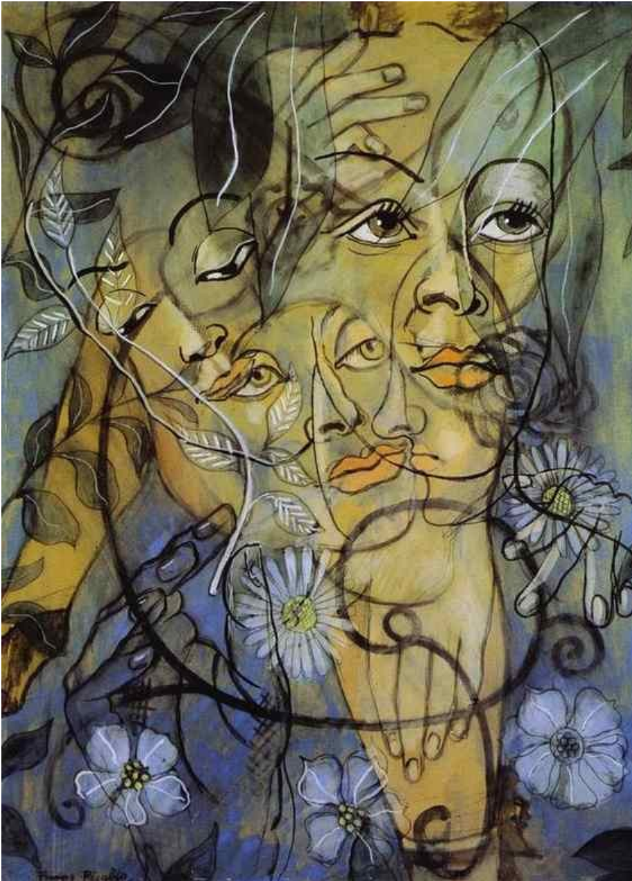
Francis Picabia: Héra