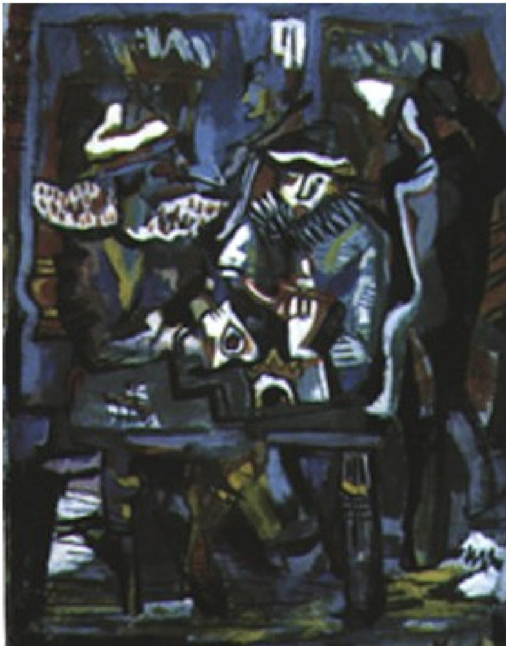
Marcel Janco: Café - koncert