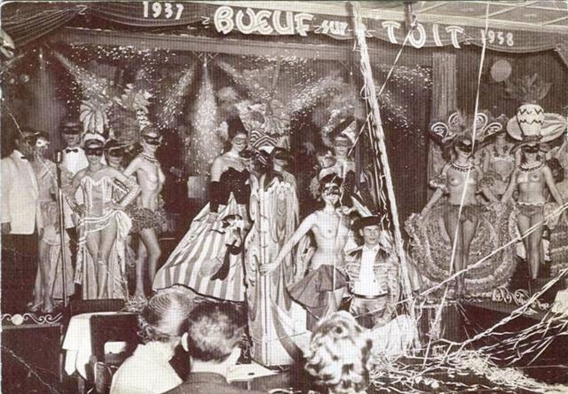
kabaret Vůl na střeše (1921)