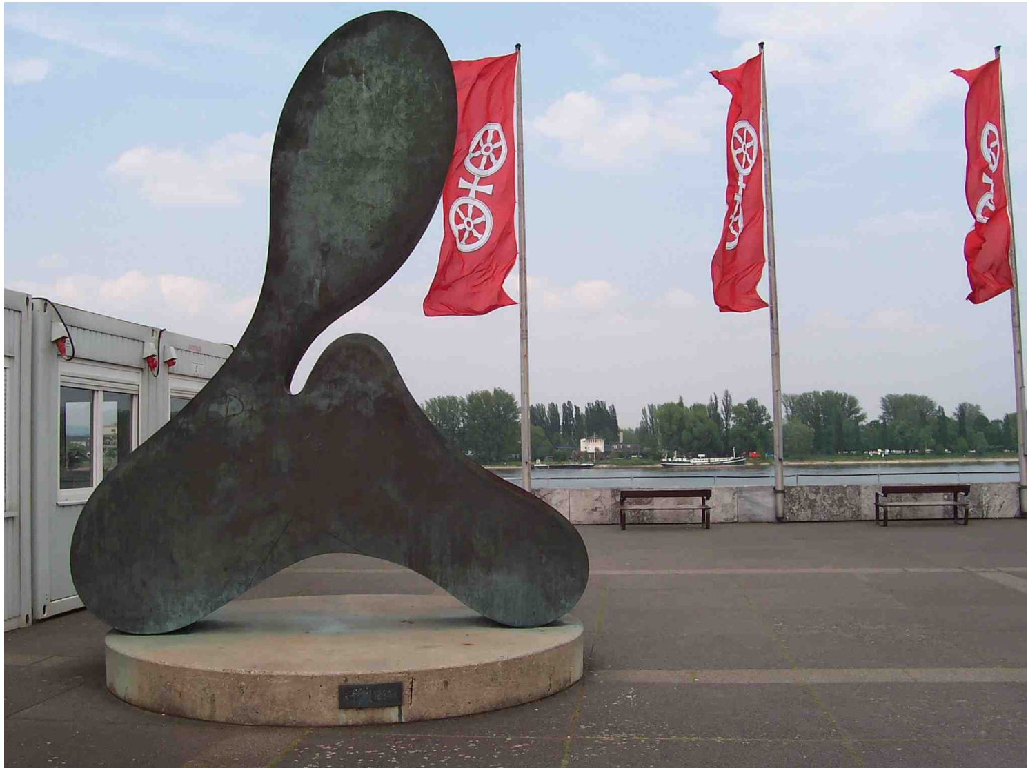
Hans Arp (skulptura)