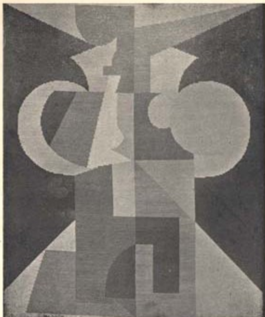
H. ARP: BRODERIE

revue DADA: 1. číslo (červenec 1917) výtvarné dílo Výšivka (Hans Arp)