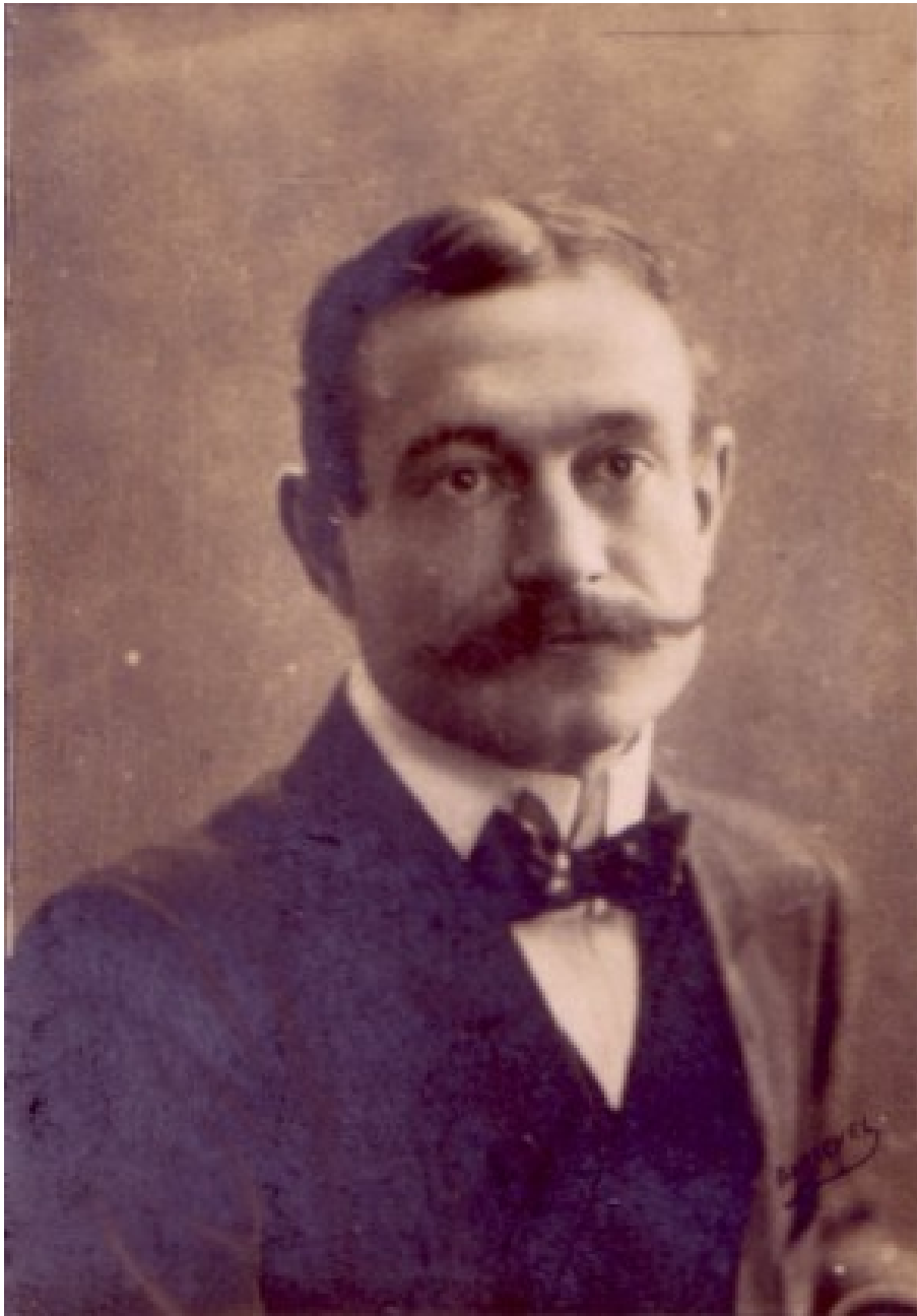
Firmin Gémier (první představitel Otce Ubu)