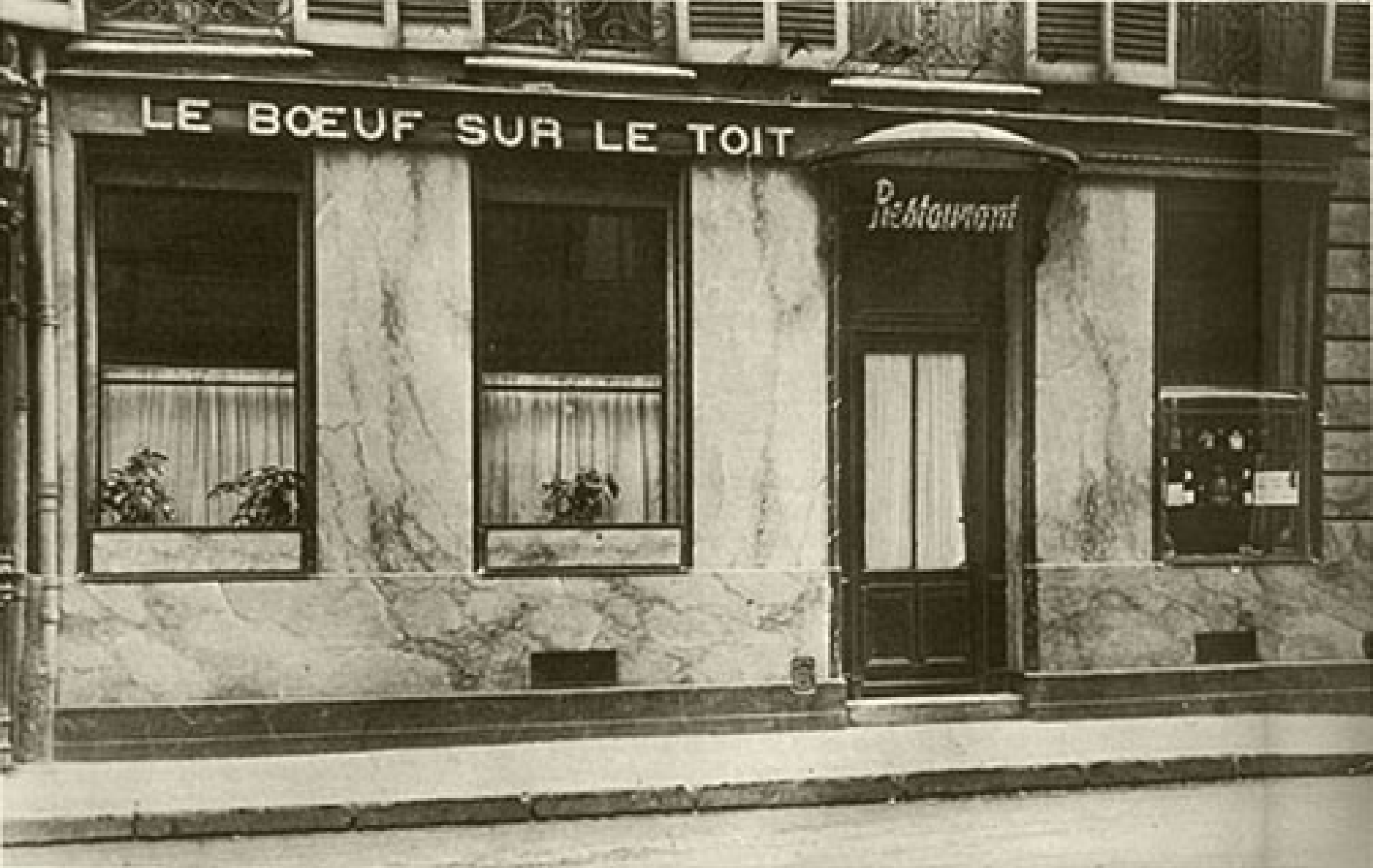
kabaret Vůl na střeše (1921)