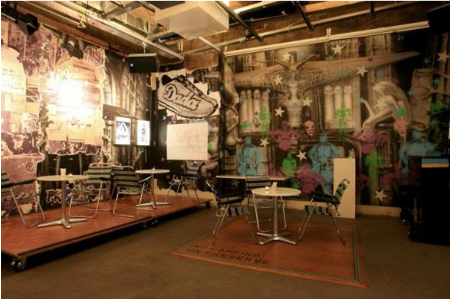
Cabaret Voltaire 2008