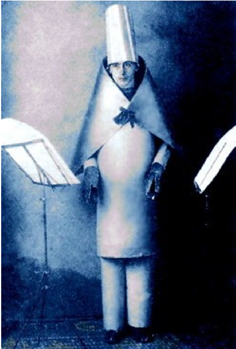
Hugo Ball (Kabaret Voltaire, 1916)