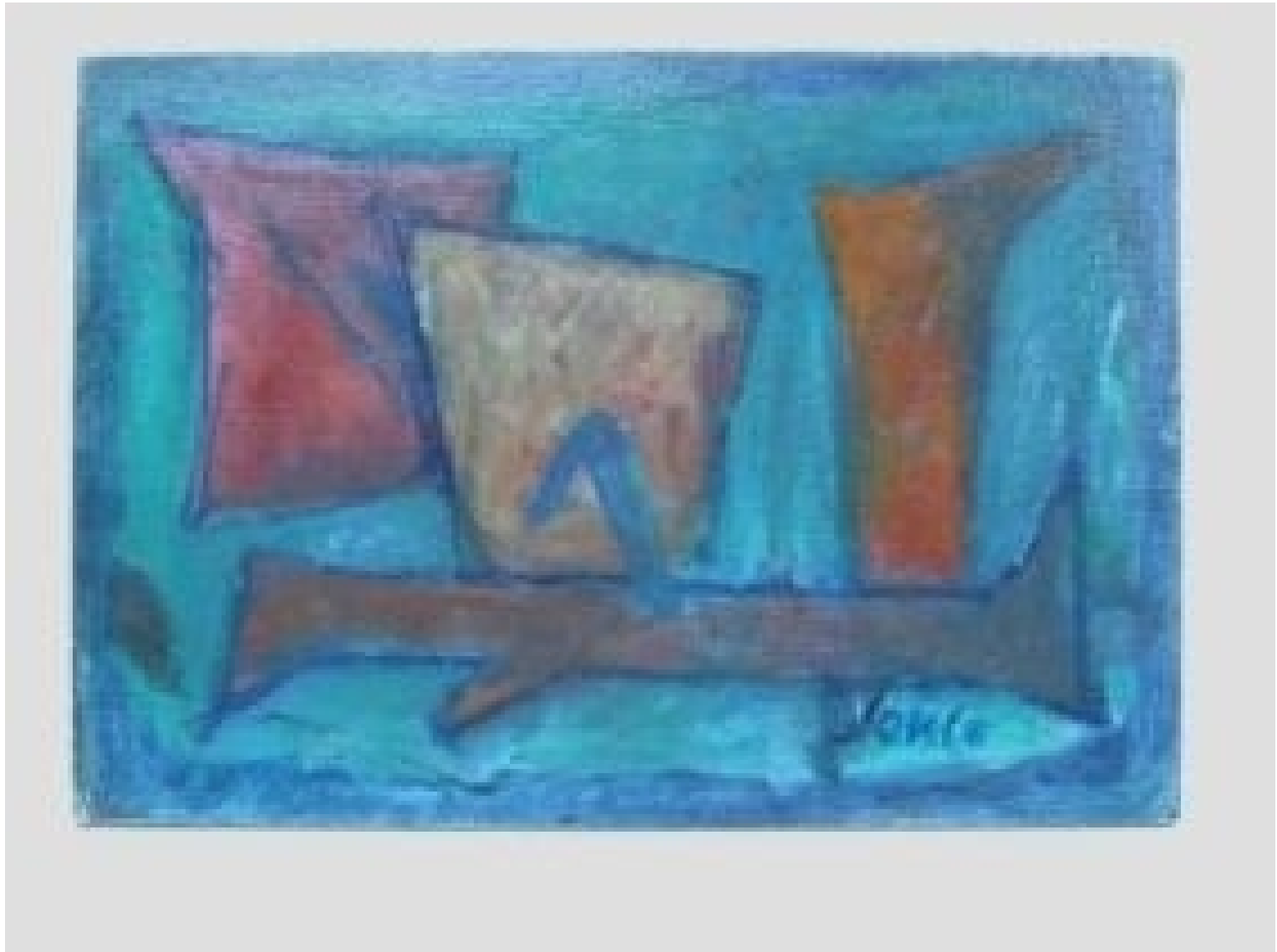
Marcel Janco: Kompozice dada