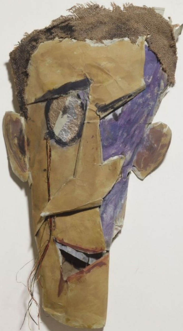
Marcel Janco: portrét Tristana Tzary