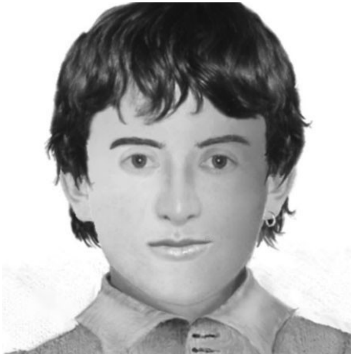
WS ve 14 letech (hypotetická podoba)