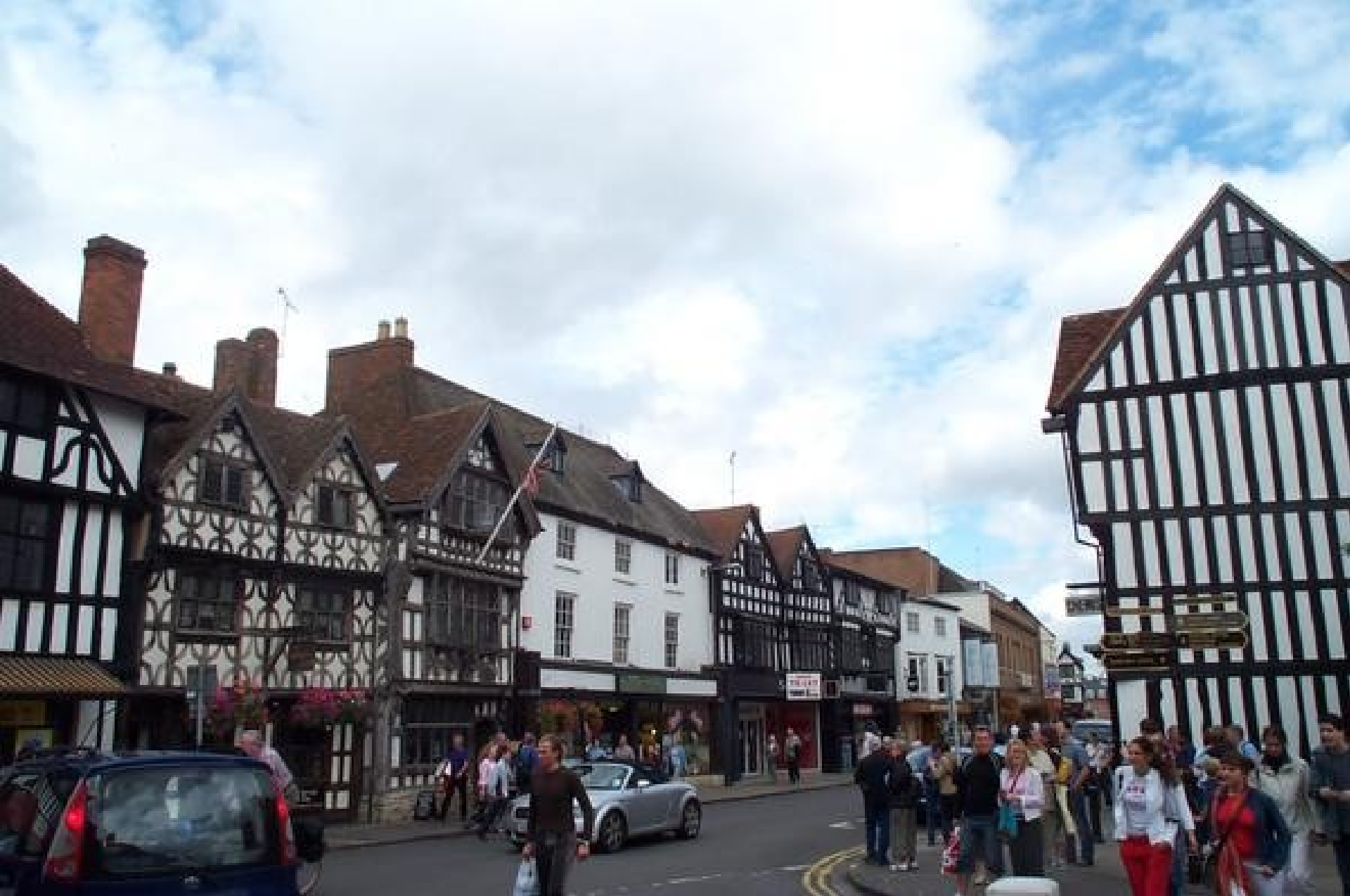
Stratford nad Avonou dnes