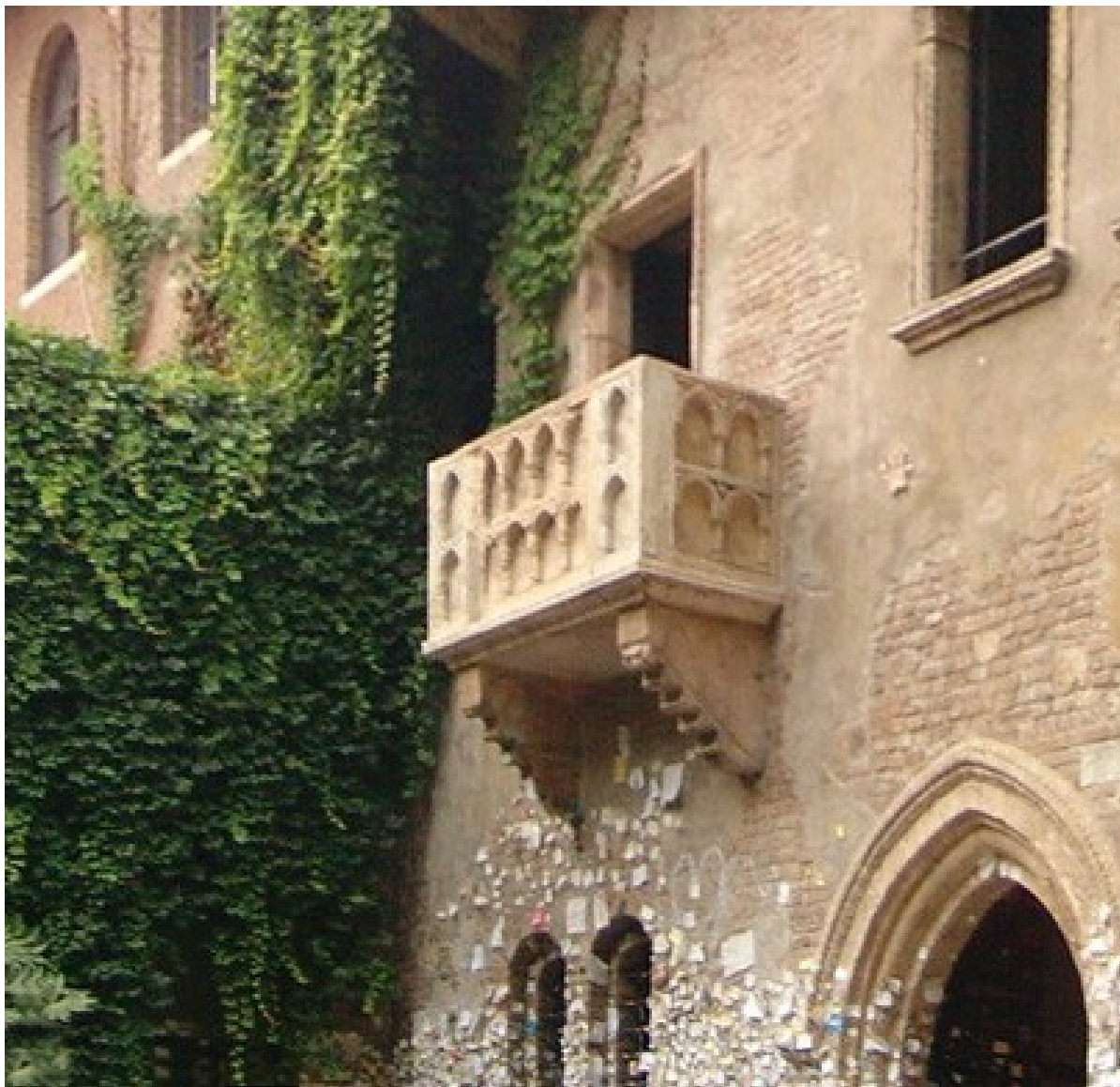
Juliin balkon ve Veroně