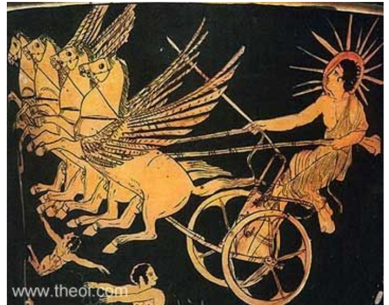
Hélios se spřežením