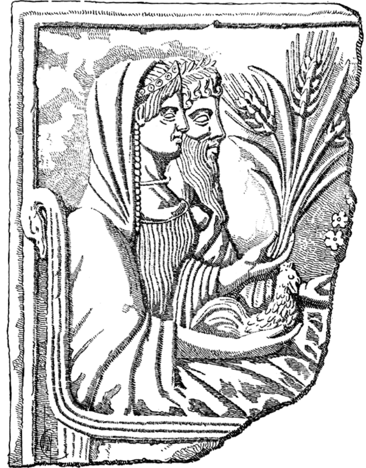
Hádés a Persefona