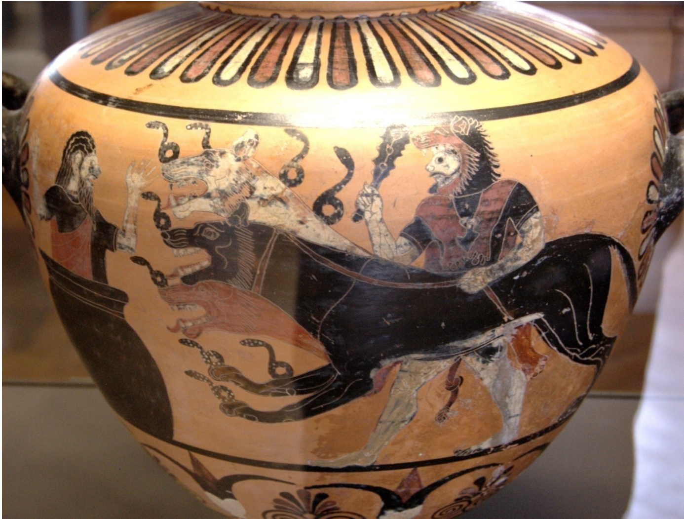
Kerberos a Hérakles