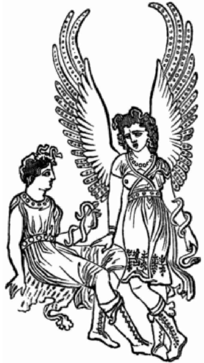
Klytaiméstra probouzí spící erínye, vpravo motiv z vázy