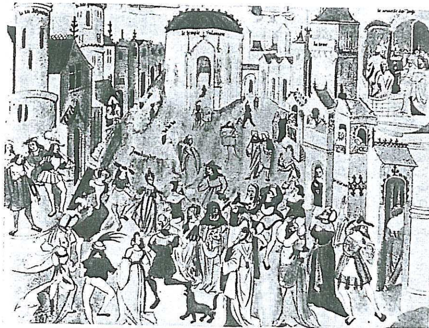
První den velkého lyonského mysteria o Spasiteli.