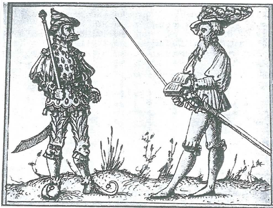
Herold a režisér hry z Curychu 1539.