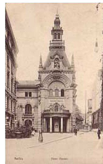
Václav Cejpek / říjen-prosinec 2013