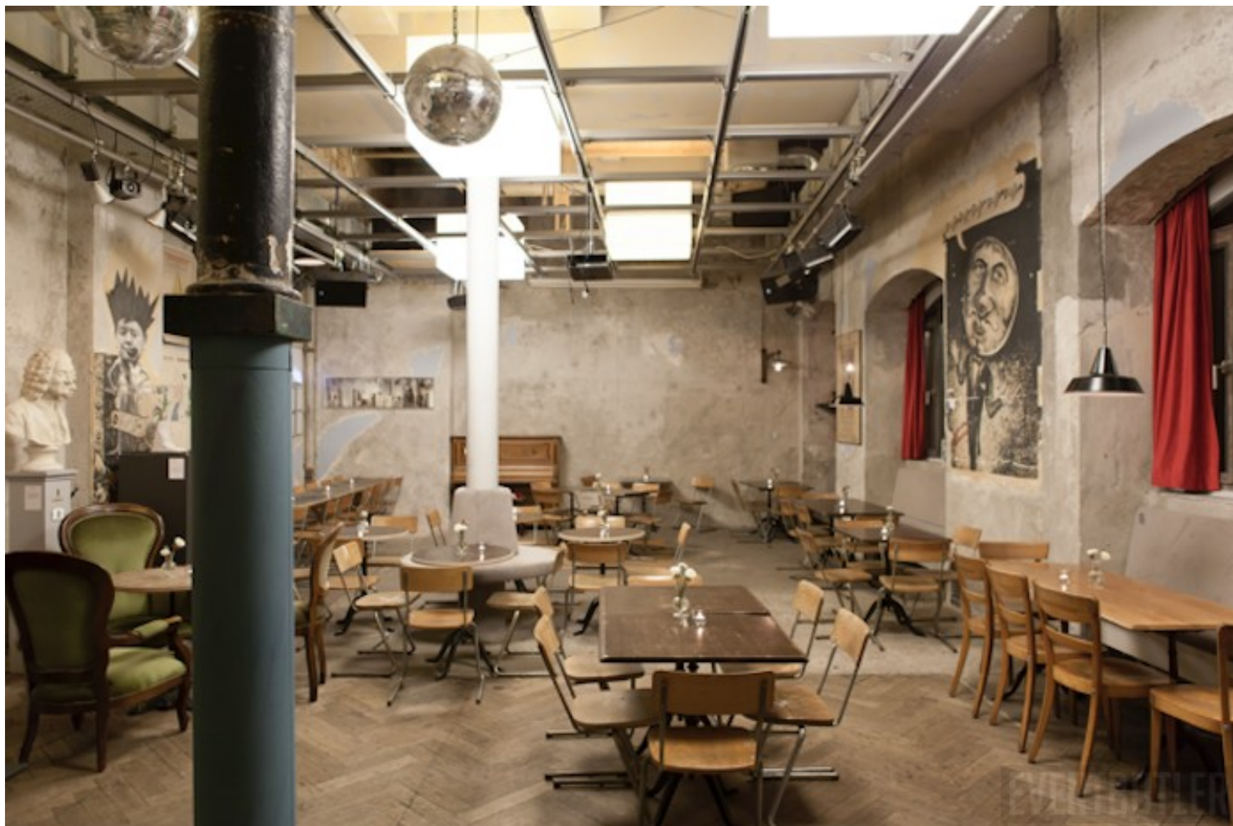
Cabaret Voltaire – současnost