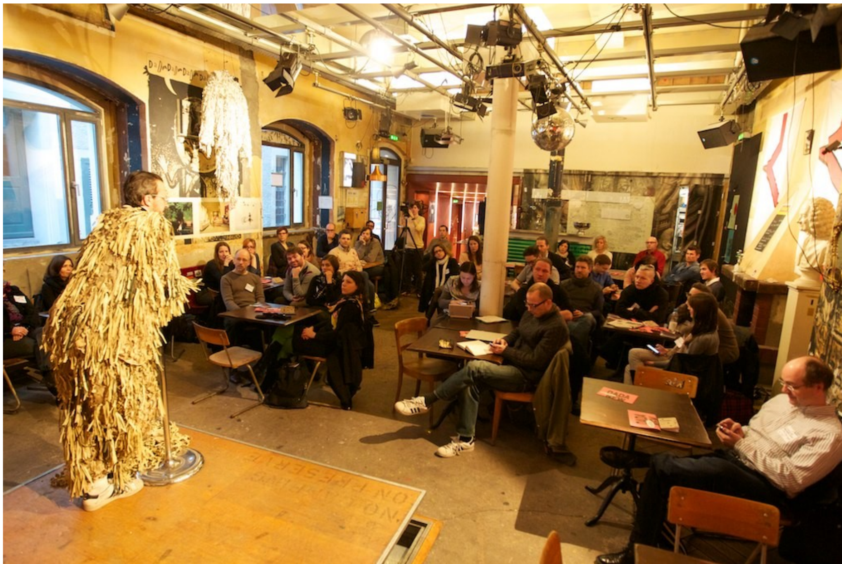
Cabaret Voltaire – současnost