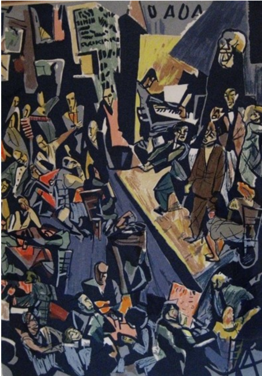
Marcel Janco: Cabaret Voltaire (1916)