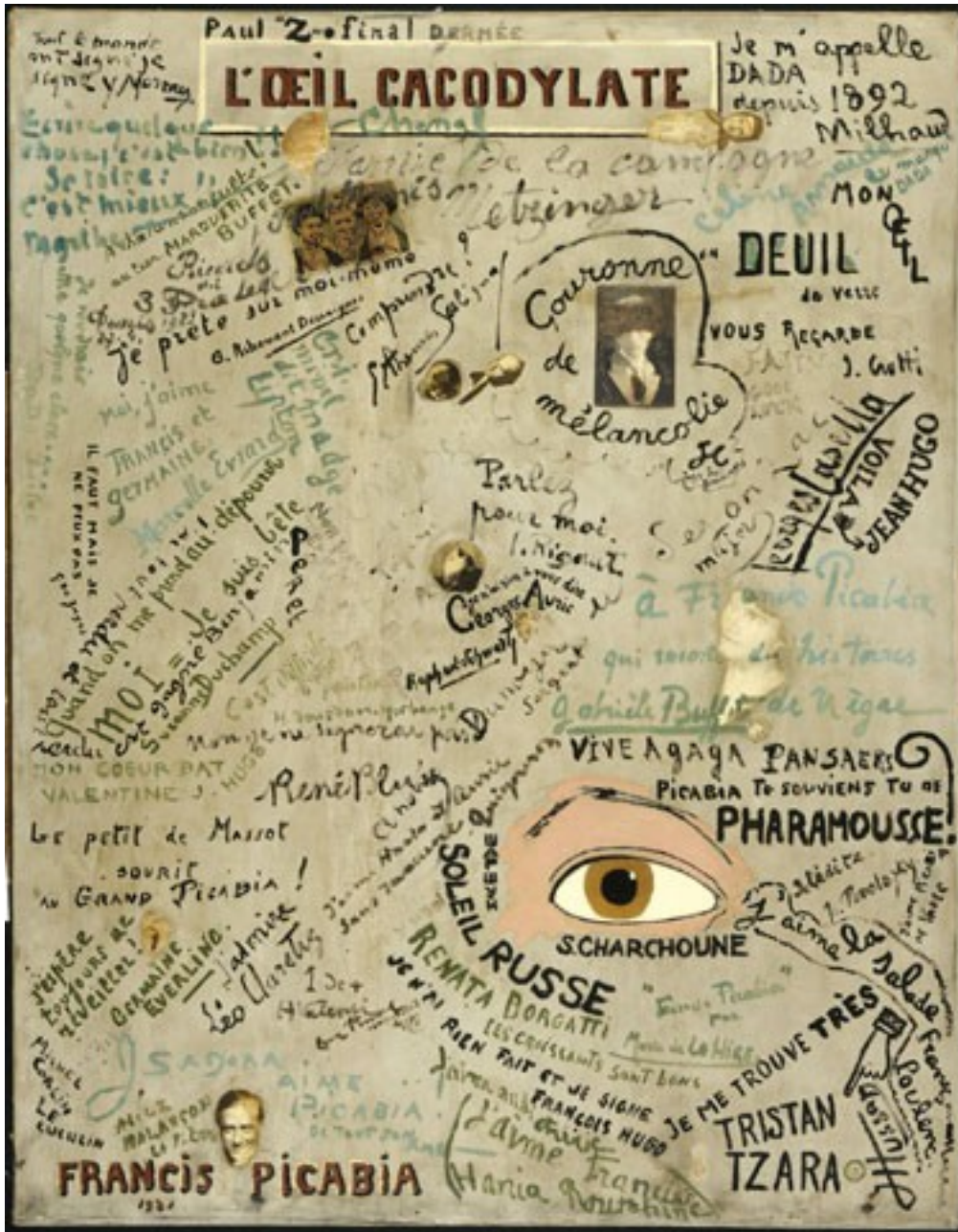
Francis Picabia: Kakodylické oko (1921 , Centre Pompidou)