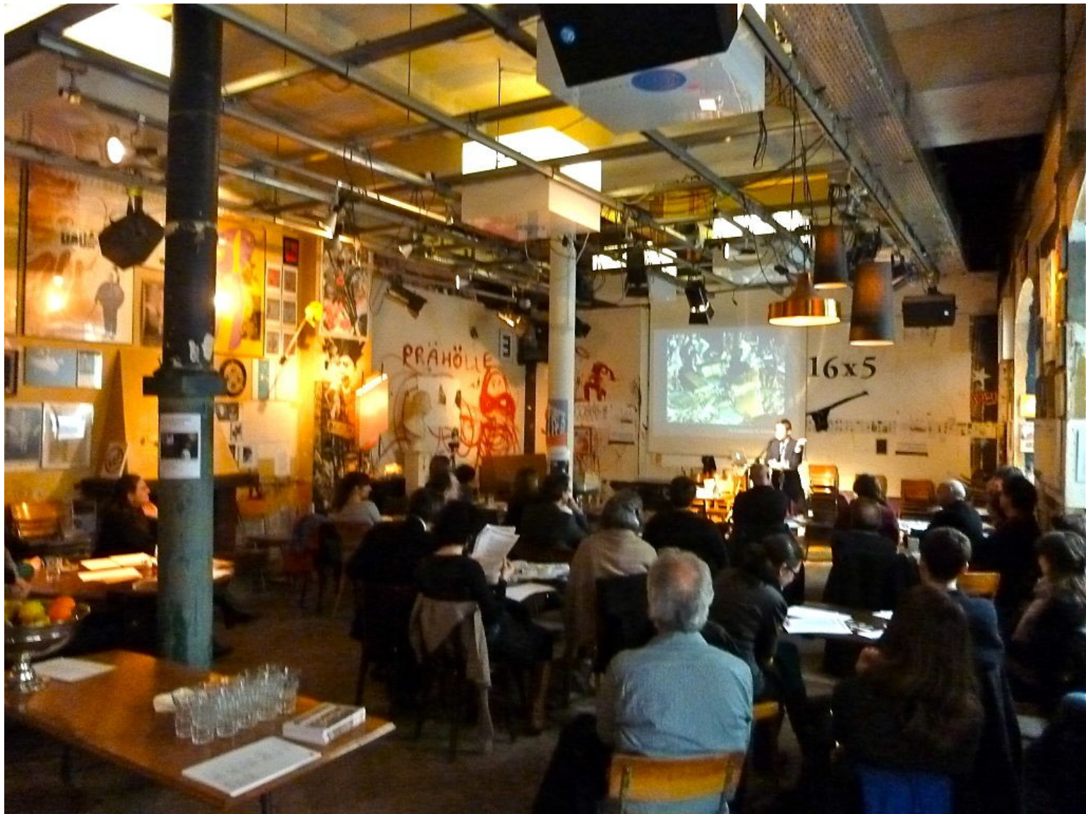
Cabaret Voltaire – současnost