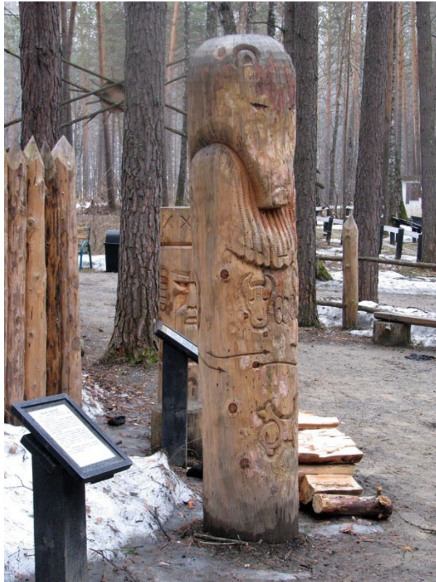
Kemerovo (JZ Sibiř, Rusko) idol Velesa