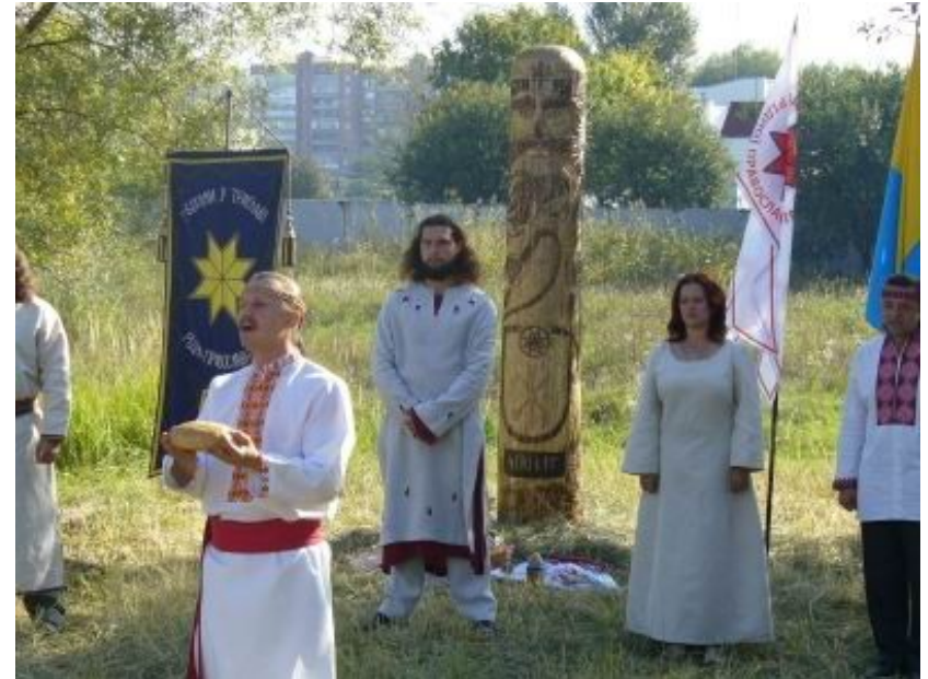
Stribogův idol (vlevo Rusko, vpravo Ukrajina)