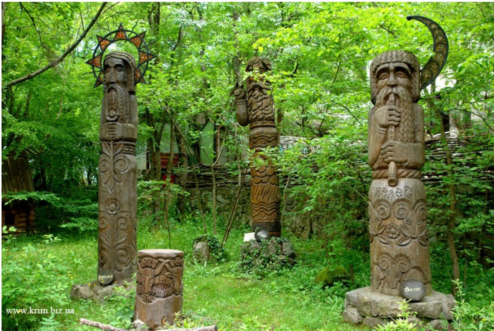
Jarilo, Perun, Veles (Krym)