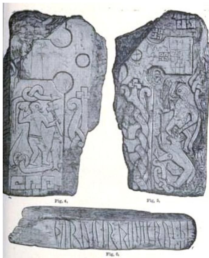
kříž z Andreas: