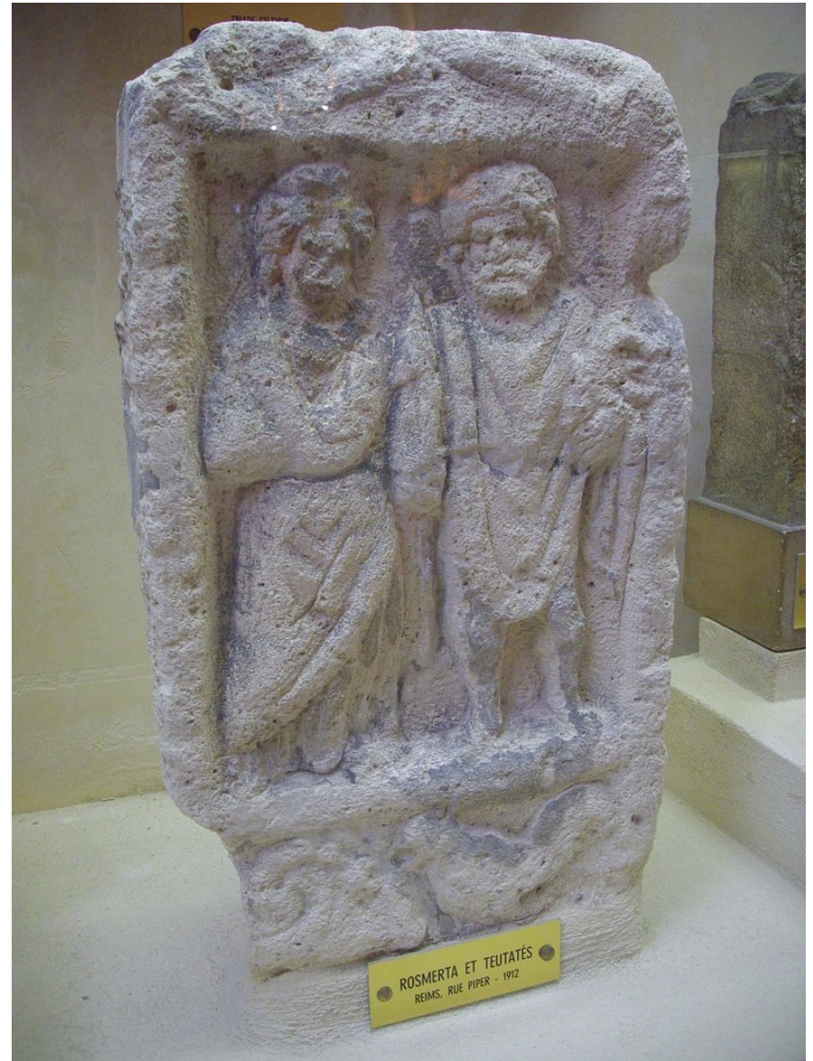
vlevo Teutates s beraní hlavou – vpravo keltská bohyně Rosmerta a Teutates (Museum Saint-Remi)