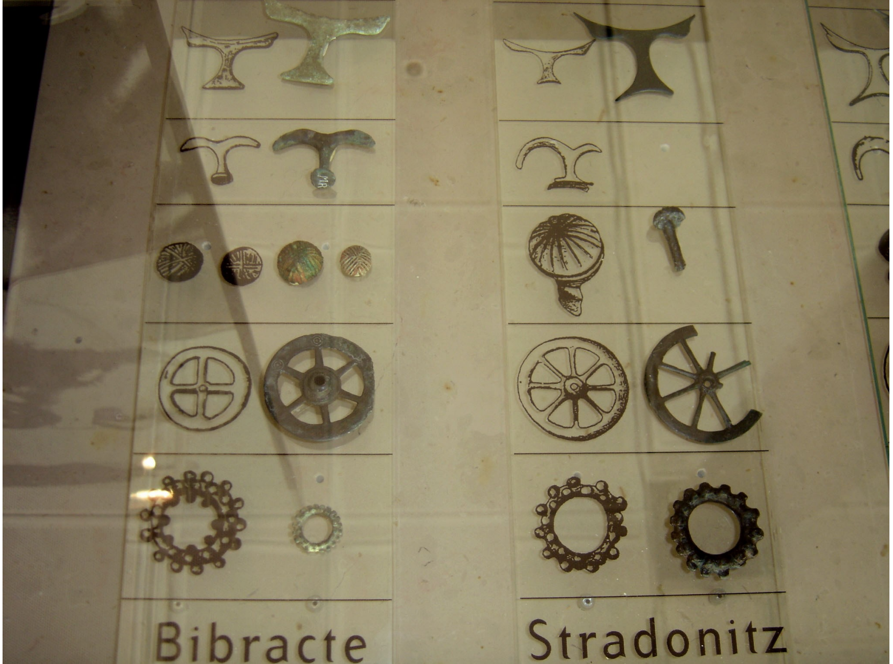
Taranisova kola (nálezy)