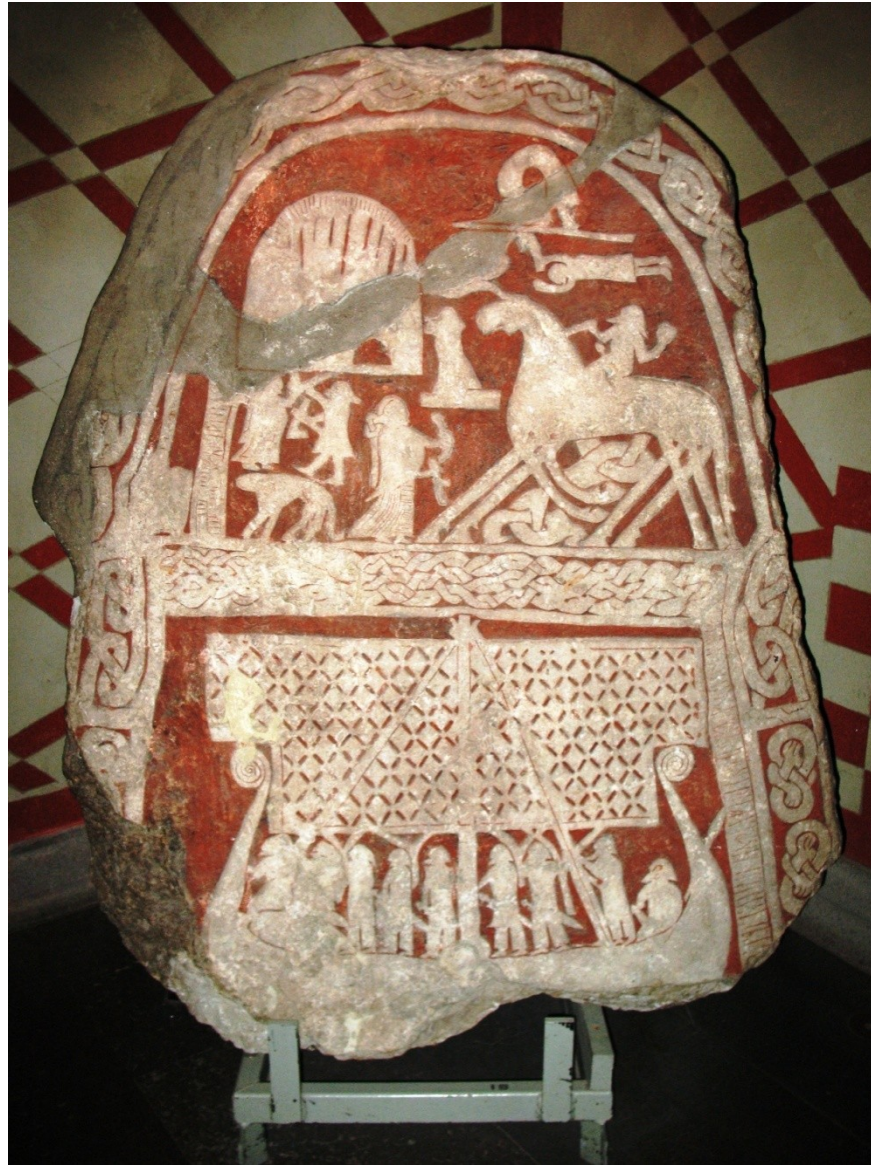
Ódin na svém 8nohém hřebci jede do Valhaly, ženy jsou valkýry (kamenný reliéf, Švédsko)