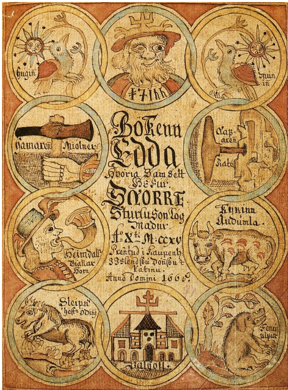
titulní strana Prozaické Eddy (vydání z 18. stol.)