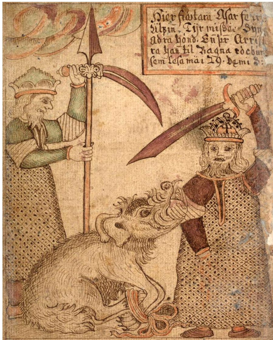
Fenri a Týr – 18. stol. (oblíbený výjev malířů)