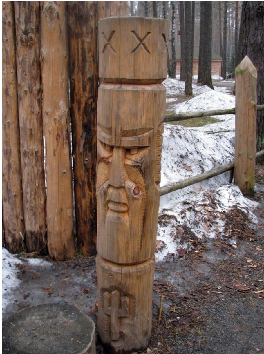
Kemerovo (JZ Sibiř, Rusko) pohanský duch