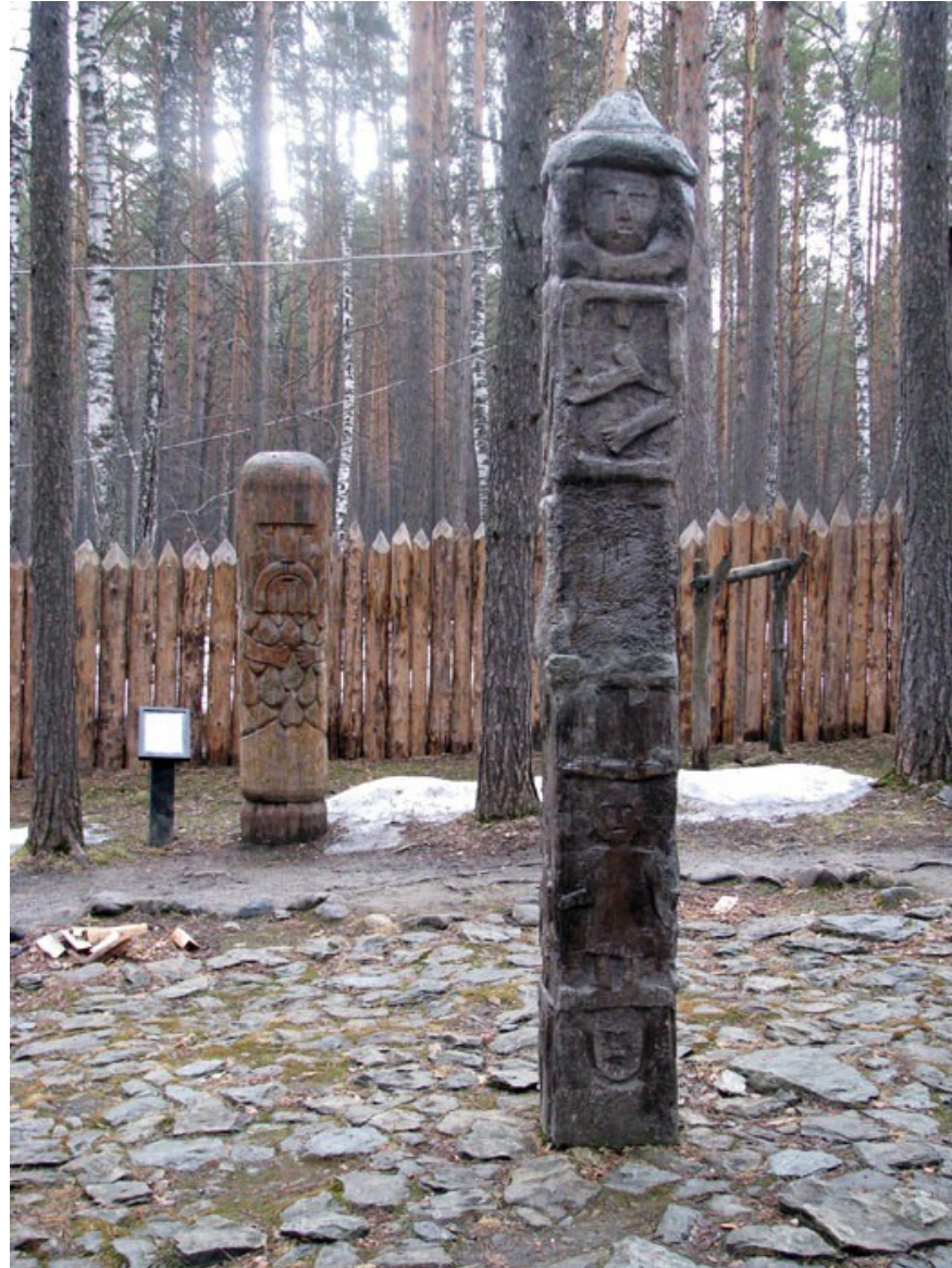
Kemerovo (JZ Sibiř, Rusko) vepředu idol „Peruna“ (ve skutečnosti jde o kopii Zbručského idolu), vzadu Jarilo