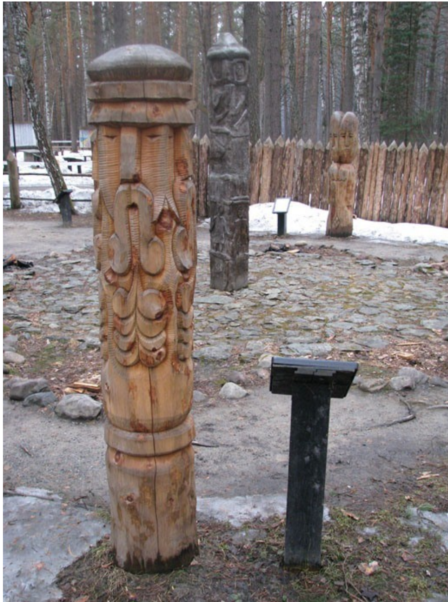
Kemerovo (JZ Sibiř, Rusko) idol Svantovita