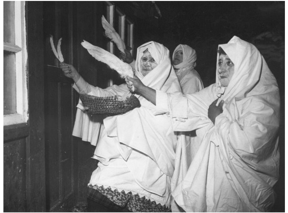
lucky – Francova Lhota (1974)