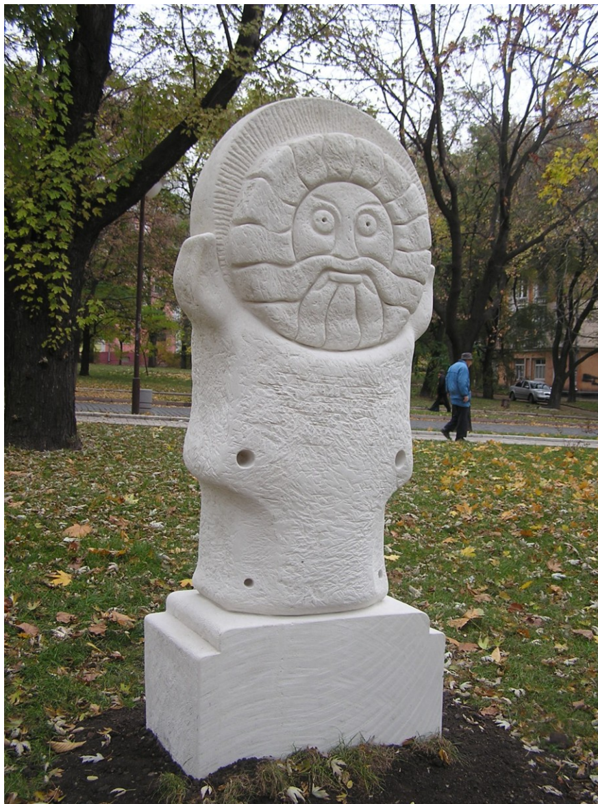
Jarilo (socha idolu v Doněcku, Ukrajina)