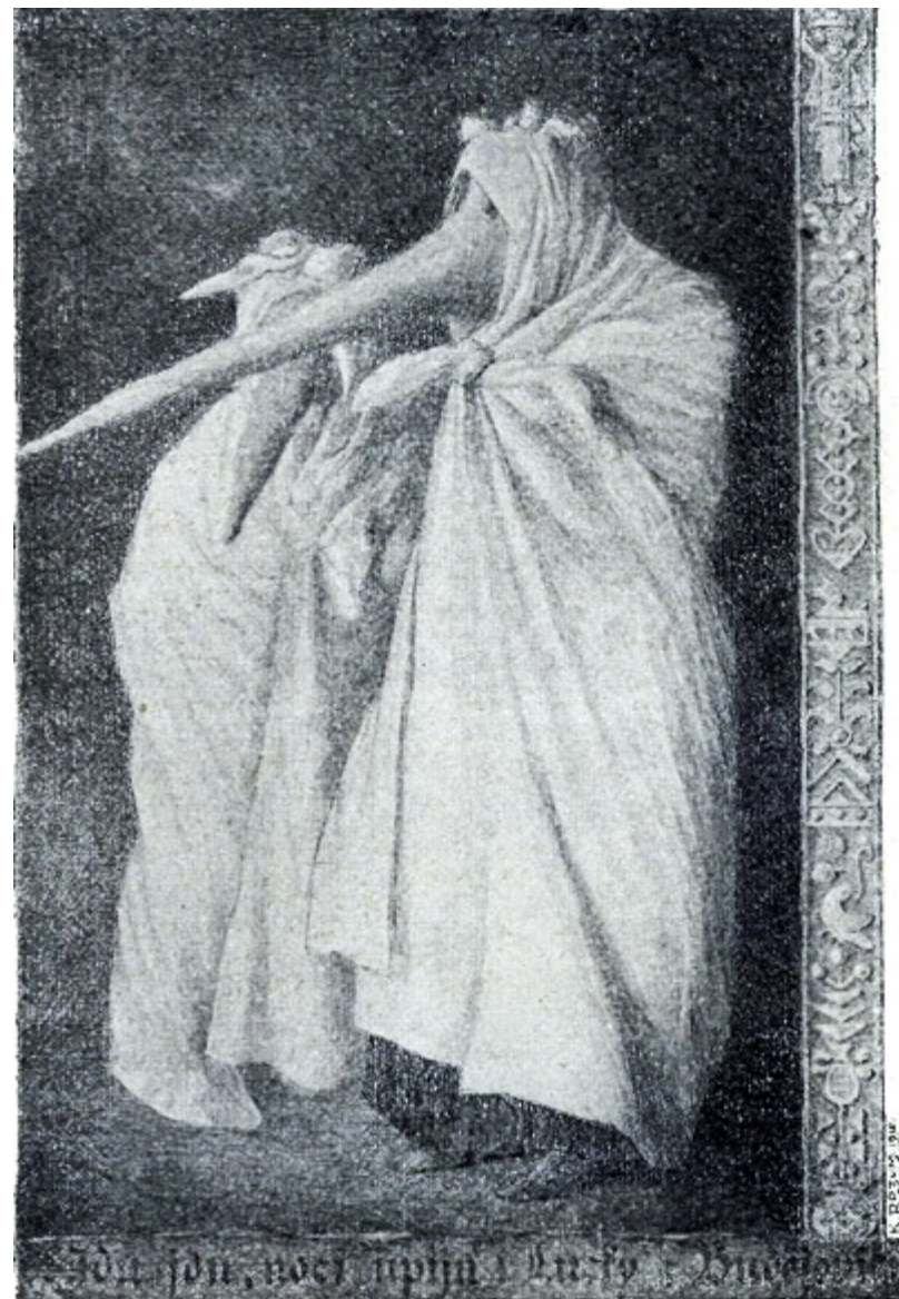
lucky (jižní Čechy – Budějovicko)