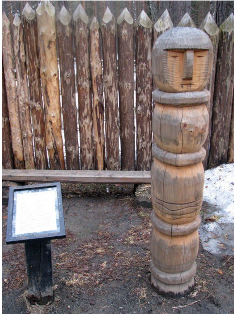
Kemerovo (JZ Sibiř, Rusko) idol Roda