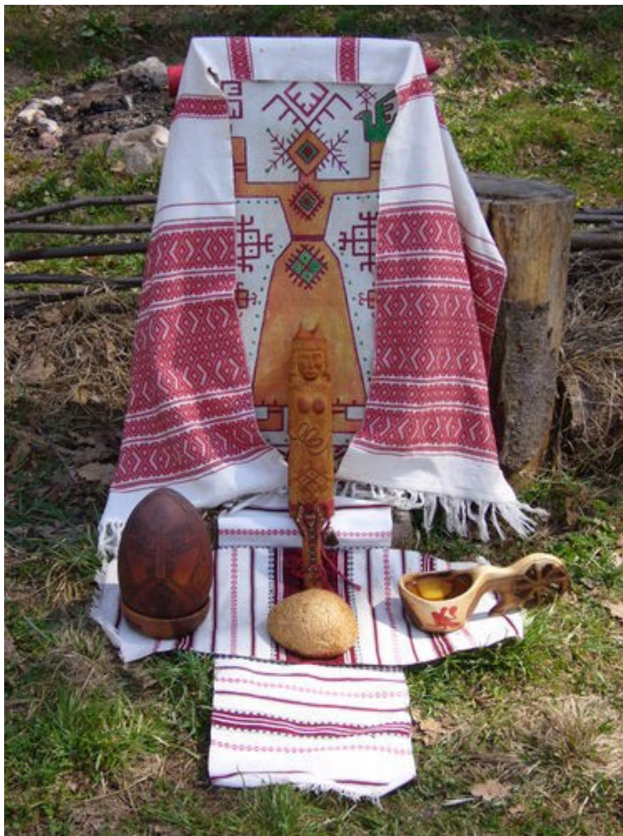
Mokošin oltář (Rusko)