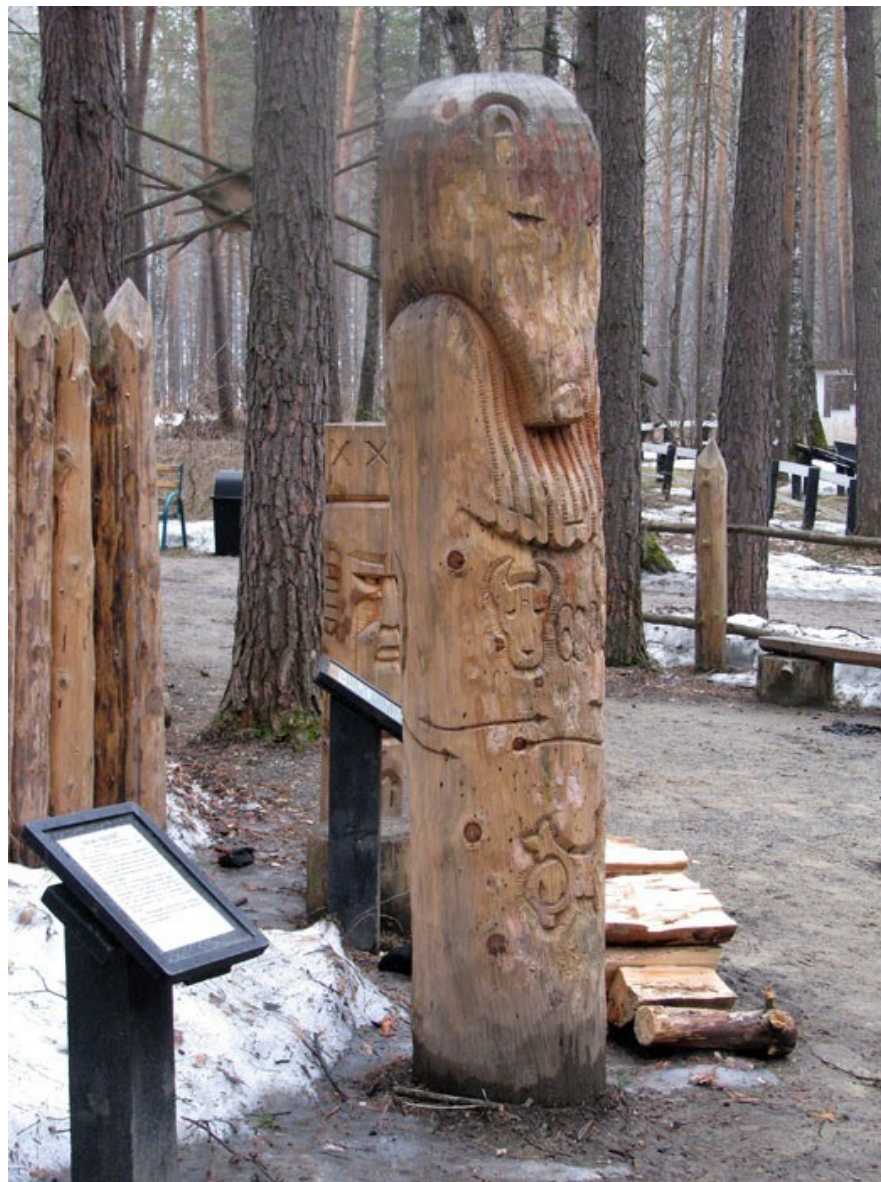
Kemerovo (JZ Sibiř, Rusko) idol Velesa