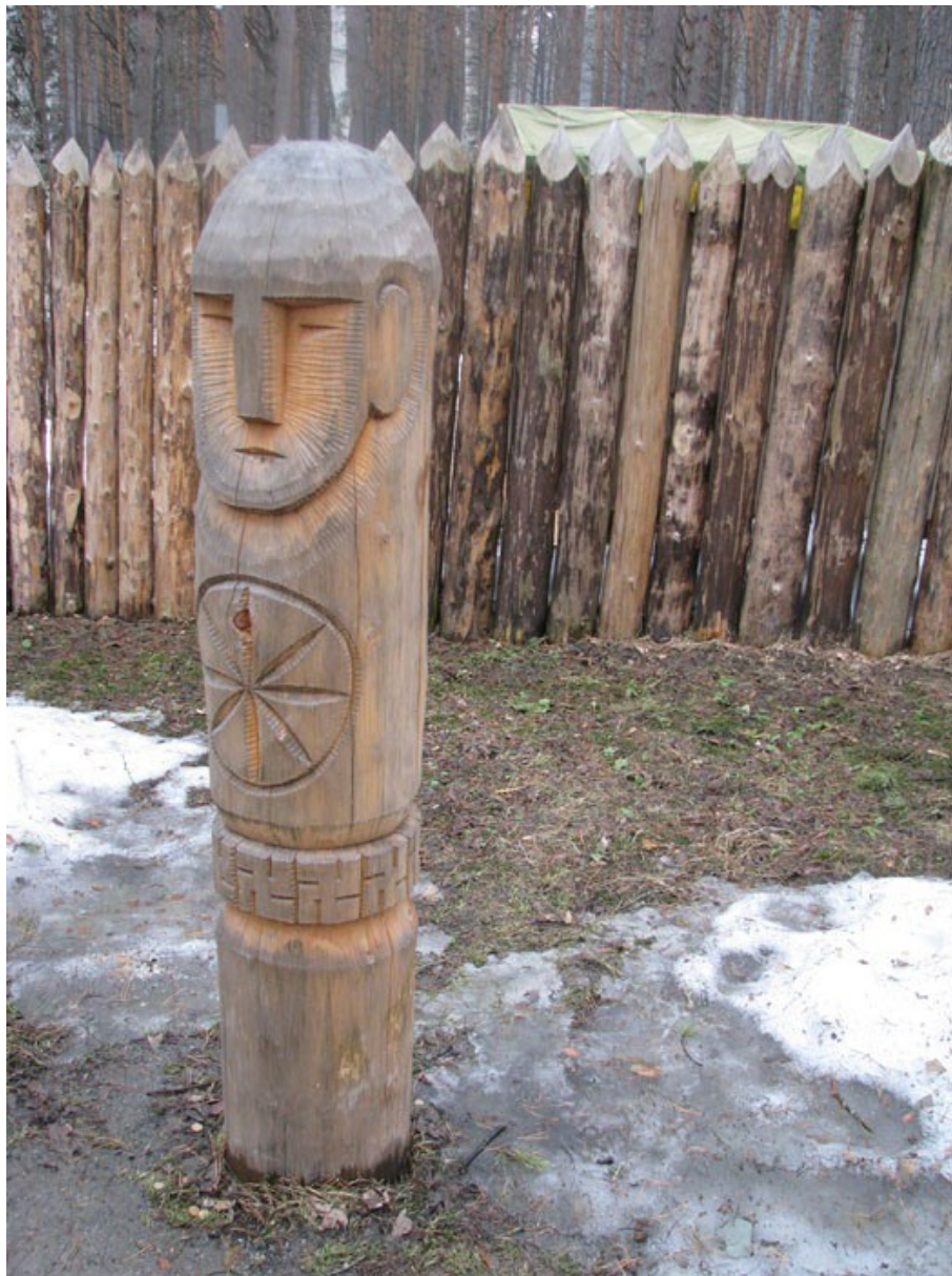
Kemerovo (JZ Sibiř, Rusko) idol Svaroga