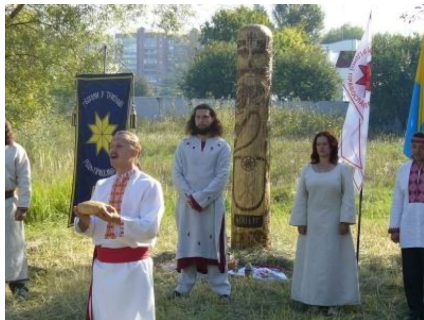
Stribogův idol (vlevo Rusko, vpravo Ukrajina)