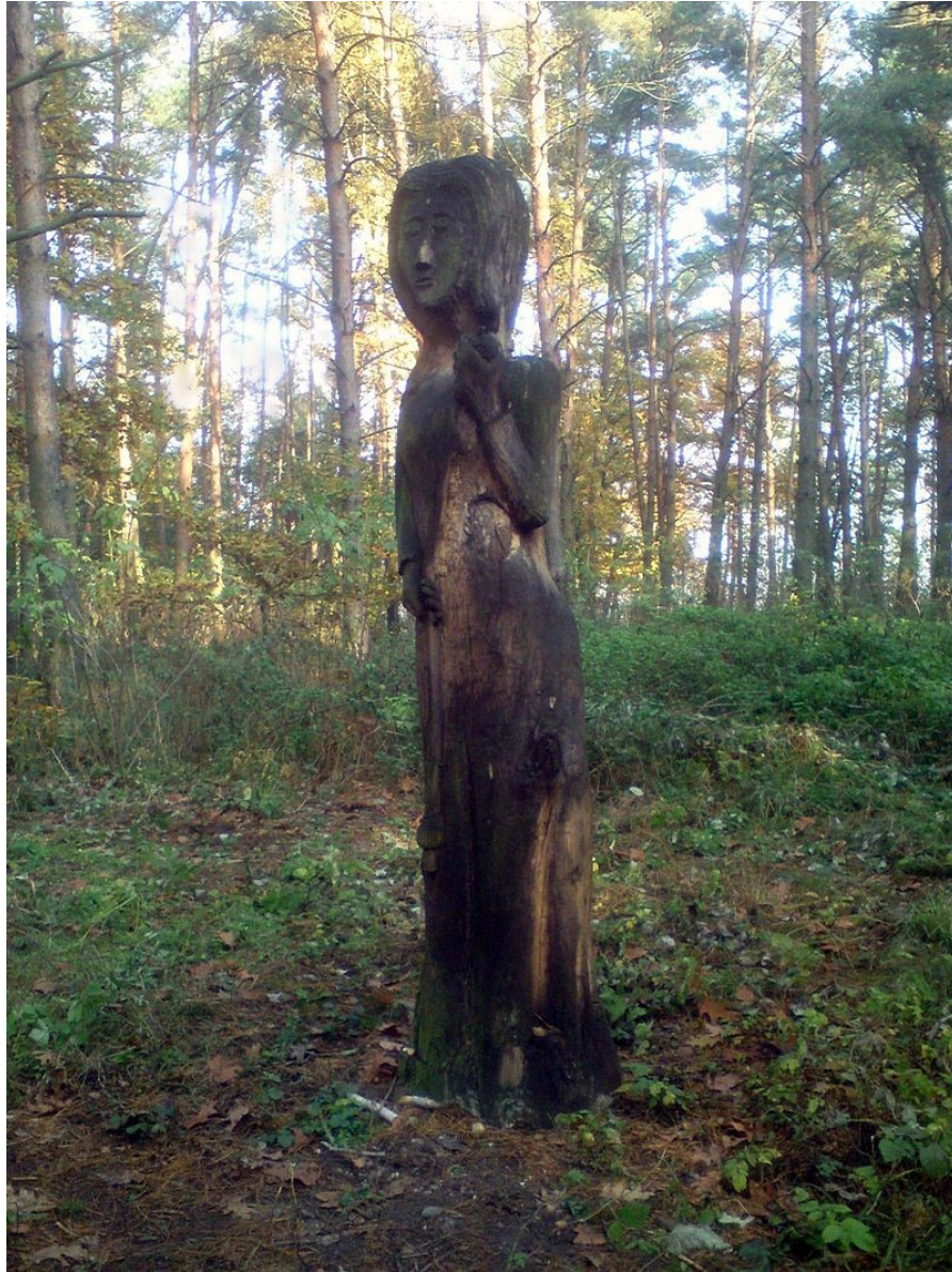
novodobý idol Mokoš poblíž obce Mokošín (vrch Křemen)