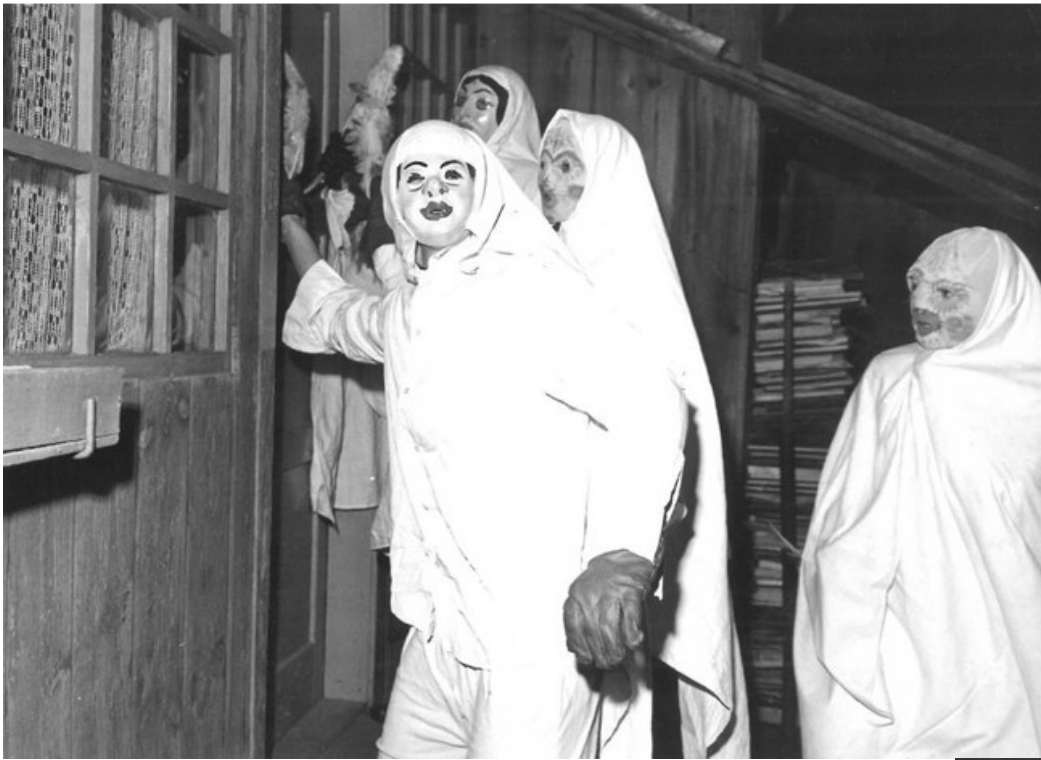
lucky s obličejovou maskou – Lačnov (1975)