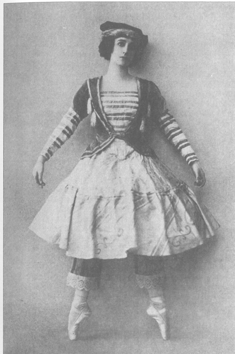
Tamara Karsavina v roli Baleríny, 1911.

Zcela odlišná situace však pochopitelně provázela přípravu choreografie pro hlavní postavy baletu. Východiskem mé práce se staly loutkové, lidem zcela nepřirozené pohyby, vyjadřující tři rozdílné charaktery, které by i přes svá loutková gesta dokázaly divákům odhalit skutečnou lidskou podstatu hrdinů, ukrytou uvnitř. Balerína se tak v mém pojetí stala dětsky naivní, hloupou, ale zároveň překrásnou a všemi obdivovanou dětskou panenkou. Když Karsavina tančila tuto úlohu, dokázala zahrát svoji roli naprosto přesně a správně (jako nikdo jiný později) a pochopitelně vzbudila množství komplimentů ze strany publika. Přesto však i ona si v průběhu příprav stěžovala na obtížnost své role. Nedokázal jsem pochopit, co by mohlo být tak obtížné? Všechna gesta jsem jí přece předvedl, všechny rysy loutkovosti byly nakresleny přímo na její tváři v podobě dvou červených jablíček, zářících z jejího výrazu obličeje. Nic skutečně nového tedy tvořit nebylo třeba. Stačilo pouze přesně dodržet každý pohyb a gesto. Když jsem však později viděl další nastudování Petrušky , realizovaná již bez mojí účasti, teprve pak jsem pochopil, jak geniální její pojetí postavy bylo. Opět jsem si proto musel položit otázku, proč nemožou tyto další představitelky Baleríny naplnit svoji úlohu stejnou energií a výrazem jako Karsavina? Odpověď byla více než prostá, i když se zdála být na první pohled skryta kdesi pod povrchem... Je pochopitelně pravdou,