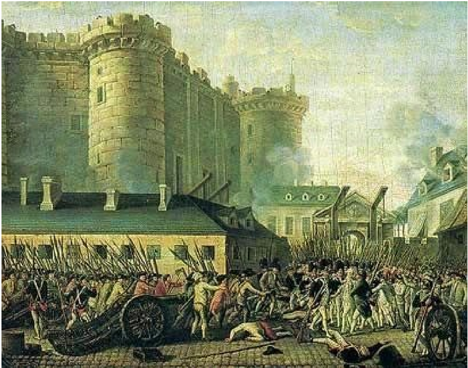
14. července 1789: útok na Bastilu