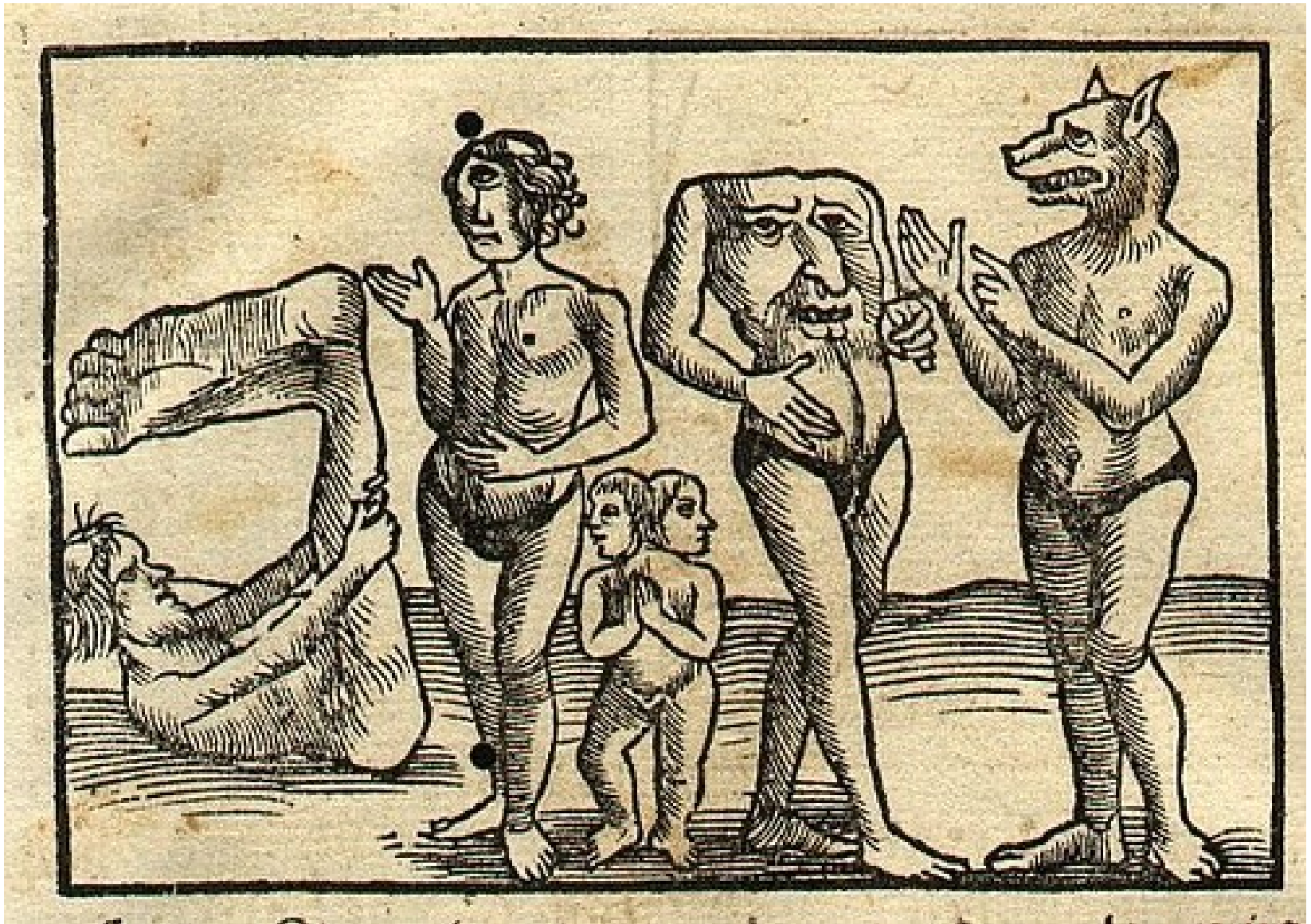
in: Sebastian Münster – Cosmographiae universalis libri (VI,1550)