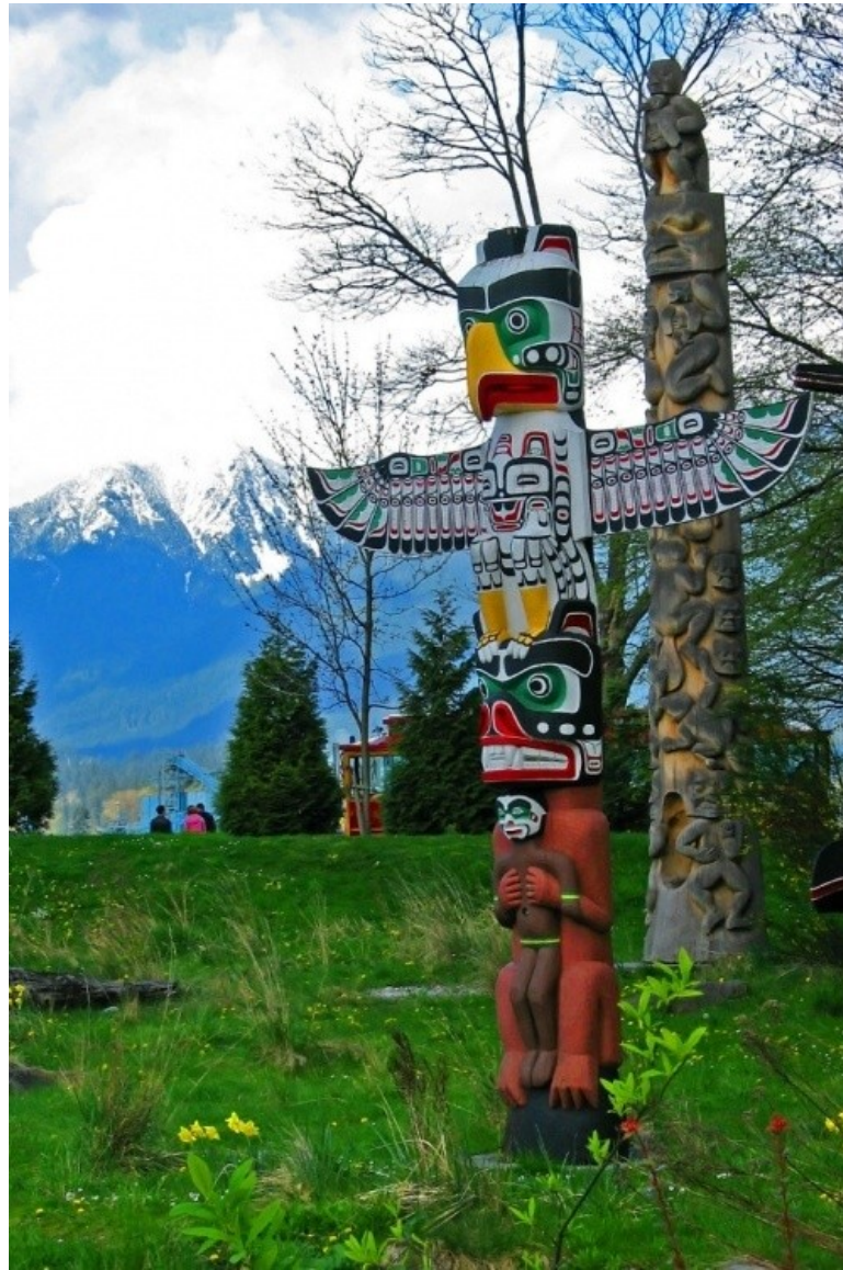
Hromový pták jako součást rodového totemu