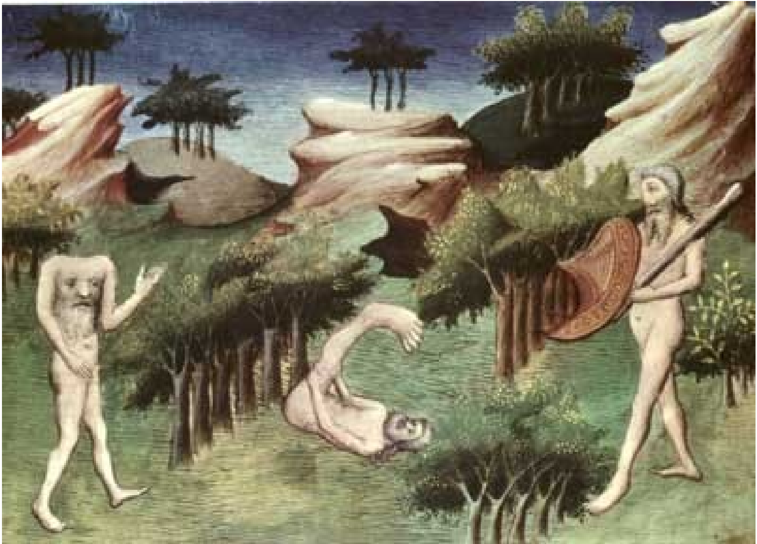
evropská představa o podobě obyvatel Nového světa