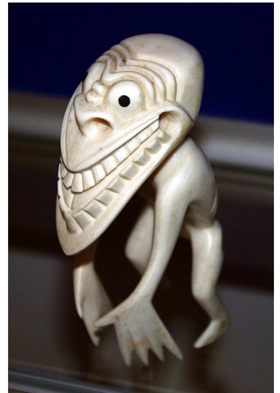
tupilaky coby „amulety“ pro turisty