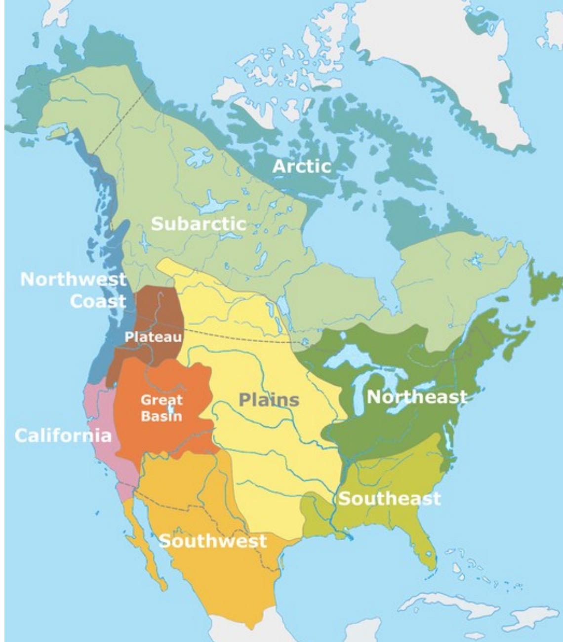
kulturní oblasti Severní Ameriky