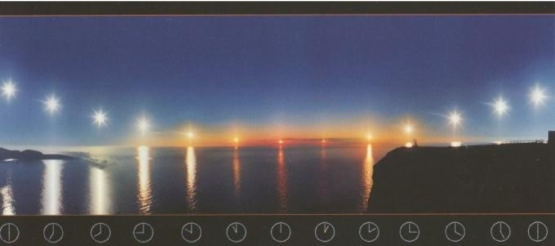
fáze polárního dne (uprostřed půlnoc)