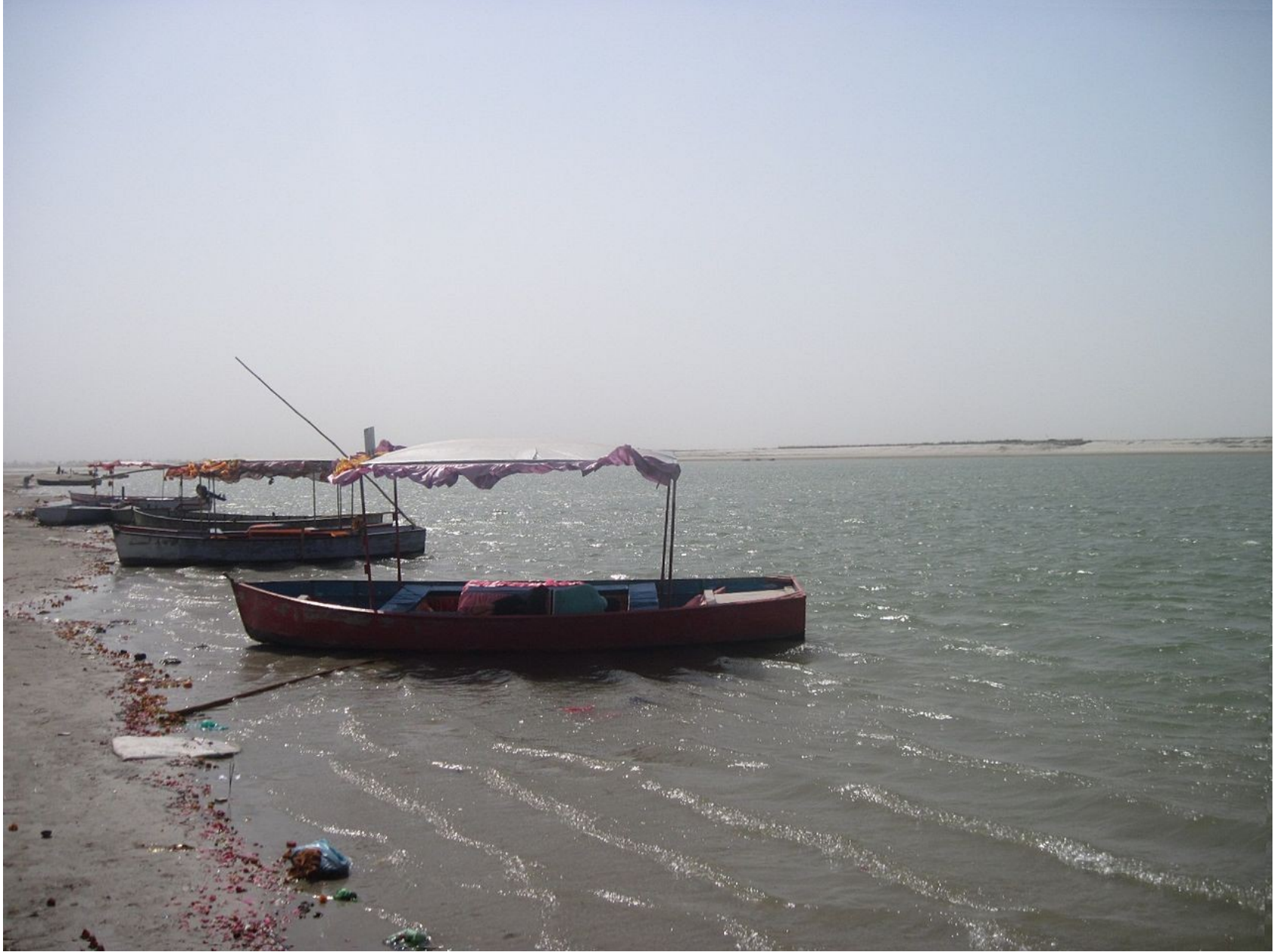
zbytky obětín na březích Gangy