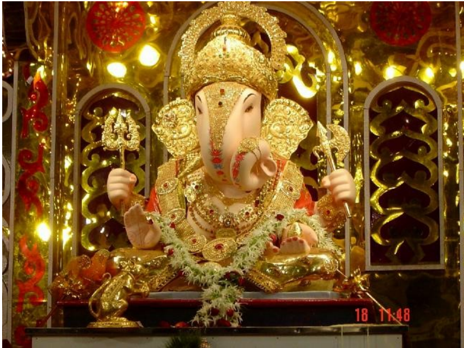
Ganéša – oltář