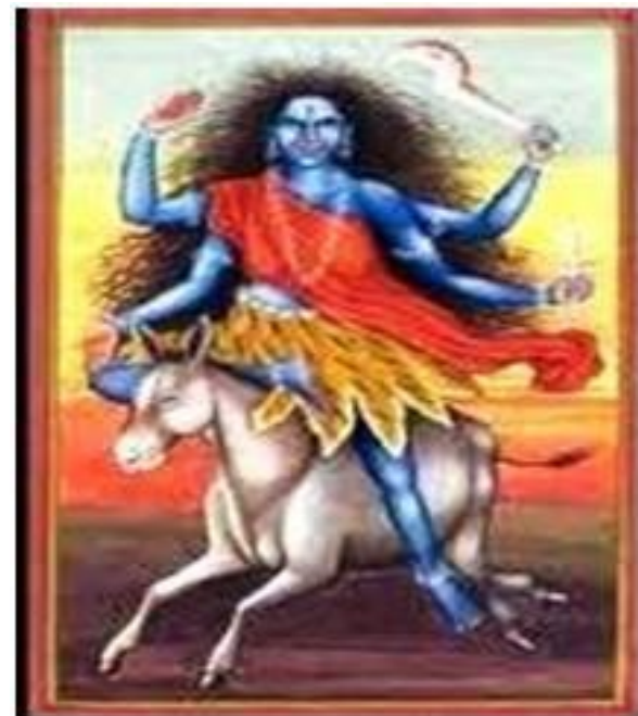
její sestra Alakšmí