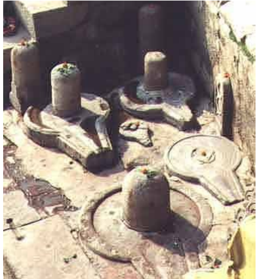
lingam a jóni