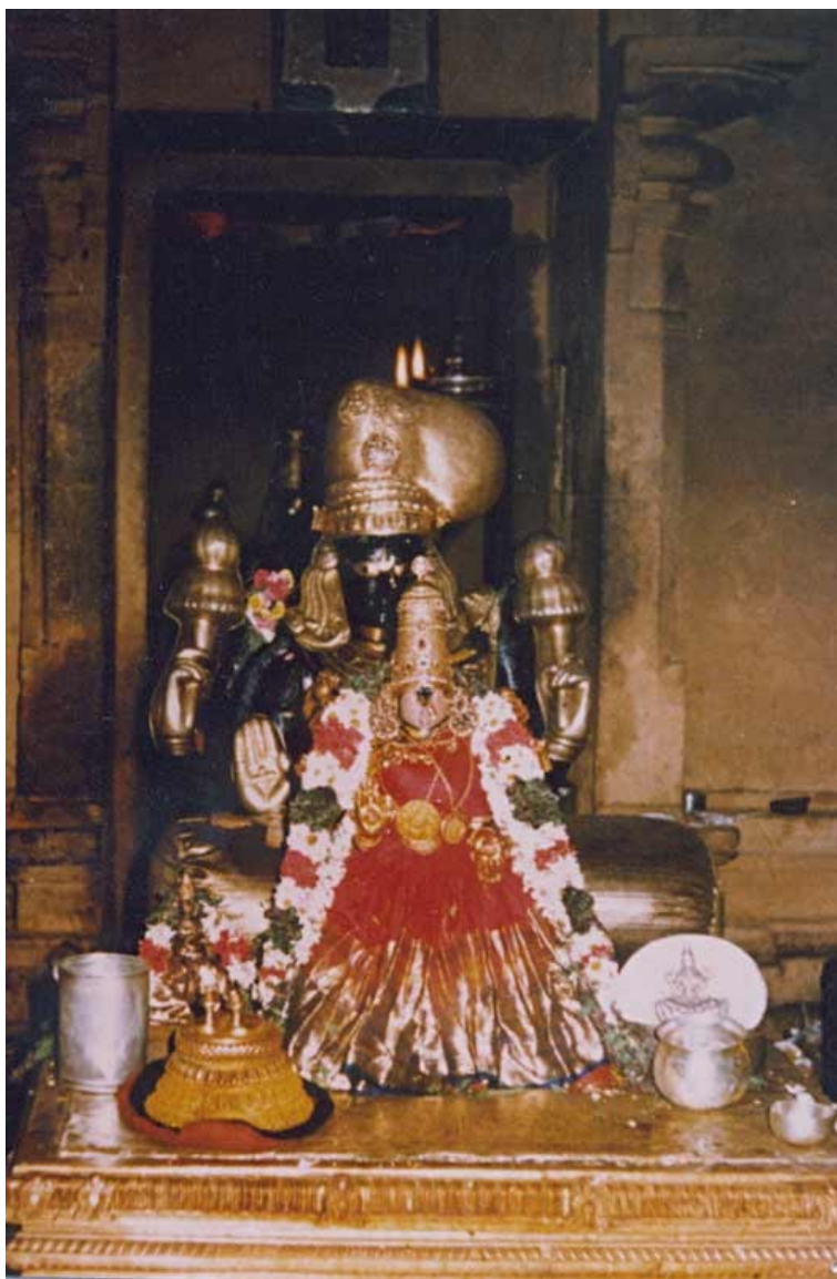
Lakšmí na oltáři