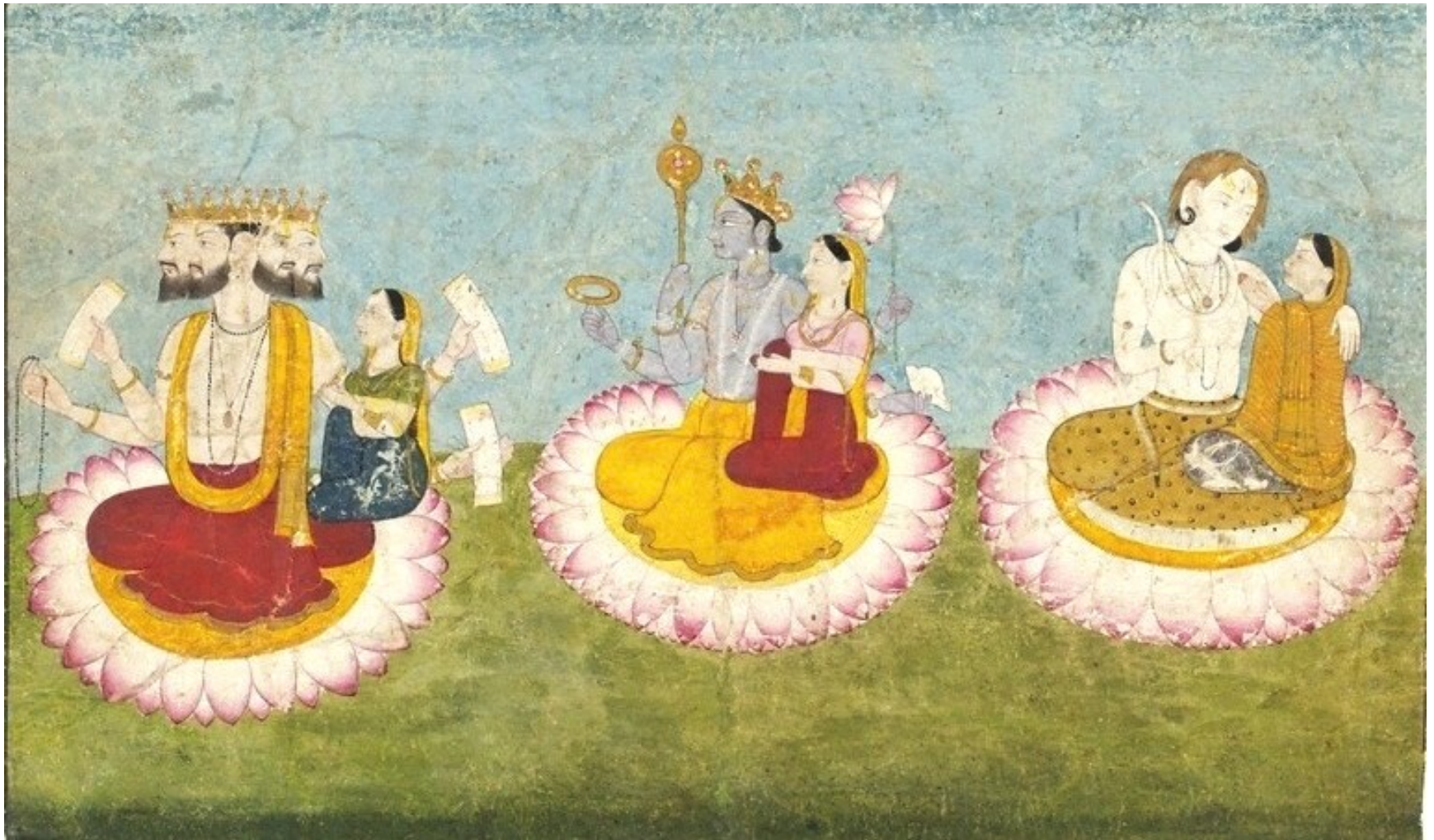
Trimúrti s manželkami – zleva: Brahma a Sarasvatí, Višnu a Lakšmí, Šiva a Parvatí