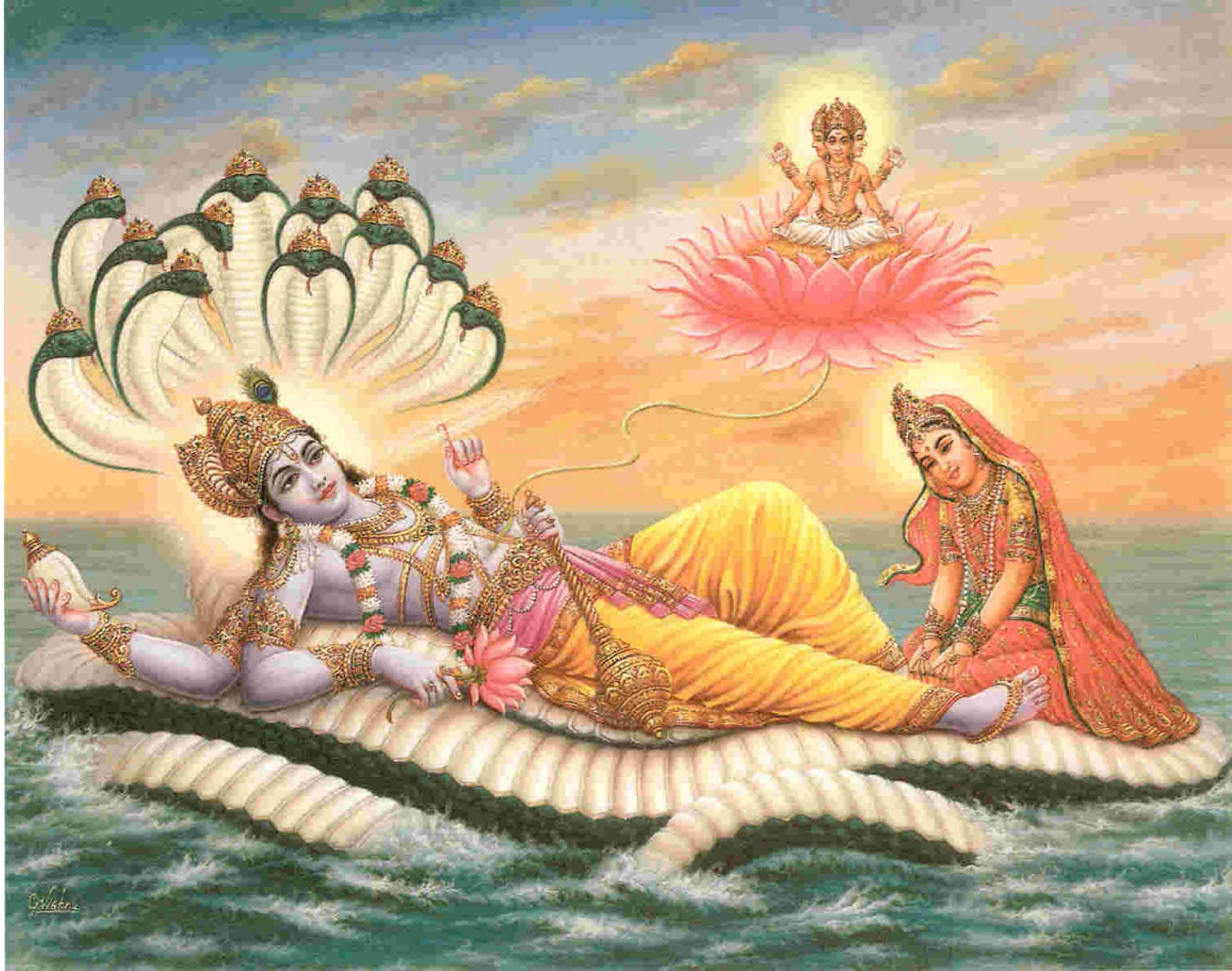
Višnu a Lakšmí probuzeni Brahmou