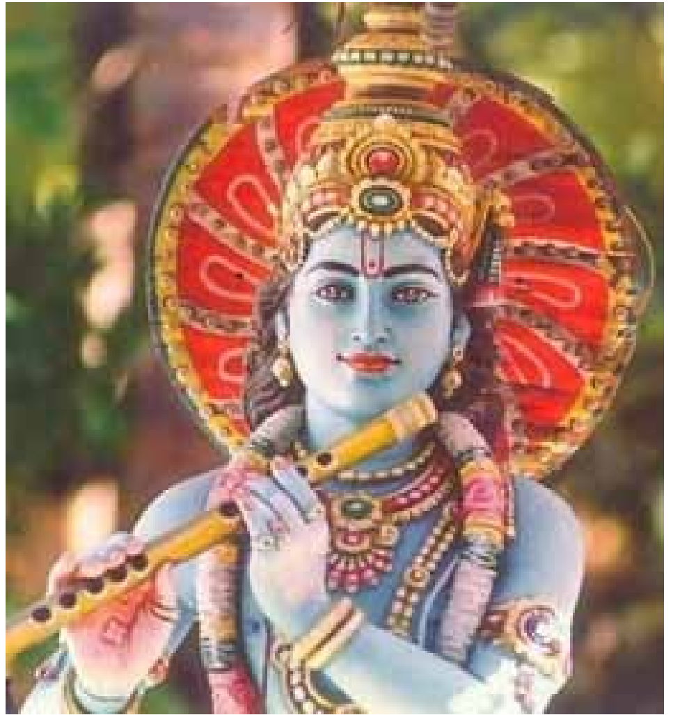
princ Ráma (vlevo), pastýř a král Kršna (vpravo)