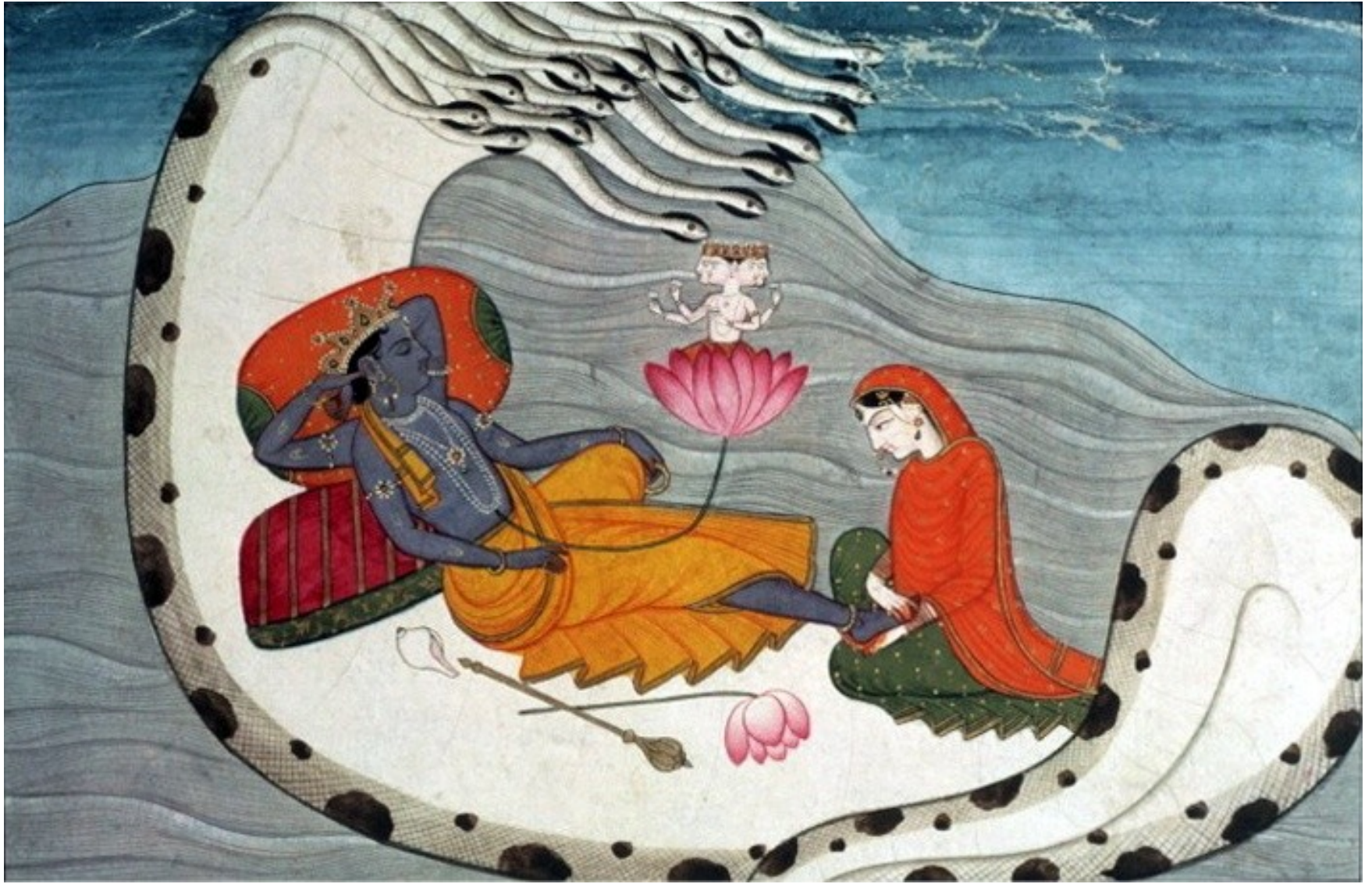
spící Višnu a Lakšmí na Šéšově těle (na lotosu Brahma před stvořením vesmíru)