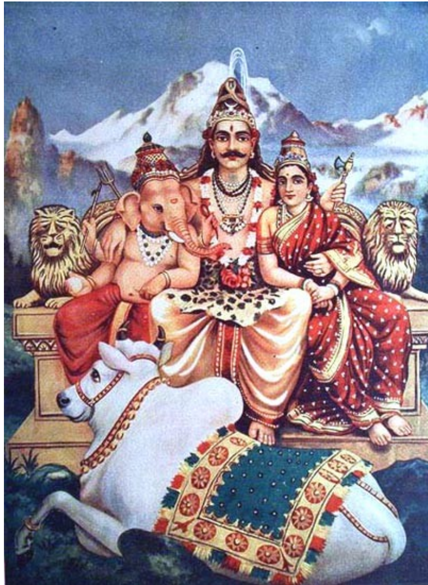
Ganéša s rodiči