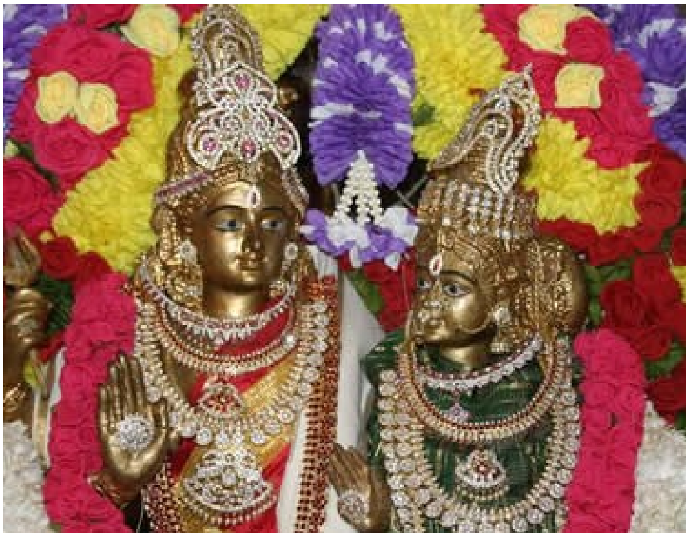
Šiva a Párvatí – oltář