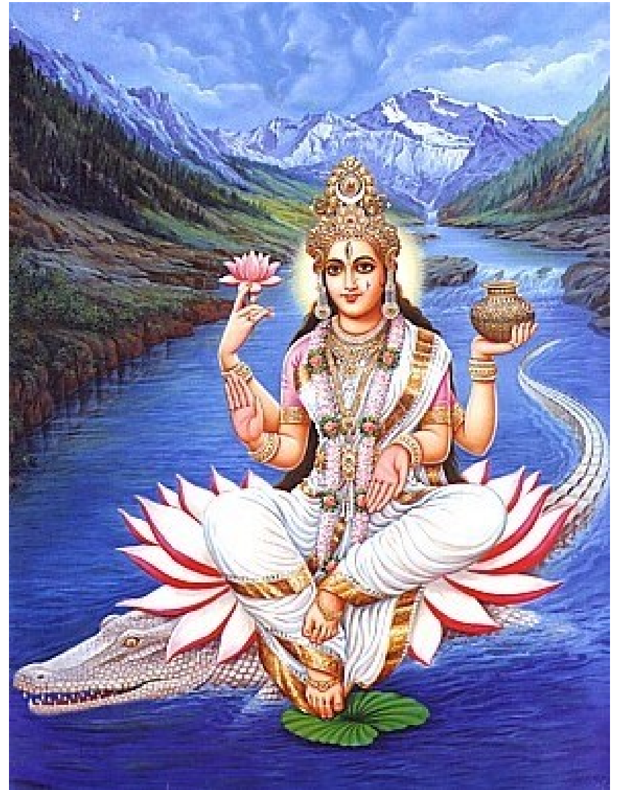
Ganga (a Šiva)