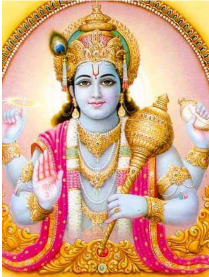
Višnu s božskými atributy