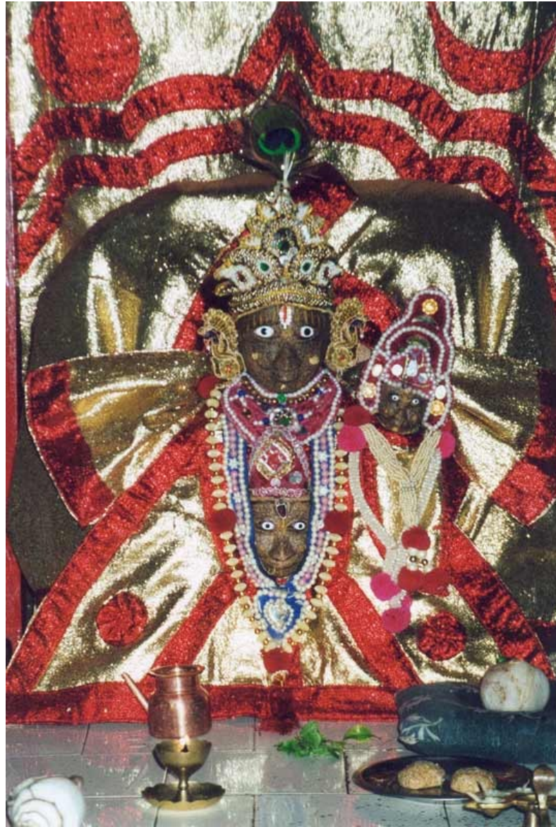
Višnu na oltáři coby původní přírodní božstvo Nárájáma