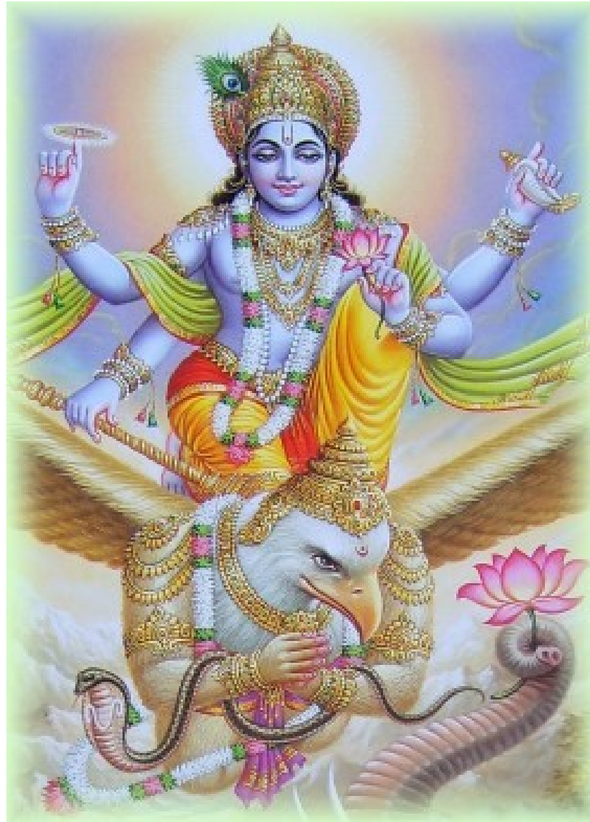
Višnu letící na orlu