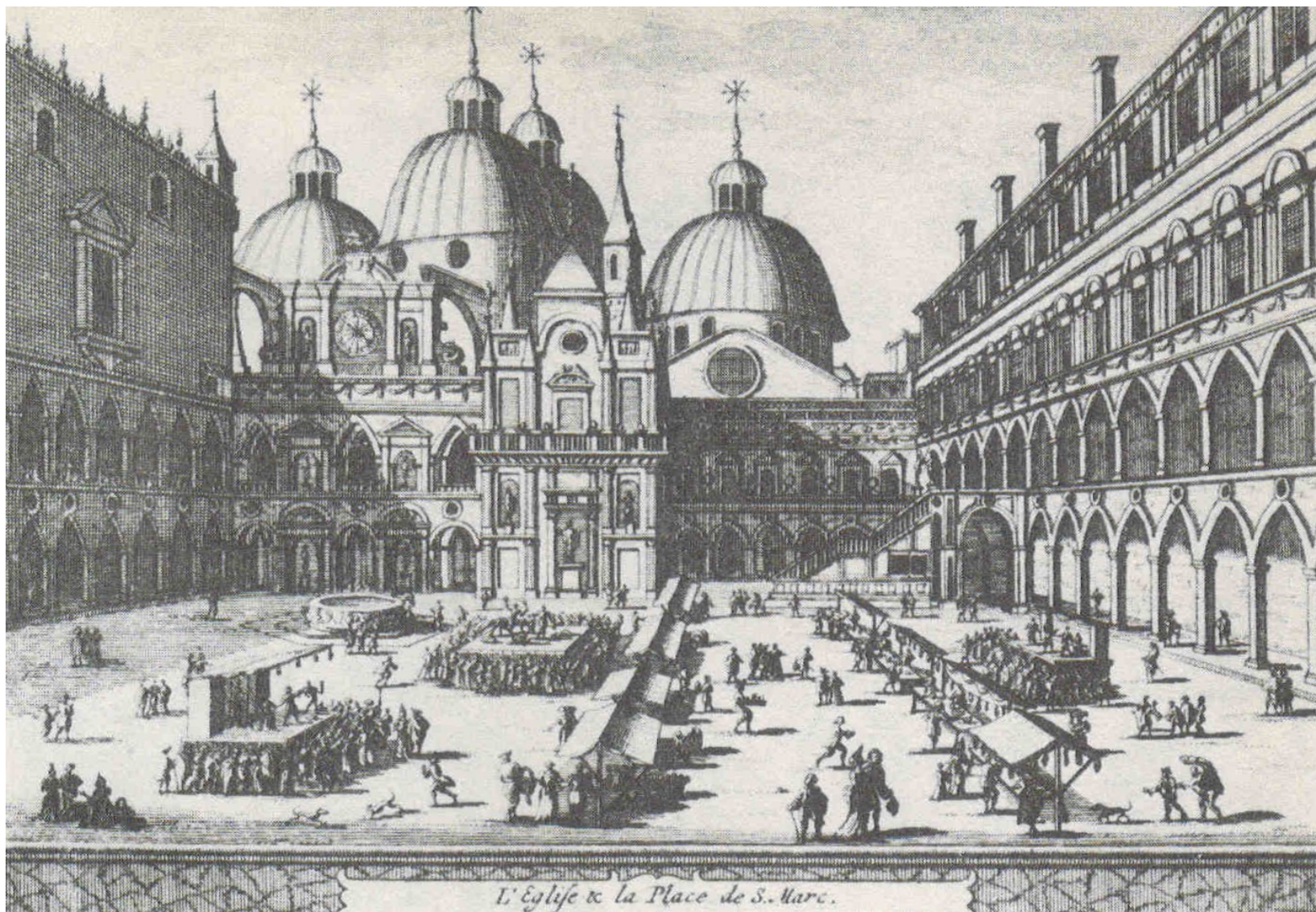
nám. sv. Marka v době karnevalu