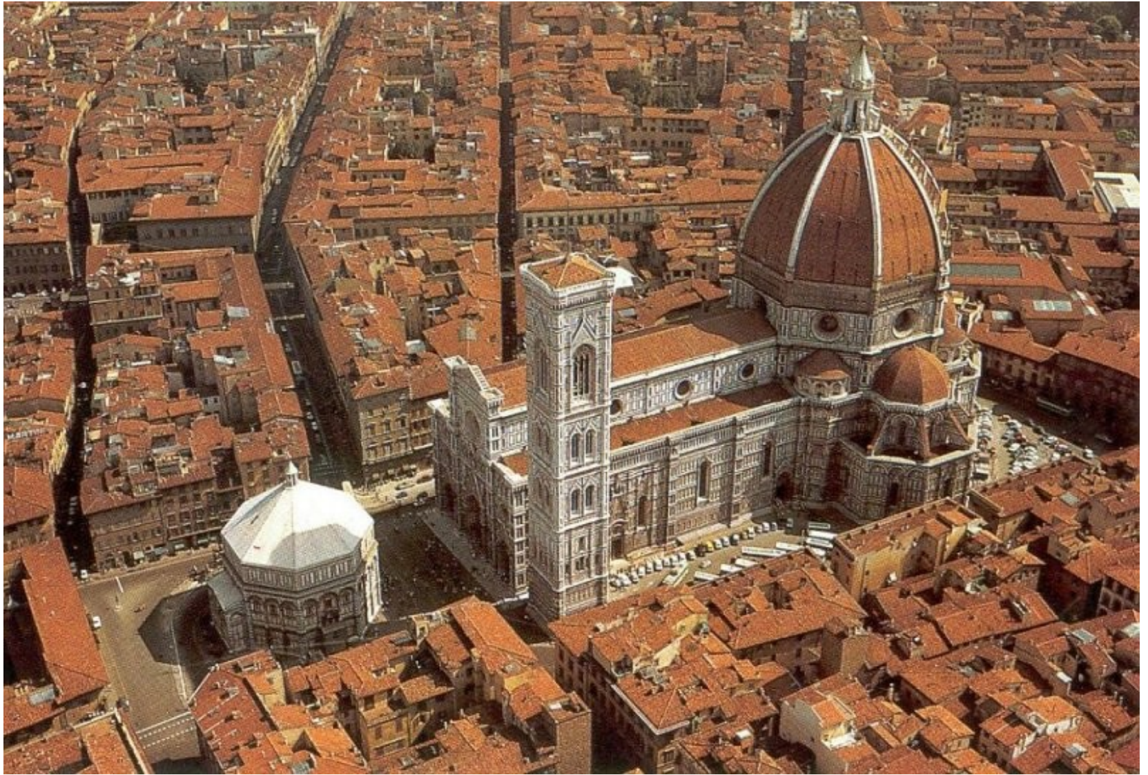
Florencie: katedrála Santa Maria Del Fiore