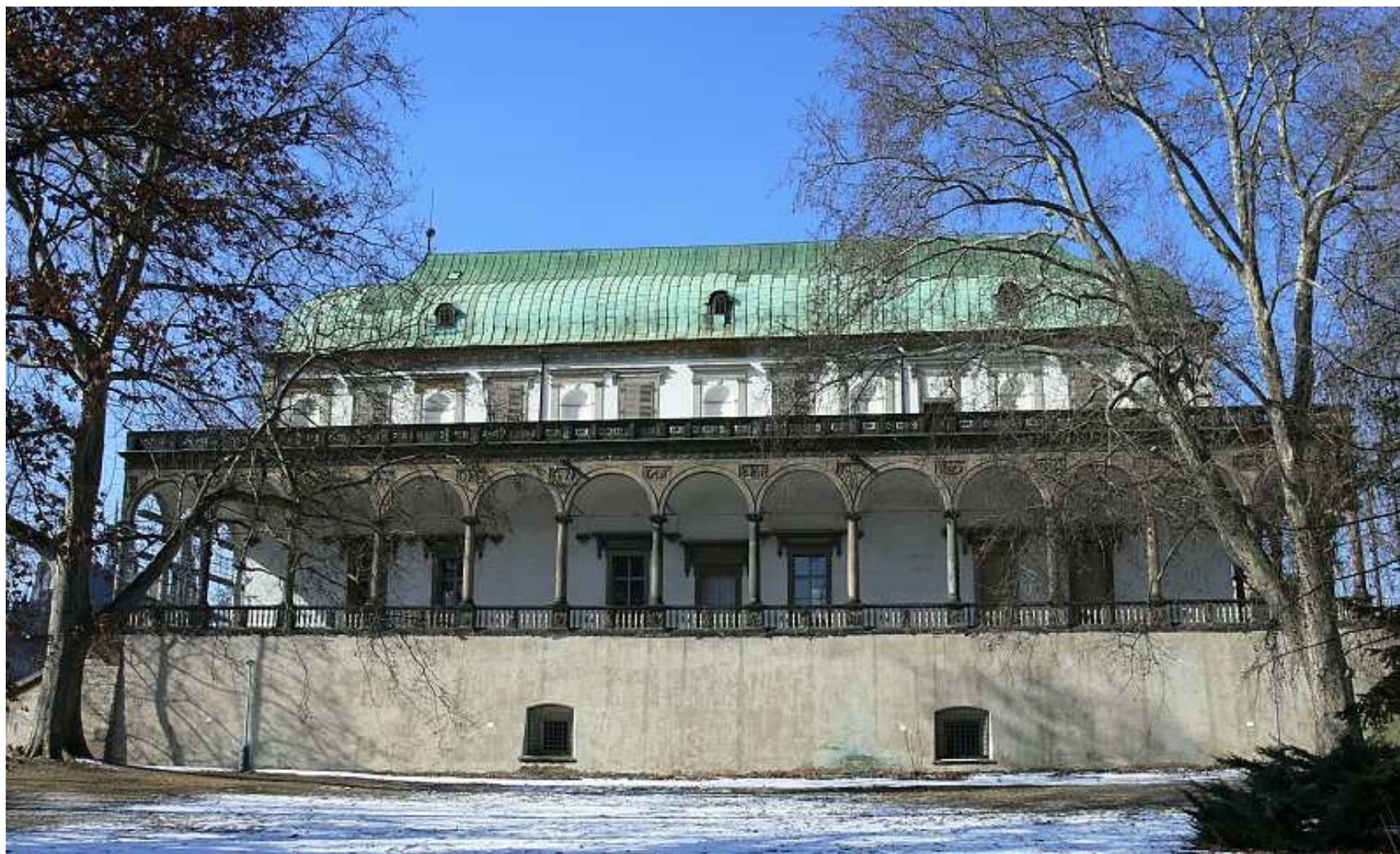
Letohrádek královny Anny