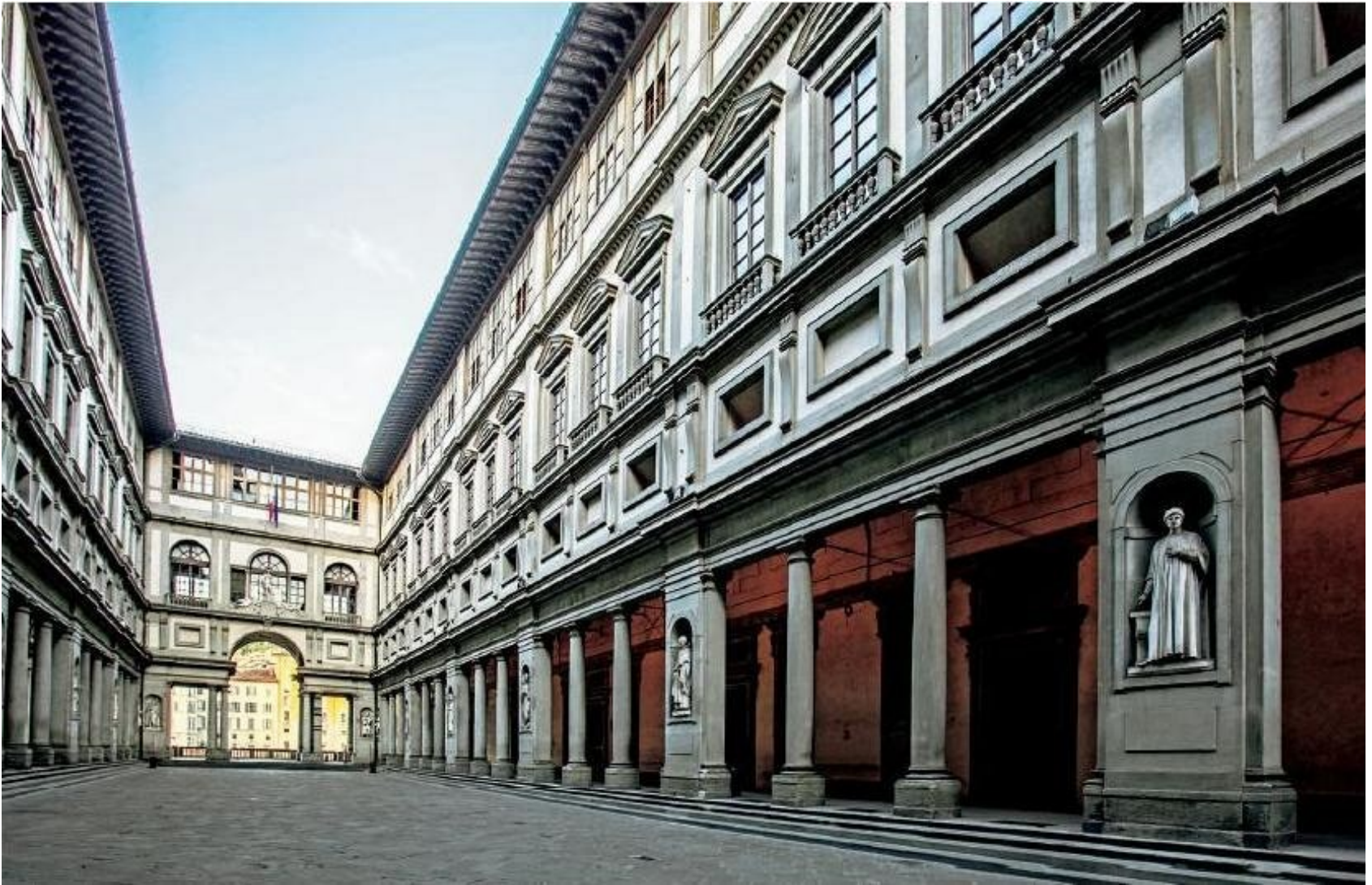
Florence: Galerie Uffizi