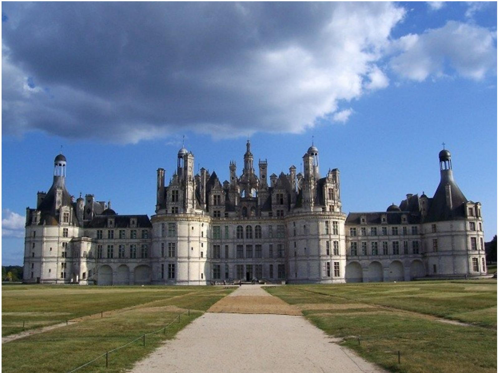
Chambord (zámky na Loiře)