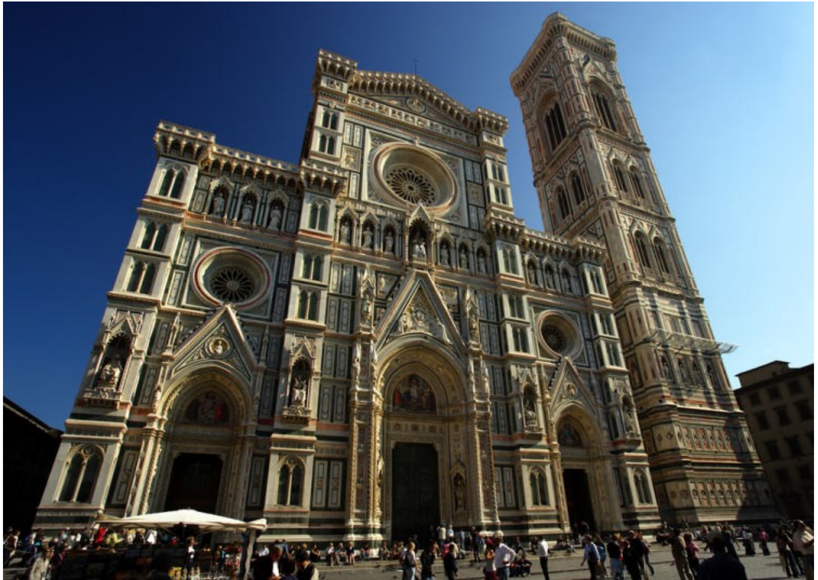
průčelí katedrály Santa Maria Del Fiore