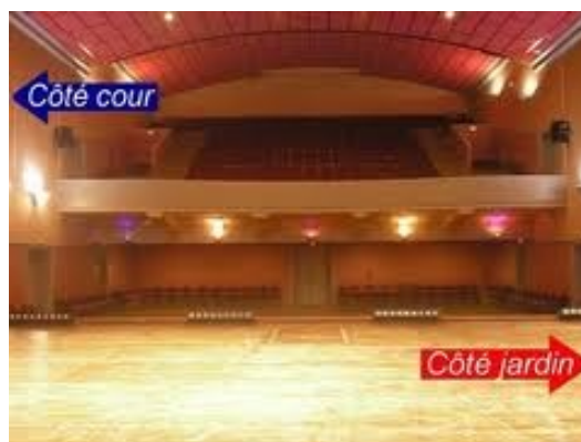
vue de la scène