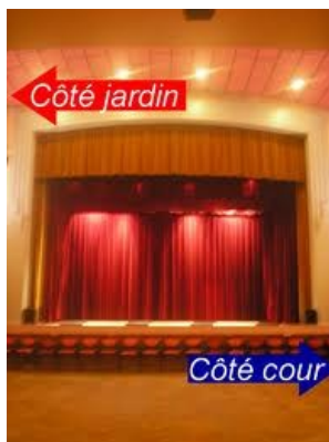
vue de la salle