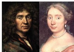
Armande Béjart (vers 1642-1700), épouse de Molière, dite M lle Molière

La couleur verte est aussi considérée comme maléfique, dans le monde du spectacle (exception faite des clowns). Si des comédiens ont trouvé la mort parce qu'ils portaient un costume vert à la peau, on peut attribuer cela aux effets toxiques de l'oxyde de cuivre, ou du cyanure présent dans la teinture verte à une certaine époque. D'autre part, dans les passions du Moyen-Âge, le personnage du traître Judas portait un costume vert. On dit aussi que Molière – qui pourtant, occupait avec sa jeune épouse Armande Béjart un appartement où cette couleur abondait – mourut habillé de vert.