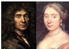
Armande Béjart (vers 1642-1700), épouse de Molière, dite M lle Molière

La couleur verte est aussi considérée comme maléfique, dans le monde du spectacle (exception faite des clowns). Si des comédiens ont trouvé la mort parce qu'ils portaient un costume vert à la peau, on peut attribuer cela aux effets toxiques de l'oxyde de cuivre, ou du cyanure présent dans la teinture verte à une certaine époque. D'autre part, dans les passions du Moyen-Âge, le personnage du traître Judas portait un costume vert. On dit aussi que Molière – qui pourtant, occupait avec sa jeune épouse Armande Béjart un appartement où cette couleur abondait – mourut habillé de vert.