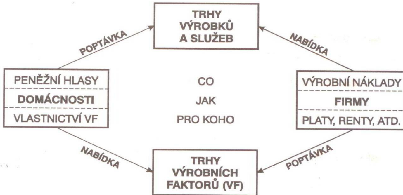
Graf 2-1 Tok výrobních faktorů, výrobků a služeb