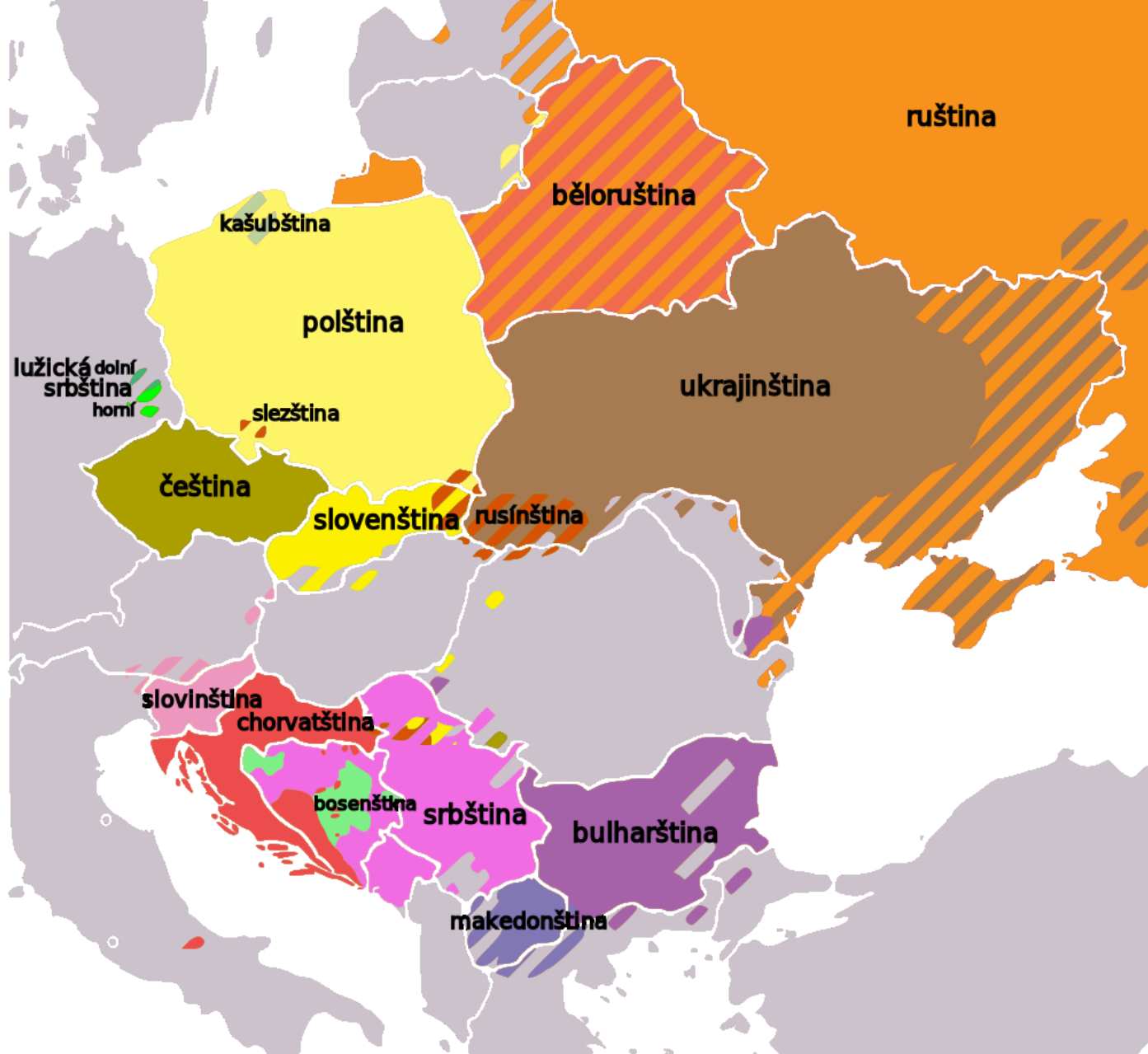
slovanské jazyky (20. stol.)