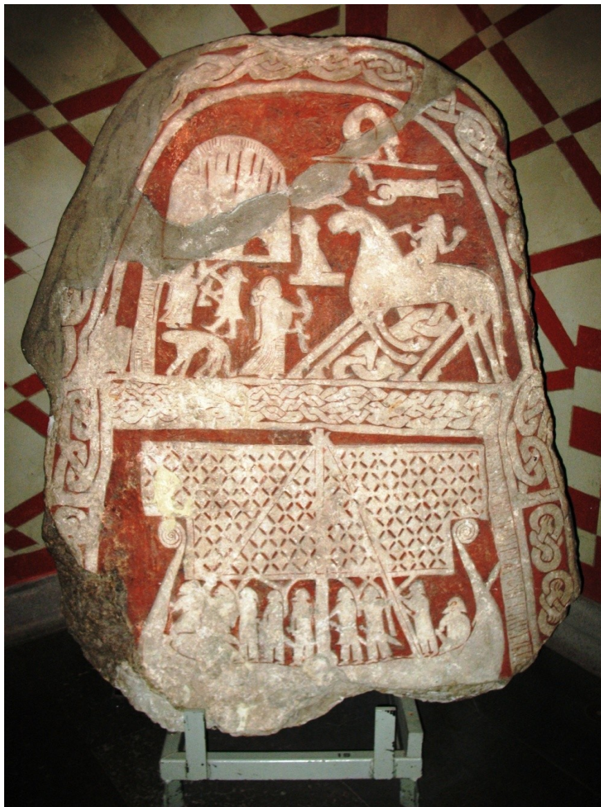
Ódin na svém 8nohém hřebci jede do Valhaly, ženy jsou valkýry (kamenný reliéf, Švédsko)