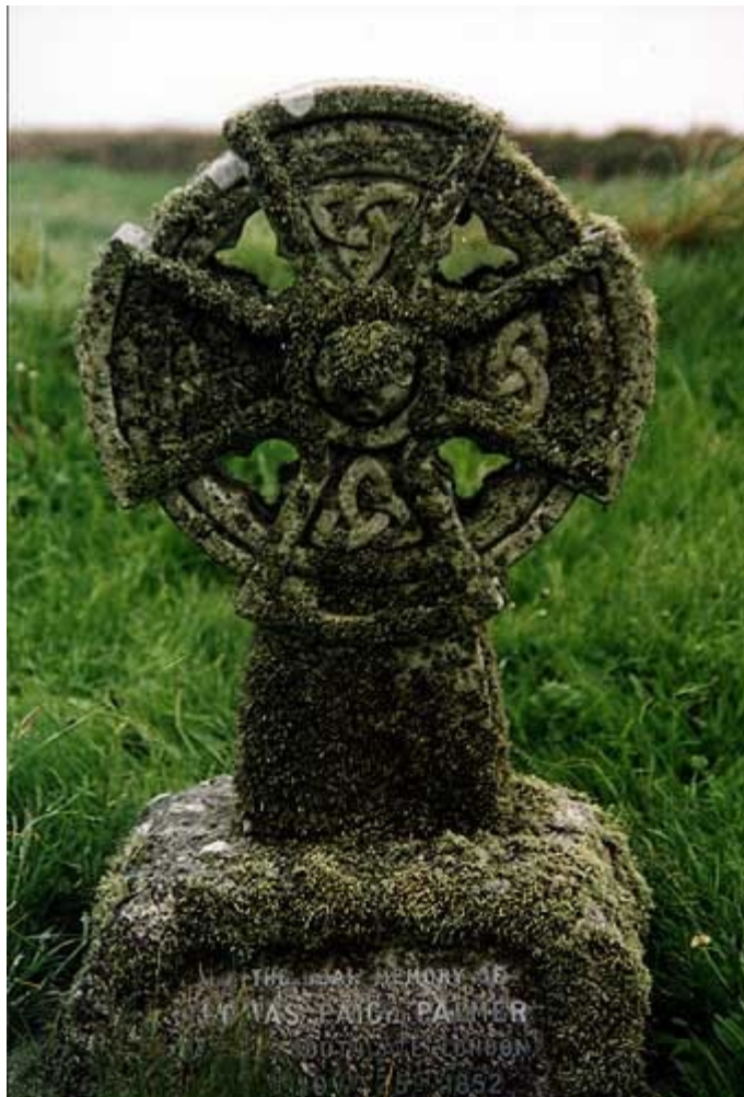
keltský kříž (irský kříž)