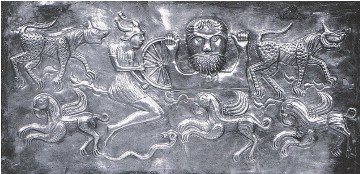
Taranis „hybatel slunce“ (gundestrupský kotel)