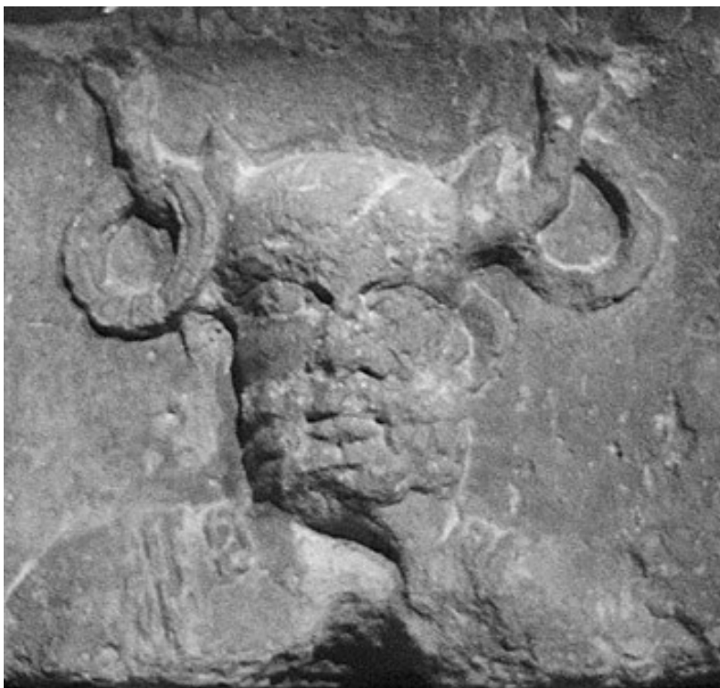
Cernunnos (kamenný reliéf z Paříže a kovová figurka)