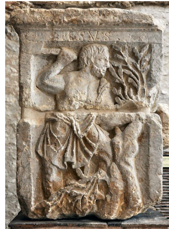
Esus (kamenný reliéf z Paříže)