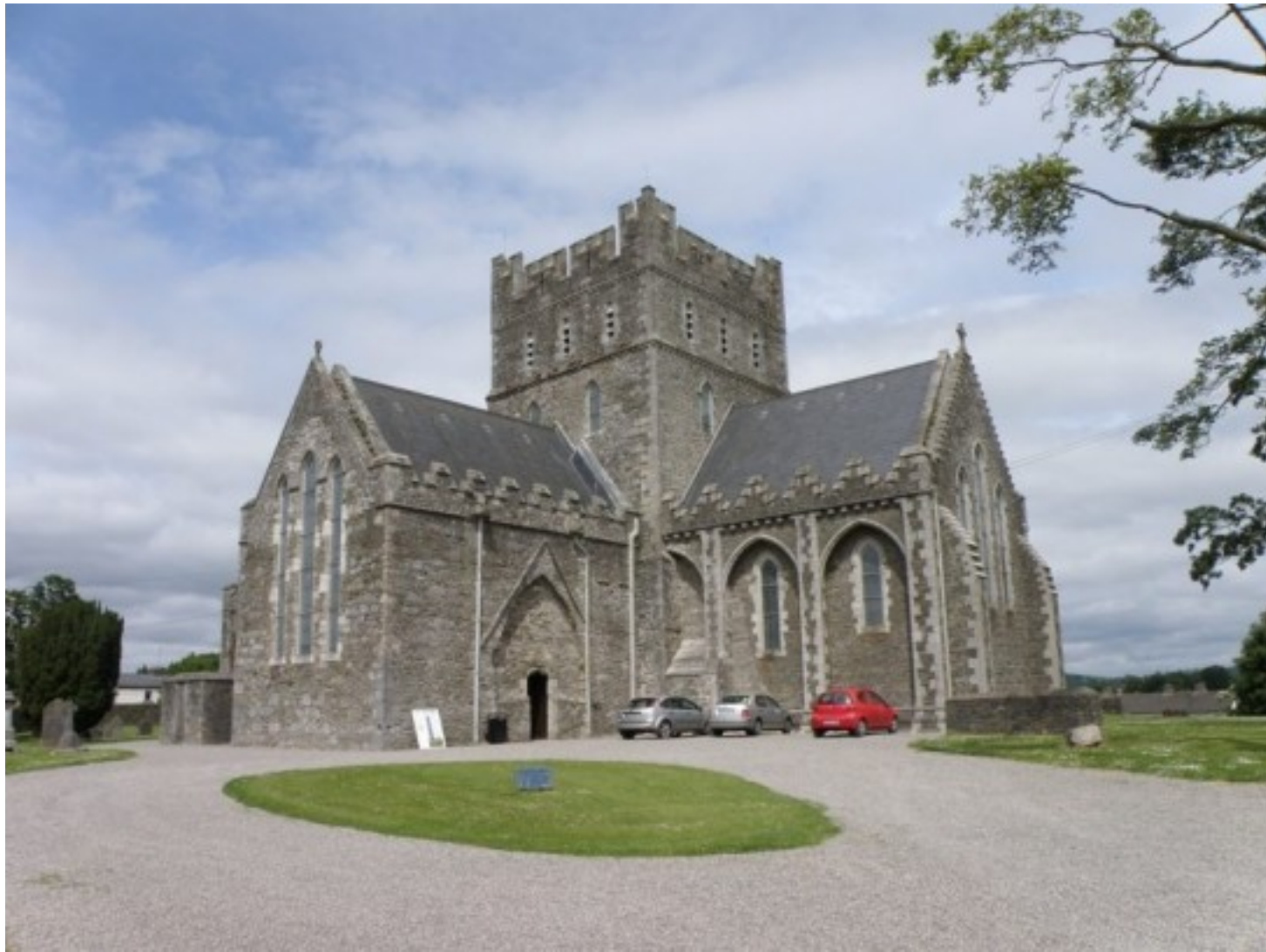
katedrála sv. Brigity v Irsku (město Kildare)