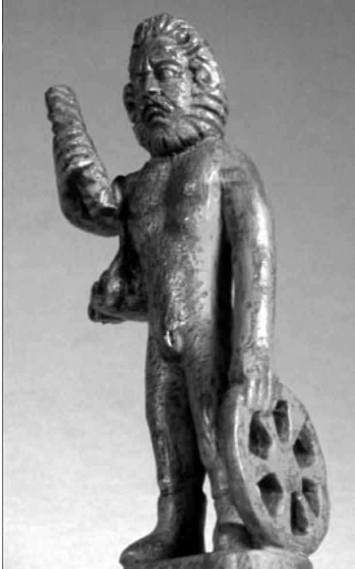
Taranis: galská figurka (vystavena v Musee des Antiquities Nationales, St. Germain-en-Laye)