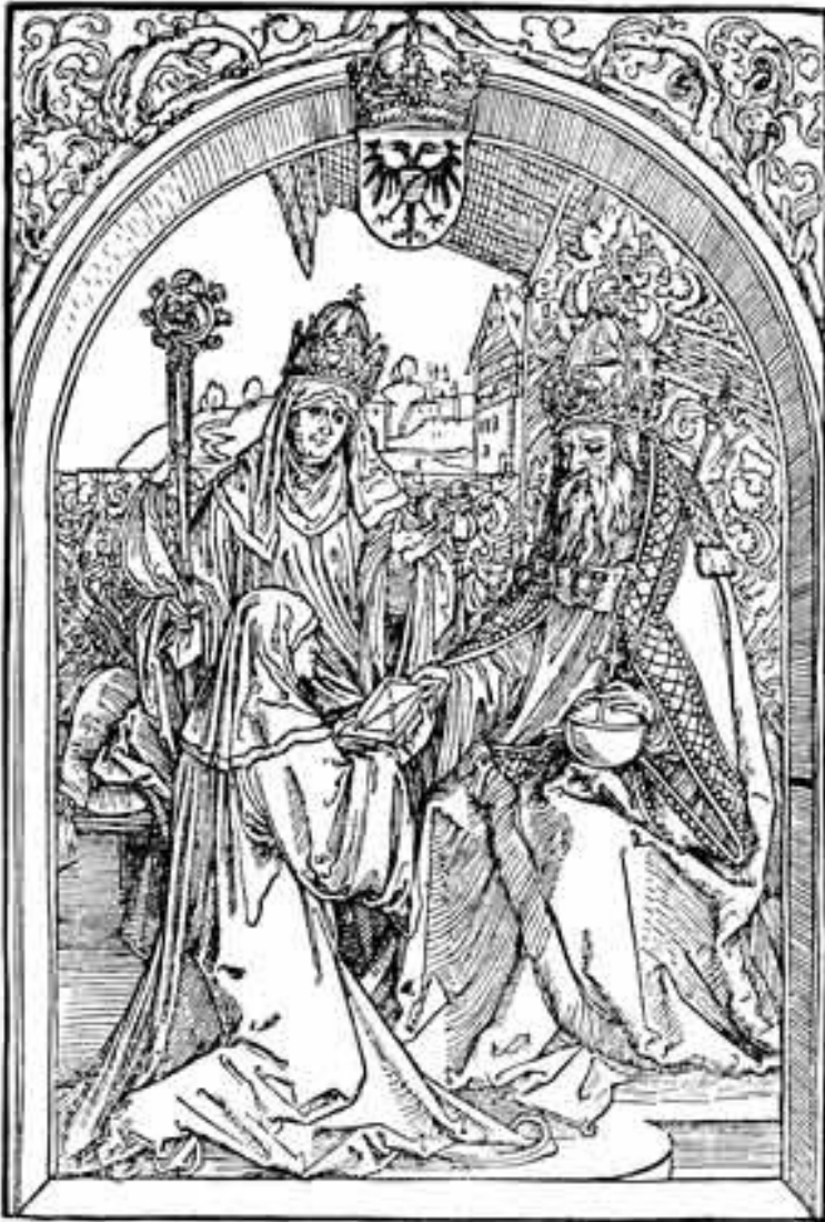
Hroswitha von Gandersheim (Albrecht Dürer)