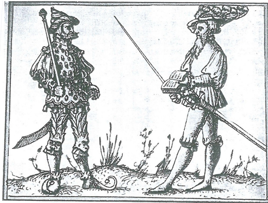
Herold a režisér hry z Curychu 1539.