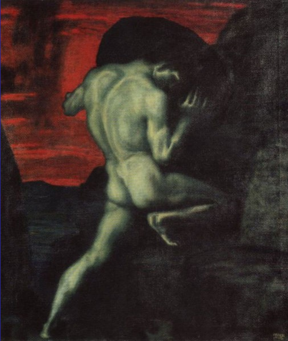
Sisyfos (Franz von Stuck; 1920)