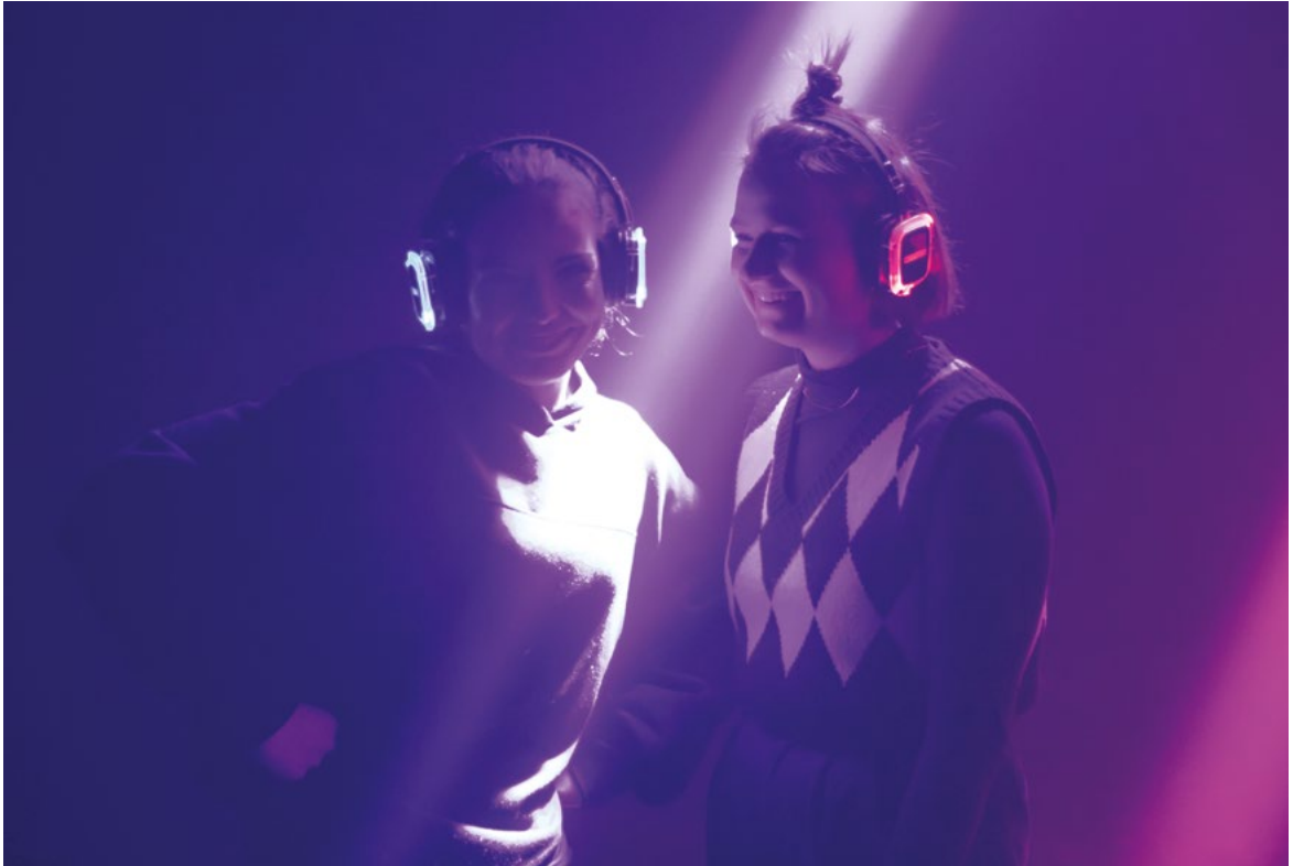
Salon původní tvorby