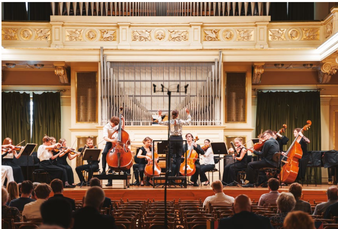
Mezinárodní soutěž Leoše Janáčka