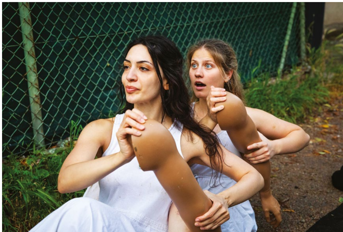
Once upon Time in Kamenka