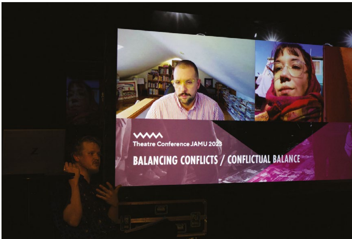
Mezinárodní divadelní konference JAMU