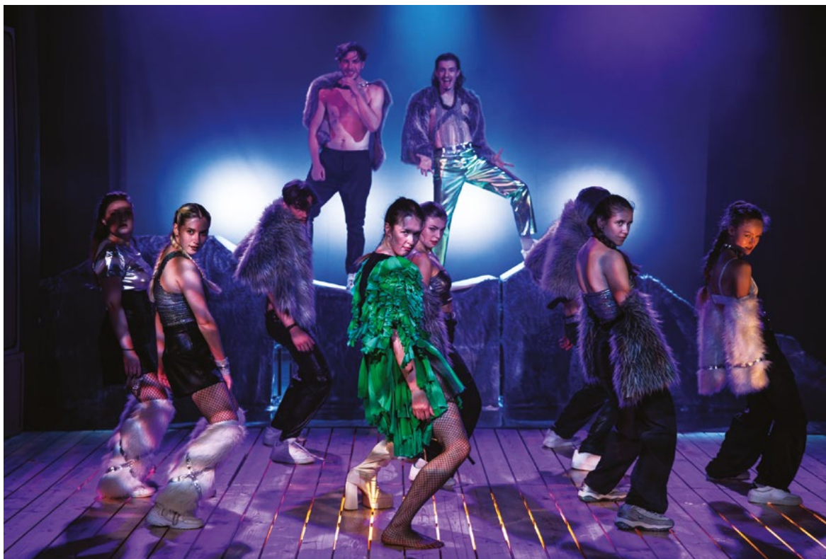
Inscenace Peer Gynt