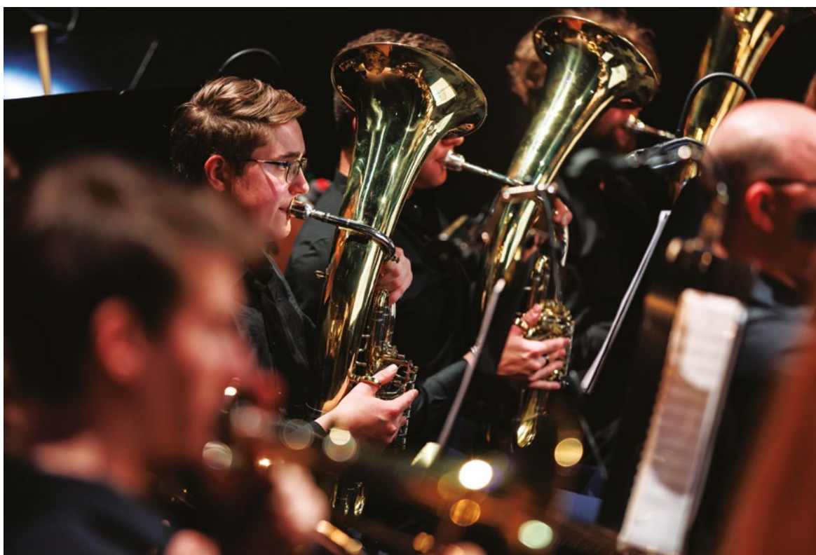
Orchestrální koncert HF JAMU