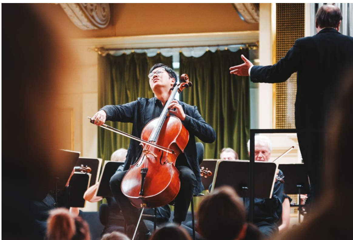
Mezinárodní soutěž Leoše Janáčka