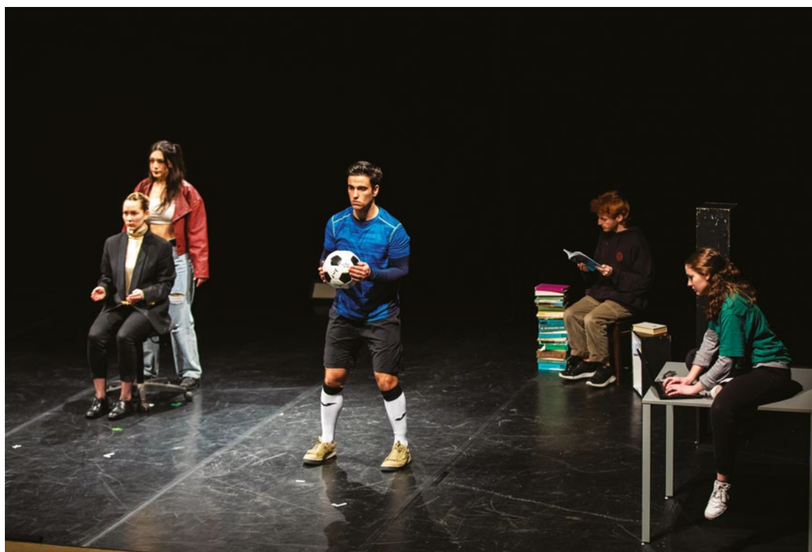
The Engine CoLabs