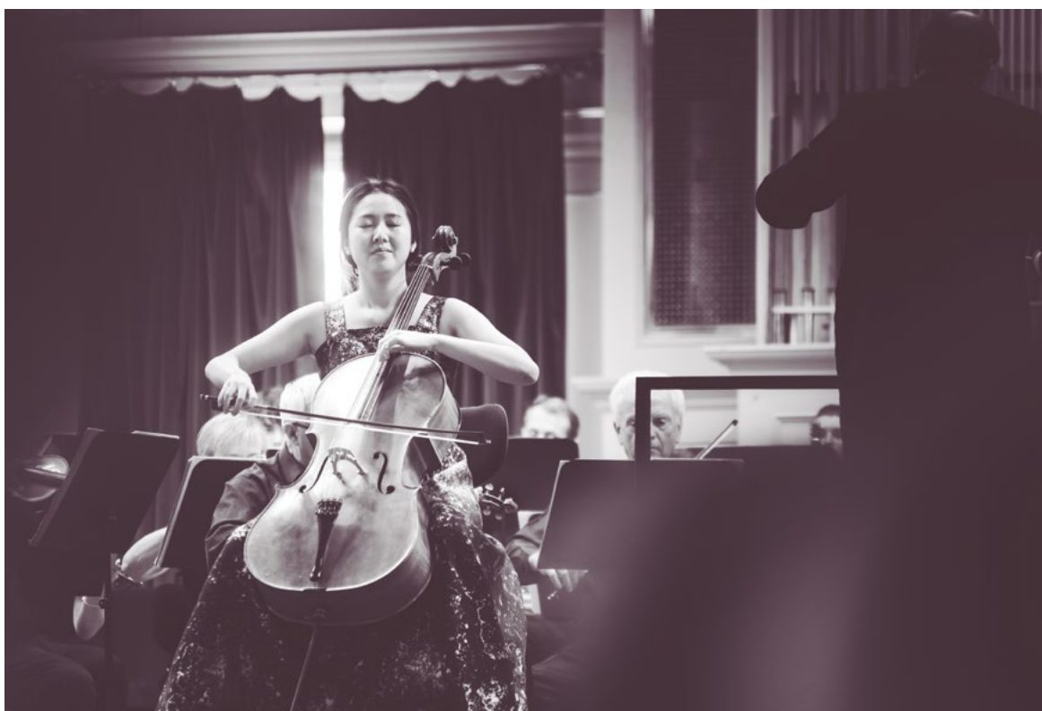
Mezinárodní soutěž Leoše Janáčka