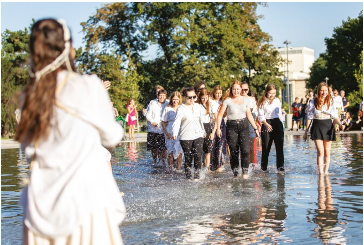
Průvod DF JAMU