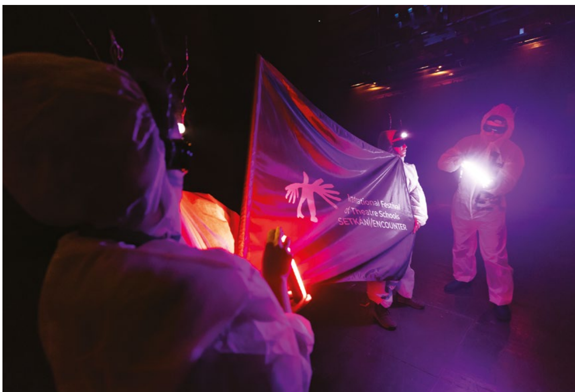
Mezinárodní festival divadelních škol SETKÁNÍ/ENCOUNTER