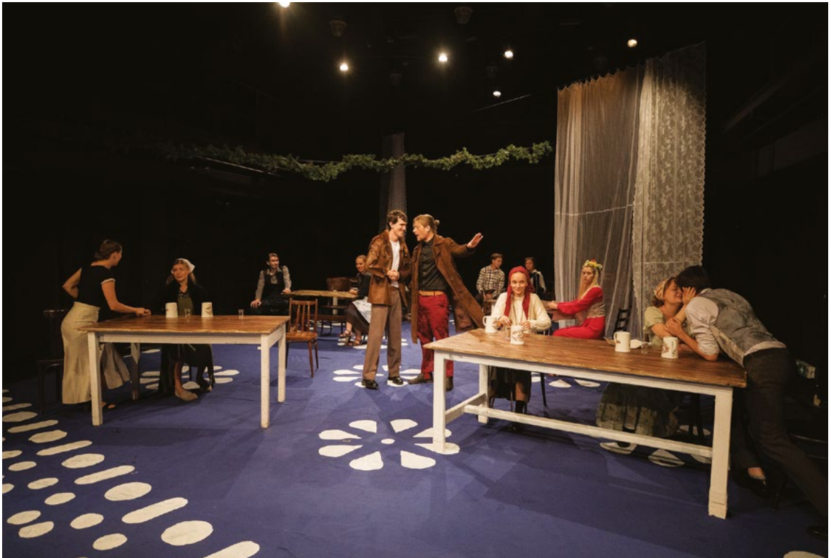
Inscenace Naši furianti