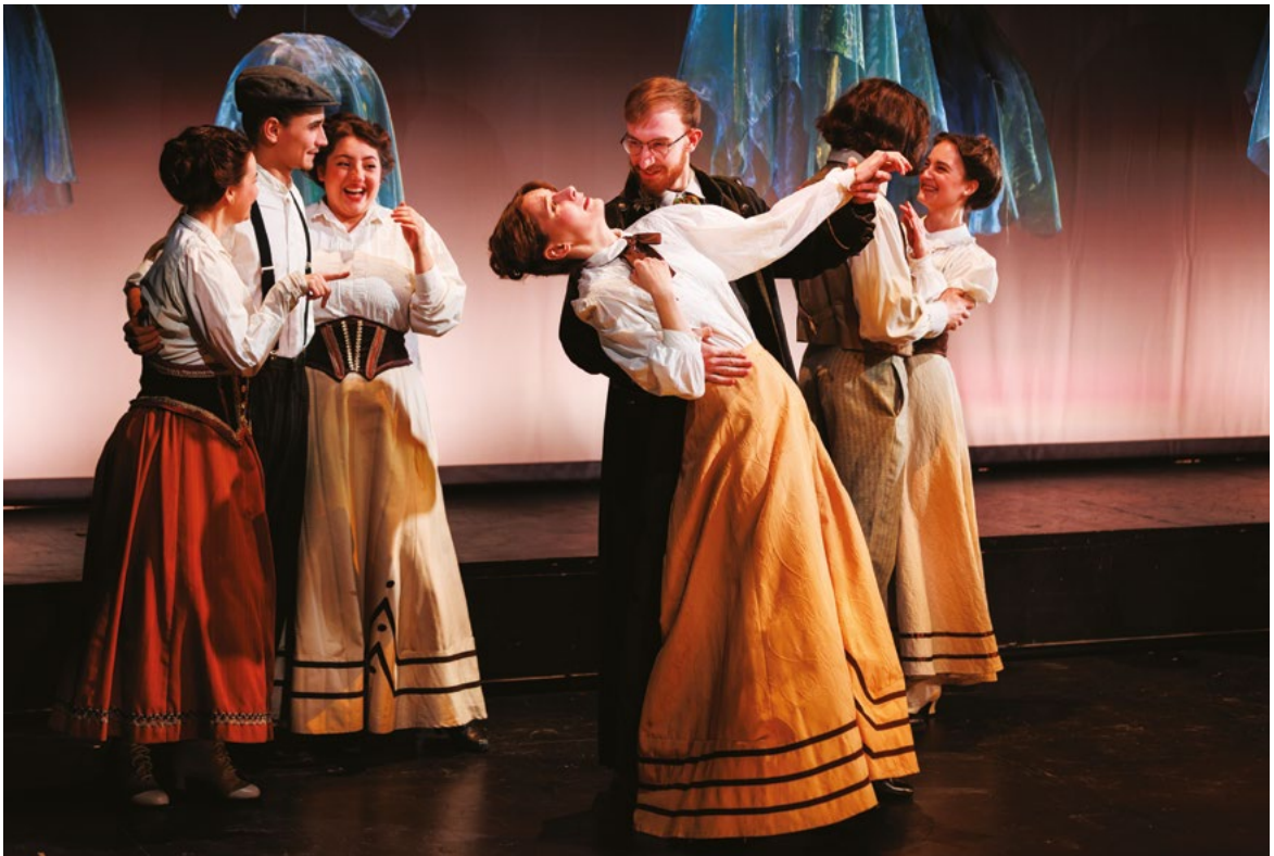
Komorní opera HF JAMU - Dvě vdovy