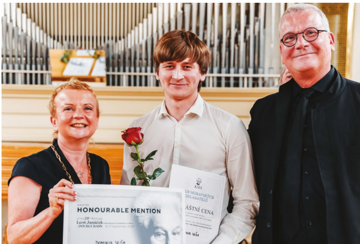
Mezinárodní soutěž Leoše Janáčka