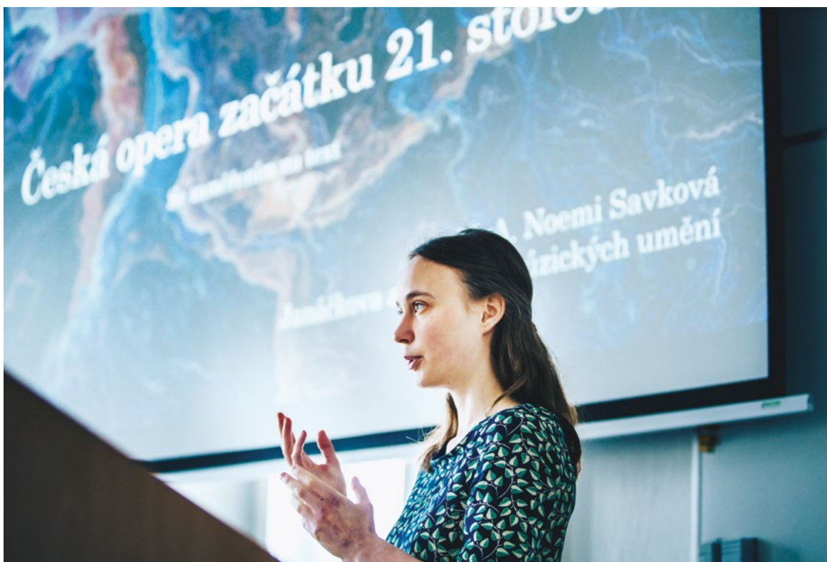
Doktorandská vědecká konference