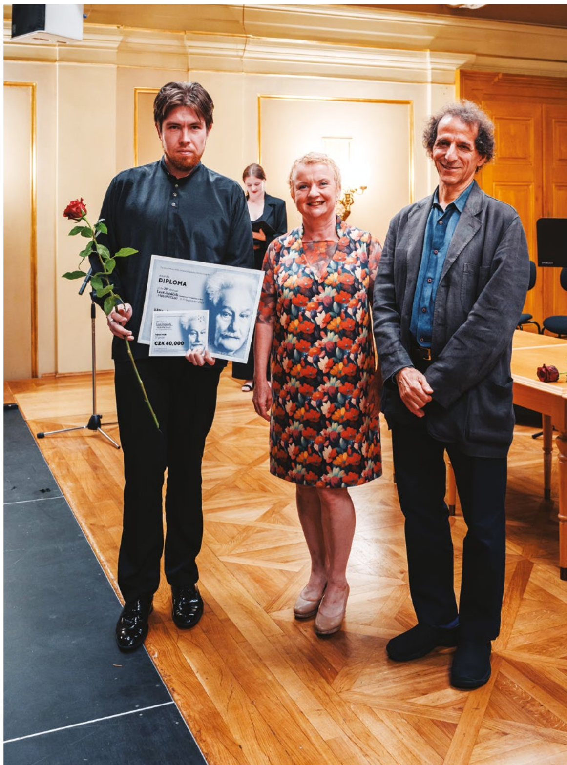
Mezinárodní soutěž Leoše Janáčka