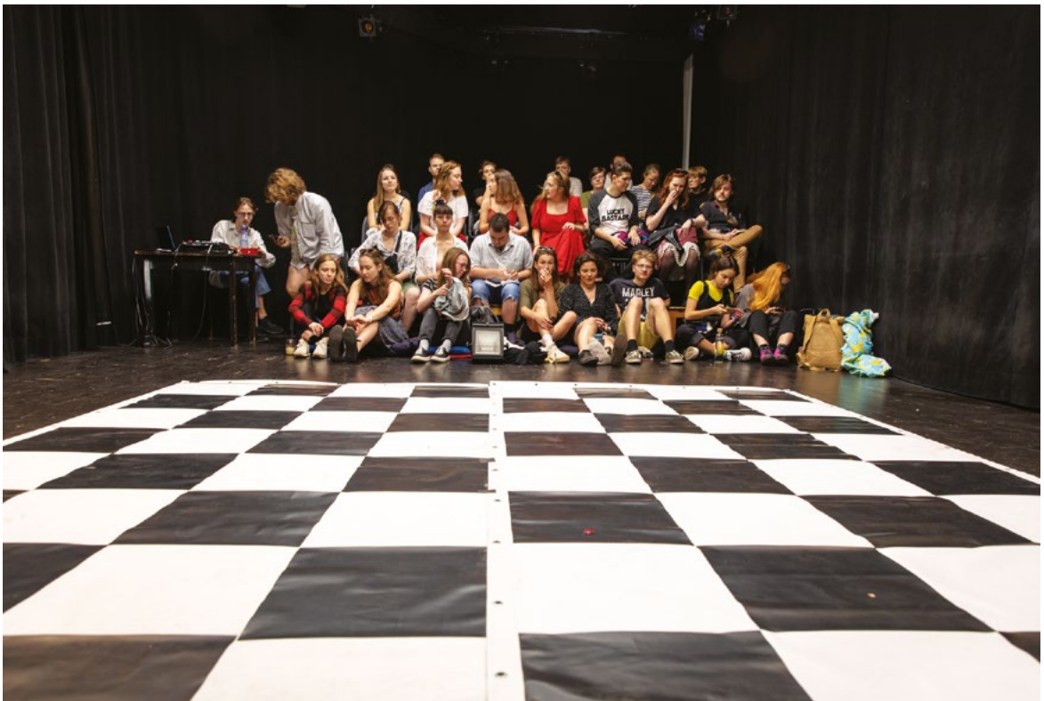
Festival Sítko 2023