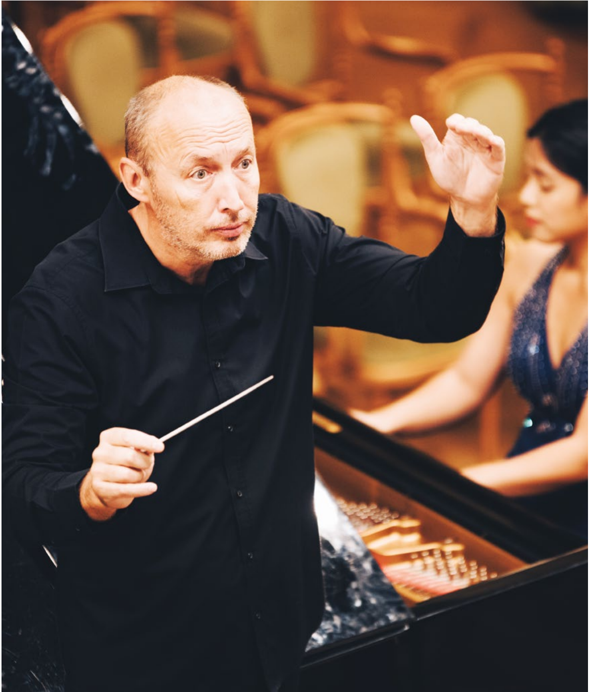
Mezinárodní soutěž Leoše Janáčka v Brně