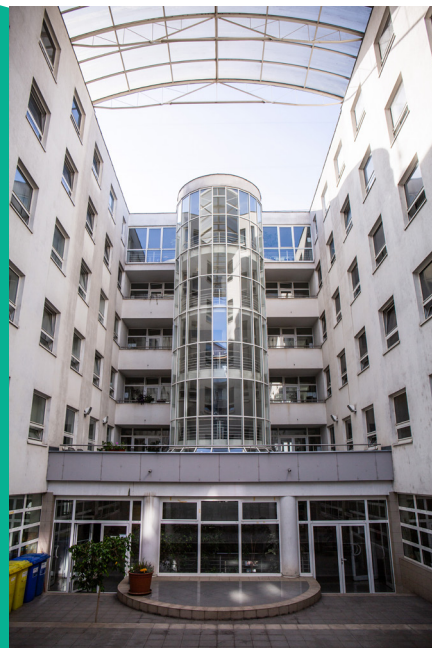
Atrium objektu je k dispozici po celý rok do 22 hod.