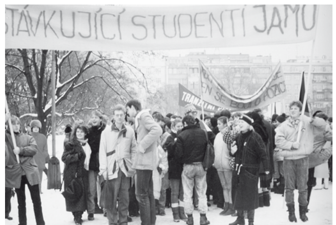
— Studenti JAMU demonstrující —