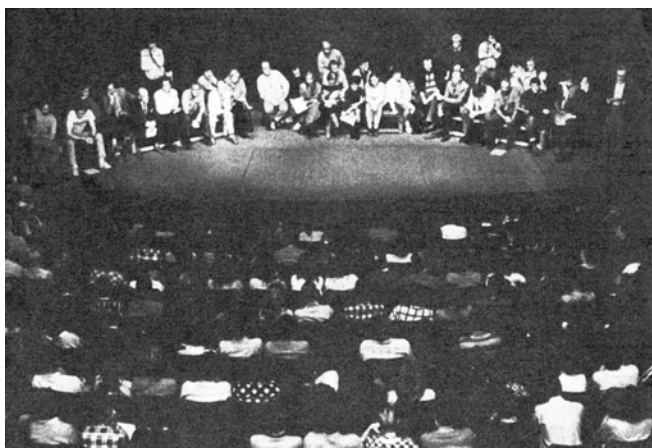
— Soubor Divadla bratří Mrštíků diskutuje s diváky —