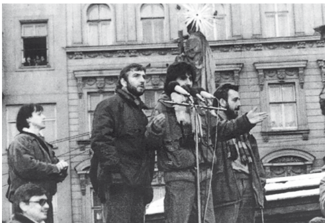
— Herci studiových divadel na náměstí Svobody —

Zároveň s novým pedagogickým sborem bylo nutno školu vybavit novými prostorami. Za celá má tři funkční období jsme nevyšli z rekonstrukcí a získávání nových budov. Nejdříve to byla Marta a pak, po krátkém období fungování Divadelní fakulty v prostorách bývalého Krajského výboru KSČ, jsme získali budovu na Mozartově ulici, o kterou jsme svedli tvrdý boj. Dále jsme zcela rekonstruovali budovu na Komenského náměstí, získali prostory pro rektorát na Beethovenově ulici a posléze bývalý hotel Astoria, nynější Astorku, kde je studentská kolej, knihovna a výukové prostory. Výuka na obou fakultách se postupně rozšiřovala o řadu nových předmětů. Navázali jsme mezinárodní kontakty se sesterskými školami ve Vídni, Štýrském Hradci, Stuttgartu, Dallasu a řadou dalších. Dvakrát jsem se účastnila světového summitu rektorek ve Washingtonu a v Oaklandu. Byli jsme první vysokou uměleckou školou, která získala akreditaci na doktorské studium. Využila jsem nové možnosti