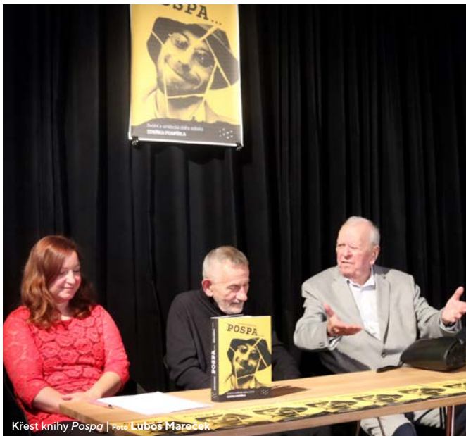
Křest knihy Pospa

Loňský rok se opět nesl ve znamení bojů s pandemií, jež místy znemožňovala, či nejrůzněji komplikovala osobní prodej publikací. Ten se pak zákonitě odehrával zejména po internetu na našem e-shopu či prostřednictvím distribuční firmy KOSMAS a jejich dalších odběratelů z řad široké veřejnosti i jednotlivých knihkupců.