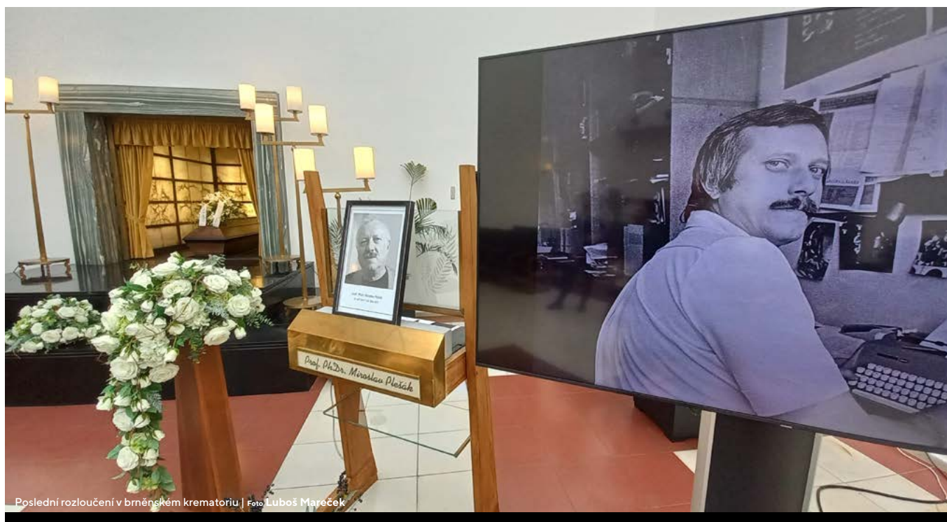
Poslední rozloučení v brněnském krematoriu