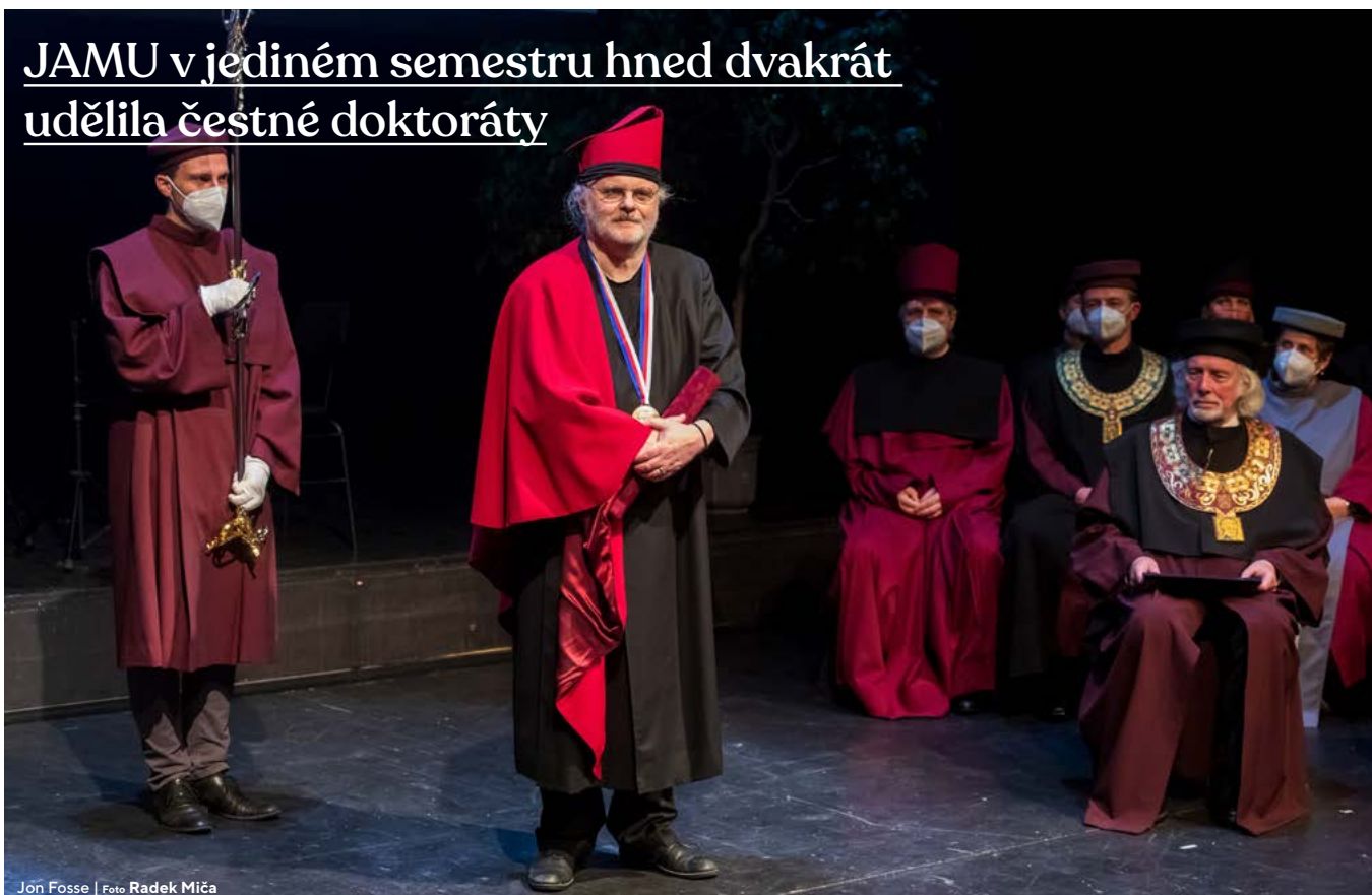
Jon Fosse