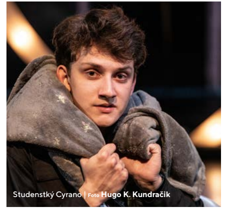
Studentský Cyrano

Adaptace Martina Crimpa vznikla v rámci nového anglického překladu původní Rostandovy hry z 19. století do moderního, současného jazyka 21. století. O český překlad se postarala Ester Žantovská. Aktualizace děje, jak upozornila dramaturgyně Kolomazníková, spočívá i v mírné úpravě některých situací či kontextů: „Například z paštikárny kuchaře