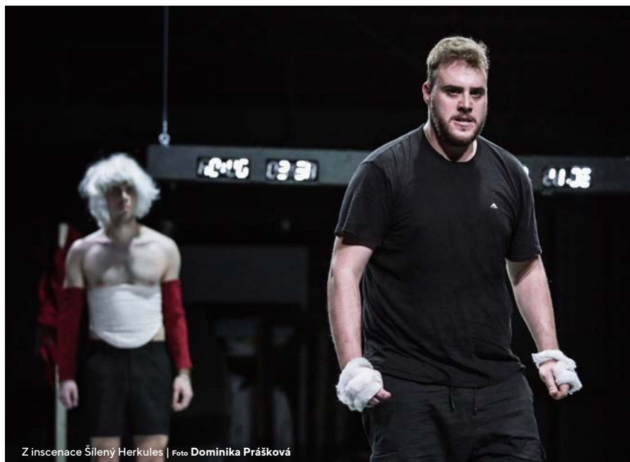
Z inscenace Šílený Herkules