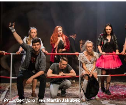
Probuzení jara

Po vynucené přestávce kvůli epidemii nemoci covid-19 se absolventský festival Ateliéru muzikálového herectví Petra Štěpána v Divadle na Orlí nekonal v tradičním květnovém termínu, ale až na přelomu měsíce září a října, kdy proběhly