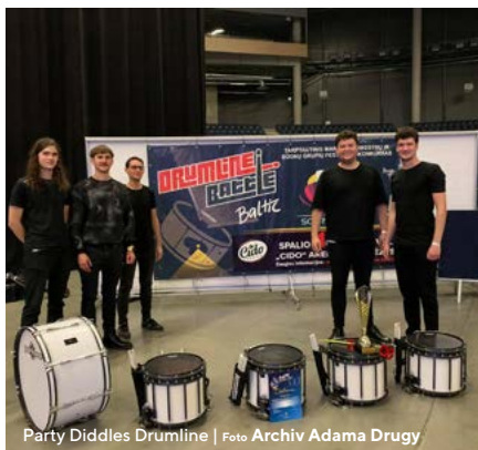
Party Diddles Drumline