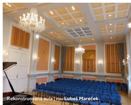
Rekonstruovaná aula