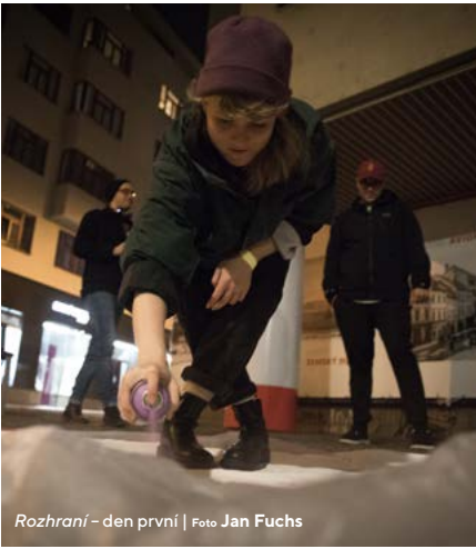
Rozhraní – den první

typická pro prezentaci Divadelní fakulty. Atrium Domu pánů z Kunštátu, piazzetta Janáčkova divadla nebo Římské náměstí a řada dalších míst byly svědky nejrůznějších divadelních a performativních žánrů přes instalace a autorskou poezii až po krátké divadelní útvary. Celý minifestival vyvrcholil videomappingem na fasádu Divadelní fakulty.