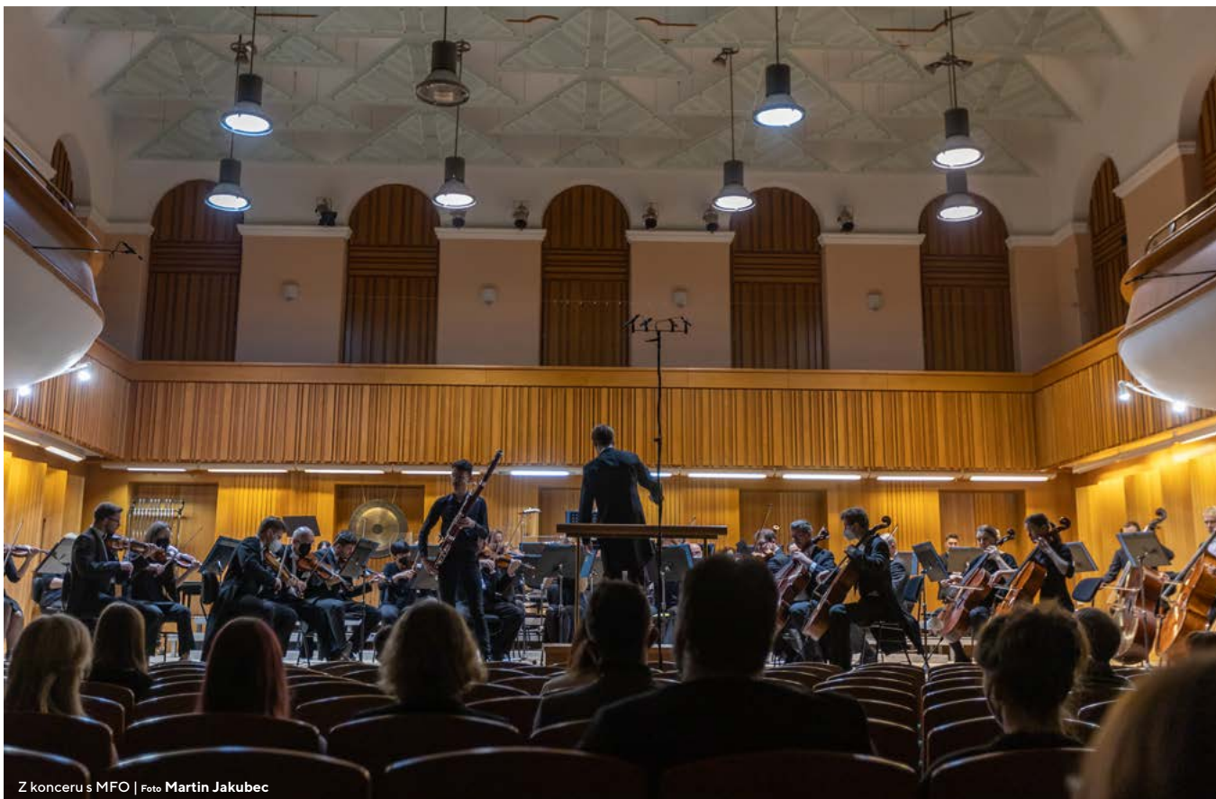
Z koncertu s MFO

Moravská filharmonie Olomouc uvádí studenty HF JAMU a HAMU v rámci nové koncertní řady KONCERTY JAMU. Studenti a absolventi HF oboru dirigování orchestru si tradičně plní své studentské umělecké výstupy ze studia s profesionálním orchestrem. Stejně tradičně se nabízí i studentkám a studentům oboru kompozice možnost slyšet své dílo skutečně „live“ s orchestrem a stejně tak spolupracují HF JAMU a HAMU Praha ve výběru sólistů na tyto koncerty.