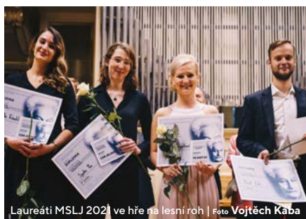
Laureáti MSLJ 2021 ve hře na lesní roh