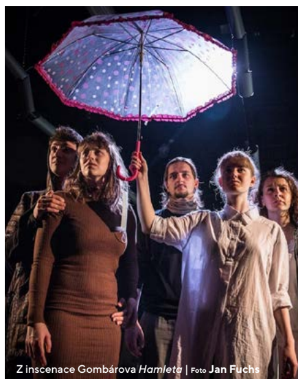
Z inscenace Gombárova Hamleta