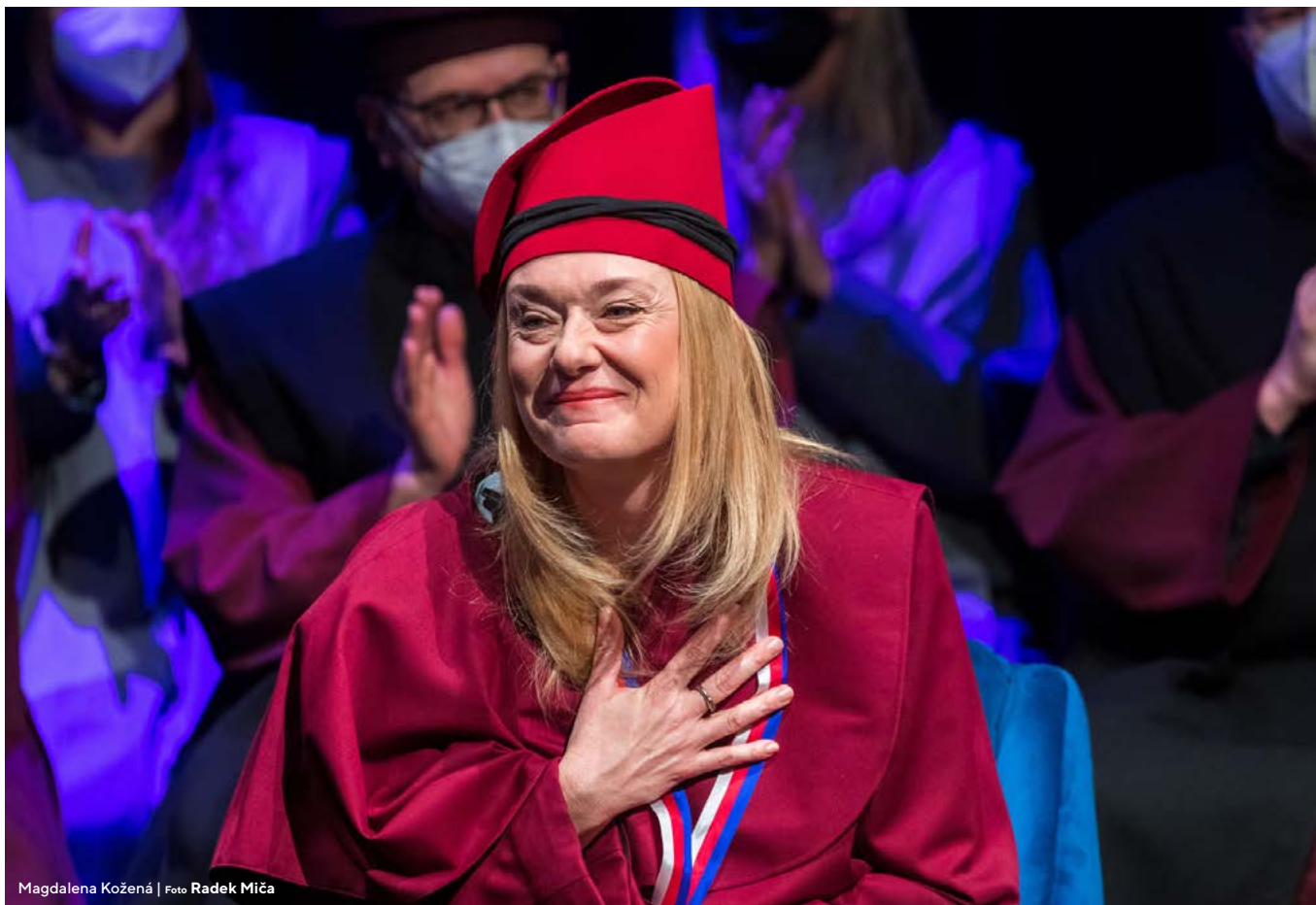
Magdalena Kožená

Mezinárodně renomovaní umělci – česká operní a koncertní pěvkyně Magdalena Kožená a britský orchestrální i operní dirigent Sir Simon Rattle – se 18. ledna 2022 stali novými čestnými doktory Janáčkovy akademie múzických umění. Nejvyšší ocenění brněnské akademie si osobně převzali v brněnském Divadle na Orlí.