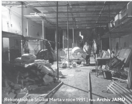
Rekonstrukce Studia Marta v roce 1991