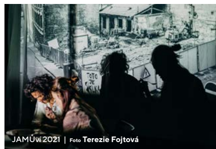
JAMŮví 2021

Čtvrtý ročník festivalu JAMŮví se konal ve dnech 11. – 12. 11. 2021. Tentokrát s tématem „Pořád Svízel“. Kromě filmové tvorby