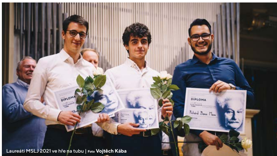
Laureáti MSLJ 2021 ve hře na tubu