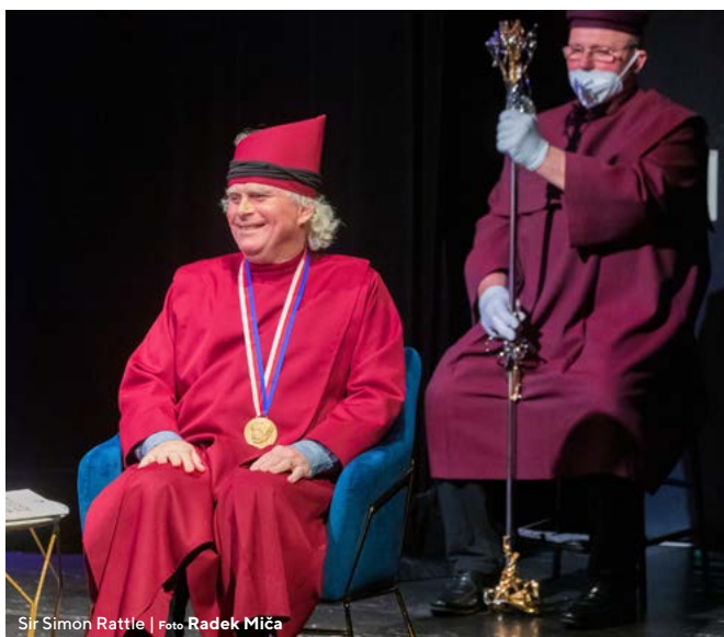
Sir Simon Rattle