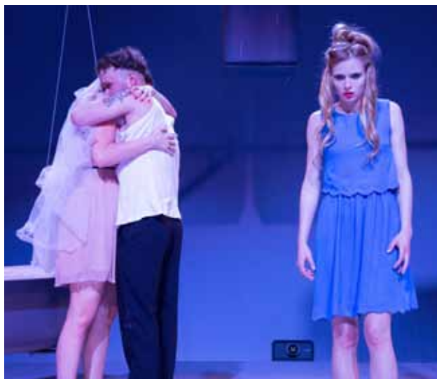
Studenti DAMU představili na festivalu nejnovější text Ivana Vyrpajeva nazvaný Opilí , jehož světová premiéra proběhla v únoru 2014 v Düsseldorfer Schauspielhaus .