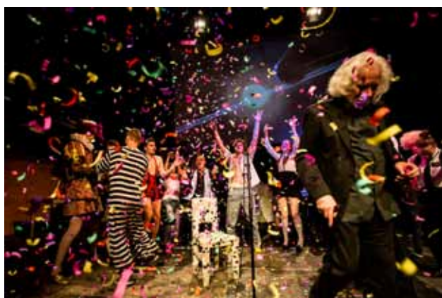
Závěrečný ceremoniál festivalu se již tradičně odehrál v Divadle Husa na provázku a byl pestrý i emotivní.