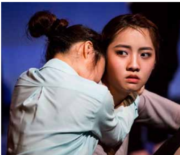
Tchajwanští divadelníci patřili na festivalu mezi nováčky. Kultura Tchajwanu je zcela svébytná, školu z Taipei reprezentovala inscenace Ostrov .