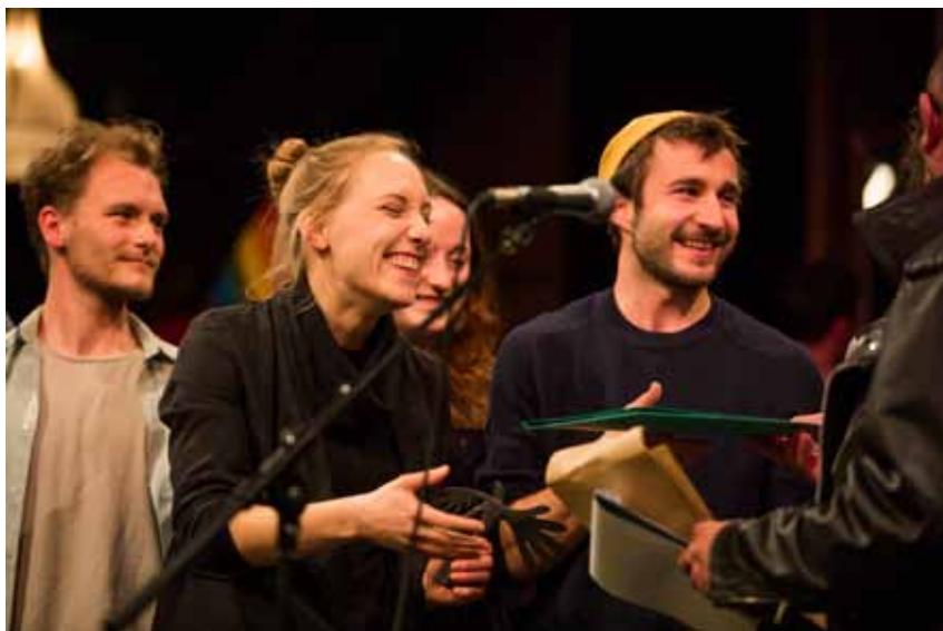
Studenti z Akademie múzických umění Baden-Württemberg v Ludwigsburgu při závěrečném ceremoniálu.