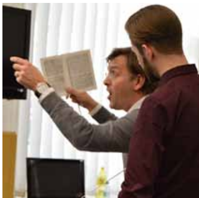
Tomáš Netopil (vlevo) a Jiří Habart

Tomáš Netopil patří mezi nejvýraznější české dirigentské osobnosti střední generace, spolupracuje se světovými orchestry a operními domy. Dovolte mi jejich výčet: Deutsche Oper Berlin, Wiener Staatsoper, Sächsische Staatsoper Dresden, Bayerische Staatsoper München, Operá national de Paris, De Vlaamse Opéra, De Nederlandse Opera, Palau de Les Arts Reina Sofia Valencia, Teatro La