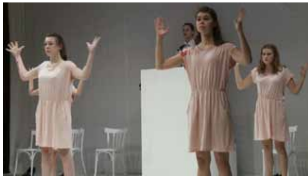
U odborné i studentské poroty nejvíce bodovala inscenace Uštknutí z pařížské konzervatoře.

o všech představeních, divadle, filmu a také o naší budoucnosti. Slyšeli jsme spoustu skvělých věcí i některé negativní, ale bylo to vše opravdu velmi inspirující. Cítili jsme, že i když žijeme odděleni hranicemi, máme stejné obavy a sny. Festival byl neuvěřitelně dobře organizovaný, Brno je tak nádherné místo, že si vlastně nedokážu představit, že jsem tady naposledy. Upřímně a moc děkuji!