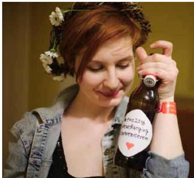
Autorka textu s nejhezčím festivalovým dárkem

Příprava závěrečného ceremoniálu byla doslova až do poslední vteřiny obrovským dobrodružstvím. Nikdo z nás se ale nezalekl žádné nejistoty ani výzvy. Ačkoli nebyl prostor pro jakékoli debatování a herci dostávali striktní a jasné pokyny, zhostili se toho s energií, potřebnou dávkou tendence upozor-