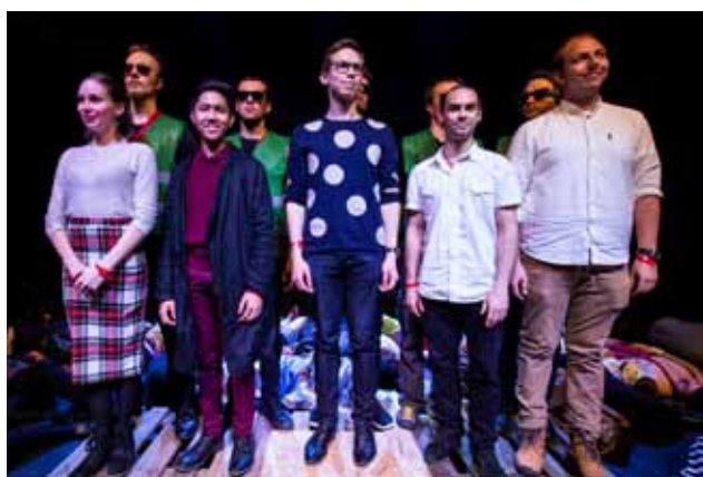
Studentská porota letos na festivalu udělila The SWAG of SETKÁNÍ/ENCOUNTER.