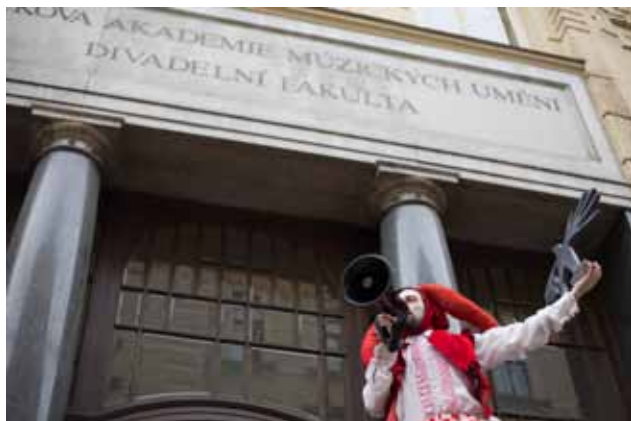
Průvod mezinárodního festivalu divadelních škol Setkání/Encounter už tradičně vychází od pořadatelské Divadelní fakulty JAMU.