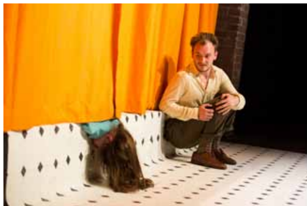
Vytvoření dynamického scénického a kostýmního designu ocenila mj. porota v představení 5. 11. 6. (mrtvý) 15. 6. (vzkříšení) z Akademie múzických umění Baden-Württemberg v Ludwigsburgu.