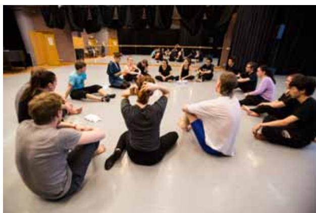
Mimo představení hlavního programu festivalu a off-programová představení z DIFA JAMU byly připraveny také workshopy zaměřené na současné trendy fyzického divadla.