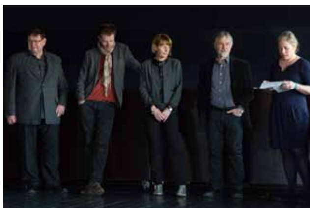
Setkání pedagogů a hostů festivalu je už tradiční součástí přehlídky.