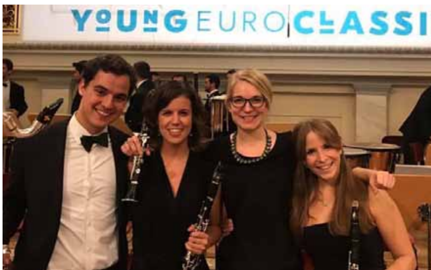
Anna s kolegy ze skupiny klarinetů GMJO (druhá zprava).

Sólisté a oba dirigenti byli skvělí, ale od těch se to tak nějak automaticky očekává. Byli to spoluhráči, kteří mě inspirovali nejvíce. Ocitla jsem se totiž ve skvělé klarinetové skupině složené ze dvou studentů pařížského Superioru a jedné Italky, která je zvána jako sóloklarinetistka do mnoha orchestrů v Evropě. Byli to ale mnozí další, kteří mě fascinovali svým hraním, charakterem a tím, jak to mají v hlavě srovnané. A nejvíce si člověk vždycky může vzít od lidí ve stejném věku.