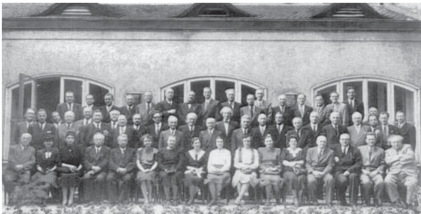
— Účastníci setkání u příležitosti založení JAMU v roce 1947 se po slavnostním obědě v hotelu Grand společně vyfotografovali —

Nebýt pozvání Jana Masaryka na večerní soirée, nebylo by rozmluvy s Nejedlým.