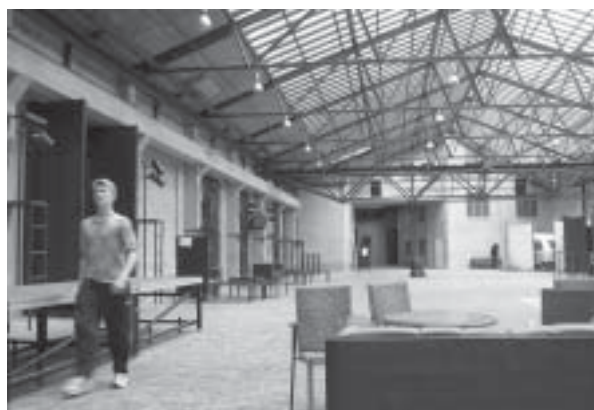
— Zastřešený dvůr Divadelní akademie (Teak) je ideálním místem pro setkávání studentů —