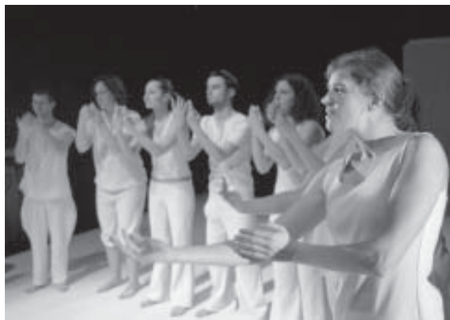
— Bajky a sny —