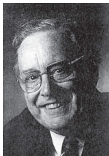
— 30. ledna 2004 převezmé Sir Charles Mackerras čestný doktorát JAMU

Nadace vydala Kalendárium akcí k tomuto roku, v němž je zaznamenáno na 70 různých programů od vědeckých konferencí (např. FF MU k literární opeře) přes koncerty, operní představení, výstavy. Jubilejní rok je rozdělen na dvě poloviny i obsahově: v lednu a začátkem února 2004 proběhne přehlídka operního díla – mimochodem, v úplnosti takto operní dílo zaznělo naposledy v r. 1958. Koncem září zahájený „Moravský podzim“ pak přinese Janáčkovy díla komorní a orchestrální. Avšak ani v mezidobí nezůstane Brno bez připomínek Janáčkovy díla. Na závěr operního festivalu