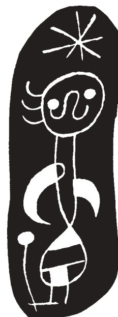
Pokračování na str. 12 — Kresba Joan Miró —

Protože existenční plocha scénické hry se obecně zužuje, považujeme za správné obohatit výuku filmovou tvorbou. Ateliér, který vzniká na Divadelní fakultě, stavíme vedle již vyučovaných oborů vědomě, protože komedie vždy stála především na hereckých individualitách: Burian, Voskovec–Werich, Sovák, Horníček, Zázvorková, Polívka, s tím, že ve většině případů se umění interpretační vázalo na určitou míru autorské tvorby. Ostatně jmenovaní se všichni uplatnili jak v divadelní, tak filmové tvorbě. Z celosvětového hlediska je možné tvrdit, že od vzniku filmu a první laviny němé grotesky sledujeme neuzavřený tok komedie, byť obohacené o zvuk a tedy slovo s větší či menší zástupností dodnes.