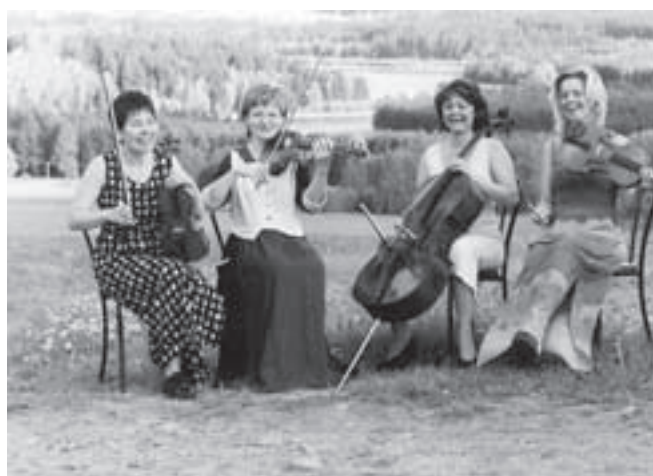
— Donna Quartet —