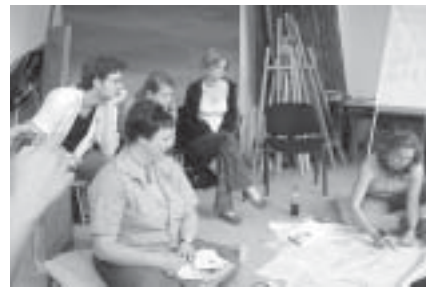
— Práce v týmu na fiktivním mezinárodním projektu

Přesto byly pro nás – mladé manažery – možnosti a podněty celé konfe-