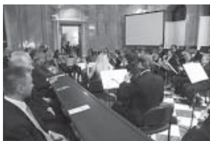
— S mimořádným ohlasem se setkala při zahájení konference na Nové radnici vystoupení Janáčkova akademického orchestru Hudební fakulty JAMU