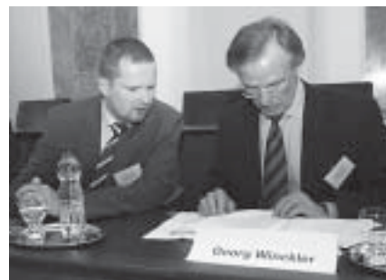
— Prezident EUA a rektor Vídeňské univerzity Georg Winckler (vpravo) s rektorem Masarykovy univerzity Petrem Fialou při zahájení konference

Další zajímavostí brněnské konference bylo, že většina programu probíhala v prostorách brněnské Nové radnice – plenární zasedání a koncert v nově restaurovaném Rytířském sále, a neoficiální setkání při občerstvení v Křížové chodbě. To vytvářelo nejen meziuniverzitní atmosféru, ale také atmosféru spojení brněnských univer-